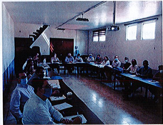
Sesión Edilicia No.7 de Comisión de Participación Ciudadana, Reglamento y Medio Ambiente.