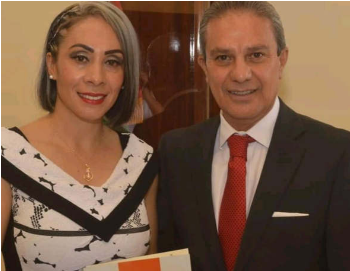
06 DE SEPTIEMBRE 2019. ENTREGA AL PLENO DEL AYUNTAMIENTO DEL PAQUETE DEL PRIMER INFORME DE GOBIERNO DEL PRESIDENTE MUNICIPAL.