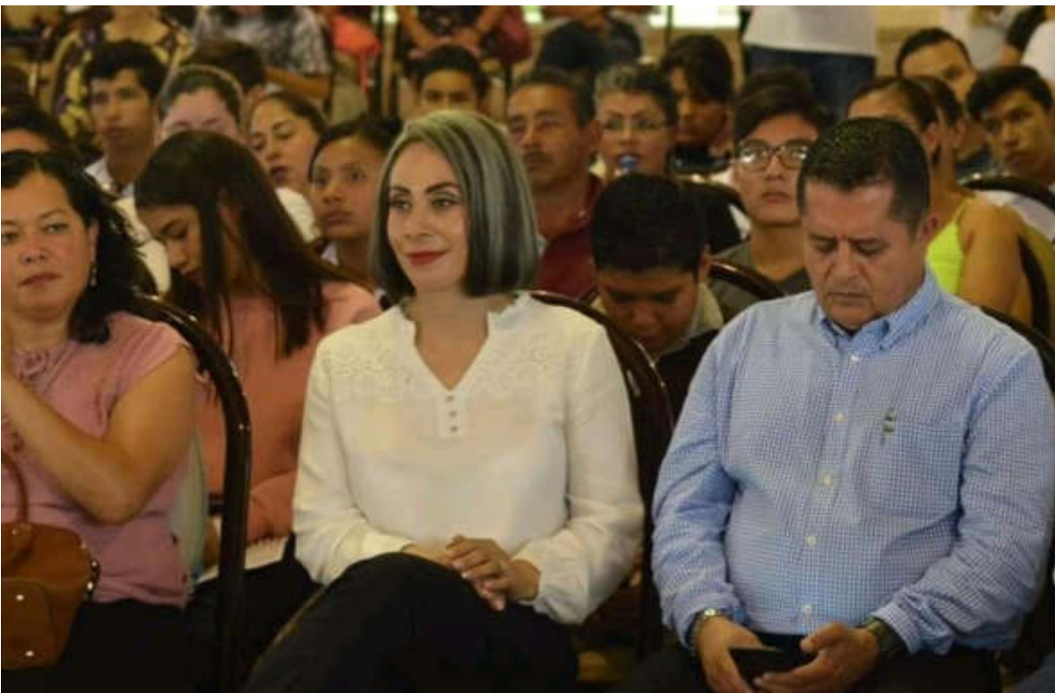
11 DE SEPTIEMBRE 2019. ASISTENCIA AL EVENTO DE ENTREGA DE TARJETAS DEL PROGRAMA MI PASAJE.