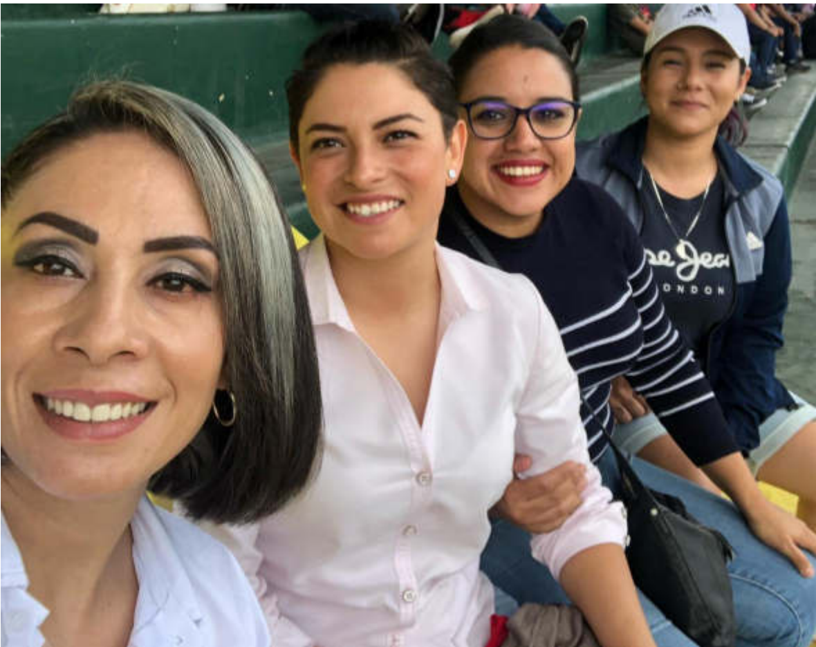
21 DE JULIO 2019. PARTIDO DE FÚTBOL FEMENIL ZAPOTLAN EL GRANDE VS SAN JUAN DE LOS LAGOS. ESTADIO SANTA ROSA.