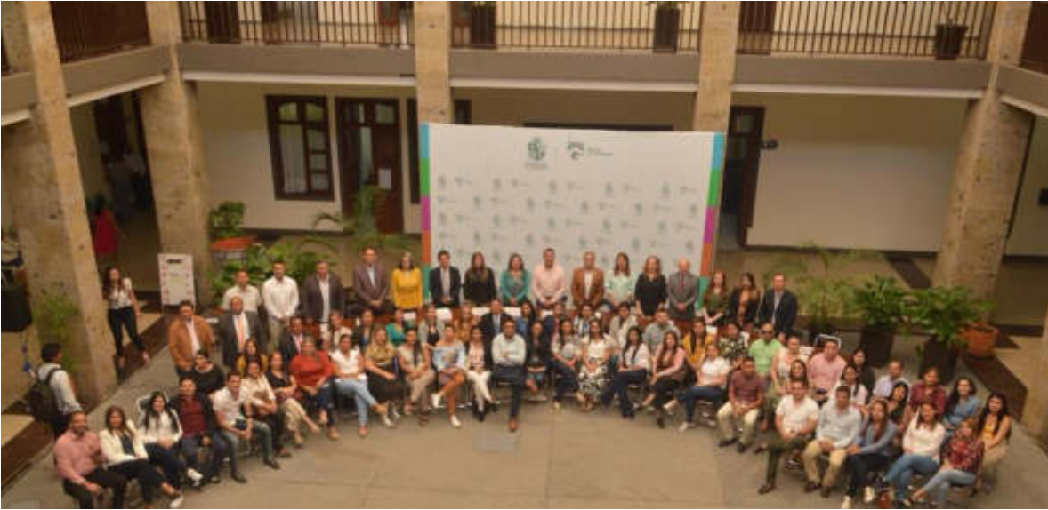
29 DE AGOSTO 2019. ENTREGA DE RECONOCIMIENTOS COMO VISITANTES DISTINGUIDOS A ESTUDIANTES DE DE LA COORPORACION UNIVERSITARIA DEL CARIBE.