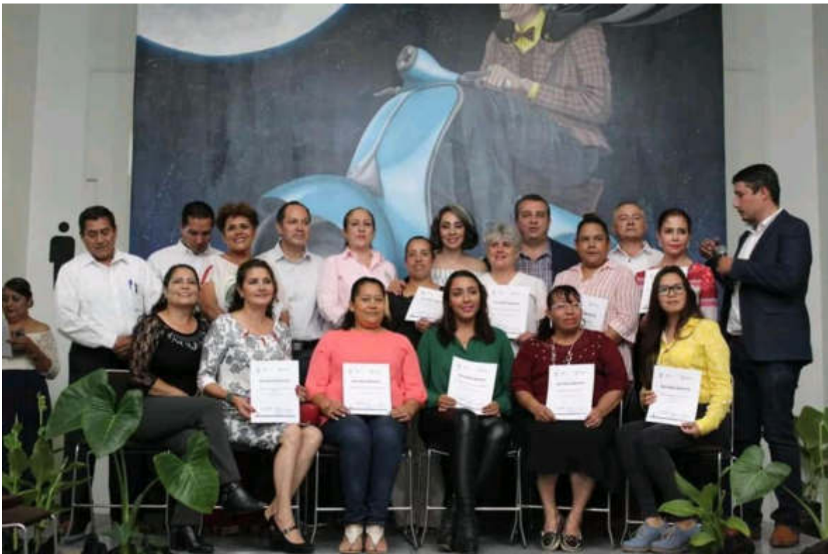
14 DE AGOSTO 2019. CURSOS DE FOMENTO A LA CAPACITACION Y EL AUTOEMPLEO PARA MUJERES DEL DISTRITO.