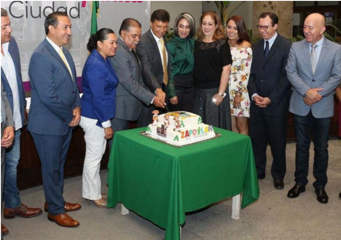
15 DE AGOSTO 2019. ENTREGA DE LA PRESEA AL MERITO CIUDADANO AL CENTRO UNIVERSITARIO DEL SUR.