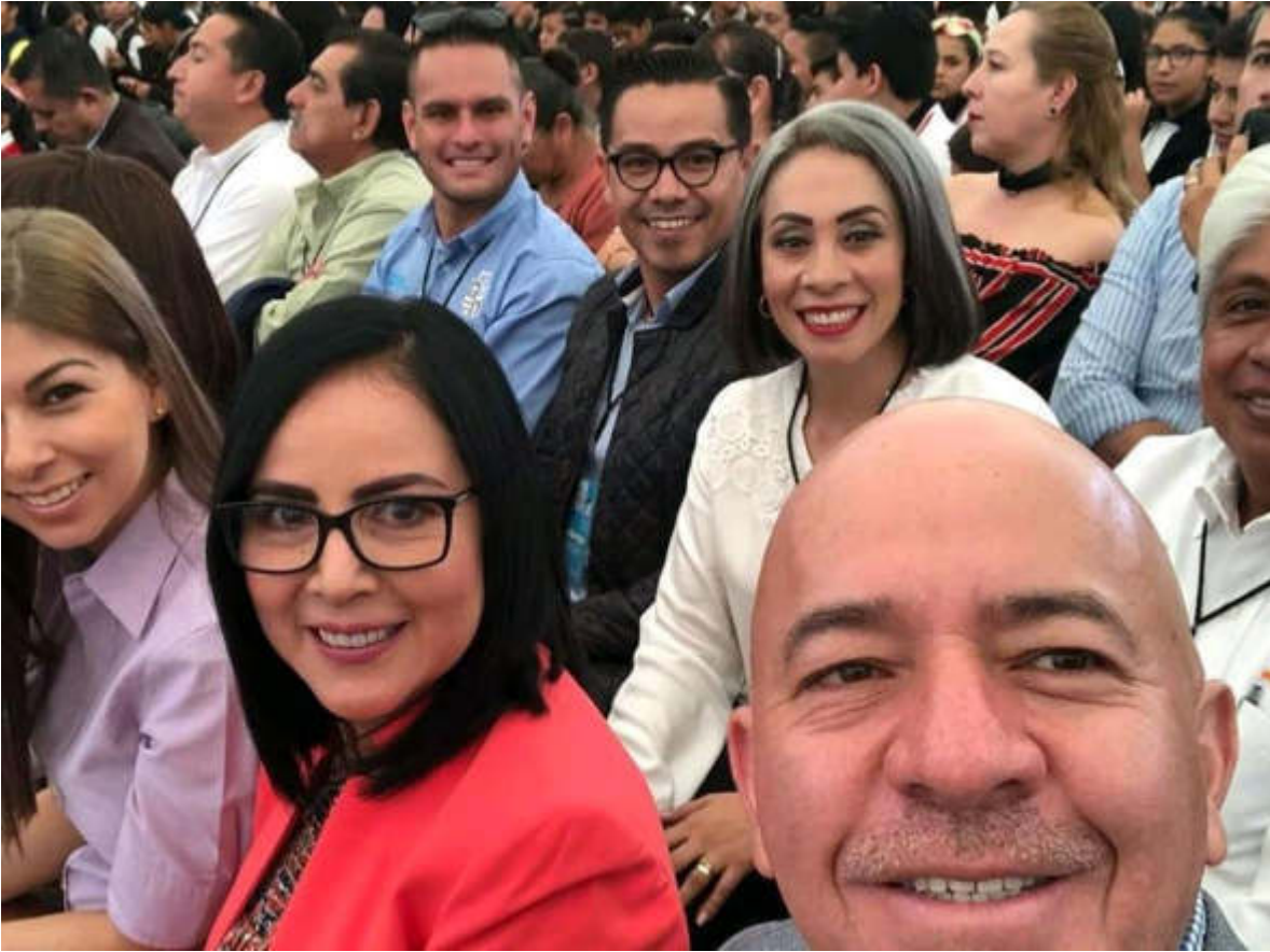
11 DE SEPTIEMBRE 2019. ENTREGA DE UNIFORMES EN LA ESCUAL SECUNDARIA NO. 100