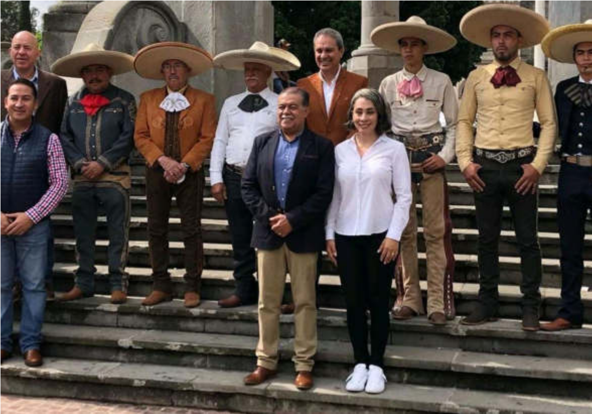
14 DE SEPTIEMBRE 2019. ASISTENCIA A LA CONMEMORACION DEL DIA NACIONAL DEL CHARRO. EN EL JARDIN MUNICIPAL.