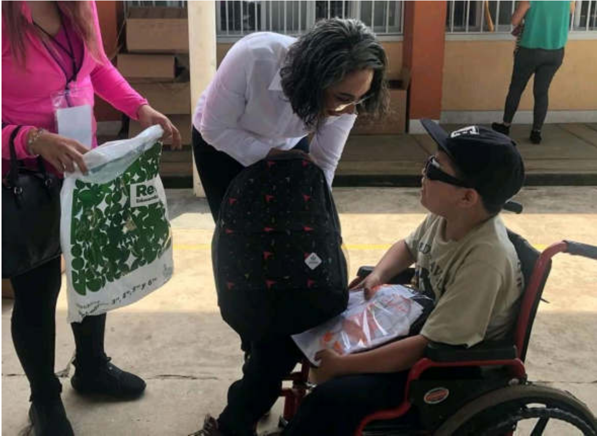
26 DE SEPTIEMBRE 2019. ENTREGA DE UNIFORMES EN UNA PRIMARIA DEL PROGRAMA RECREA.