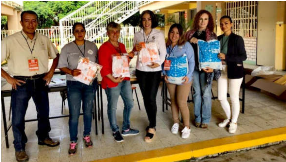
10 DE SEPTIEMBRE 2019. ENTREGA DE UNIFORMES DEL PROGRAMA RECREA EN EL CENDI.