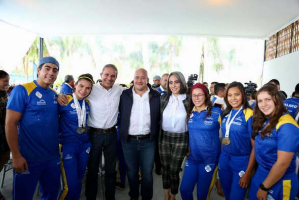
17 DE JULIO 2019. RECONOCIERON A NUESTROS ATLETAS DE REMO, CANOTAJE Y FRONTÓN, QUIENES CONQUISTARON 18 MEDALLAS DE ORO EN LA OLIMPIADA NACIONAL Y NACIONAL JUVENIL 2019.