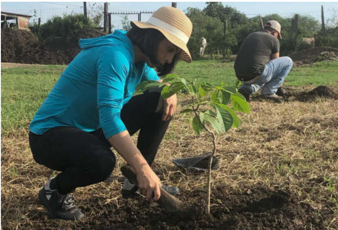
14 DE JULIO 2019. REFORESTACION MASIVA EN ZAPOTLAN EL GRANDE.