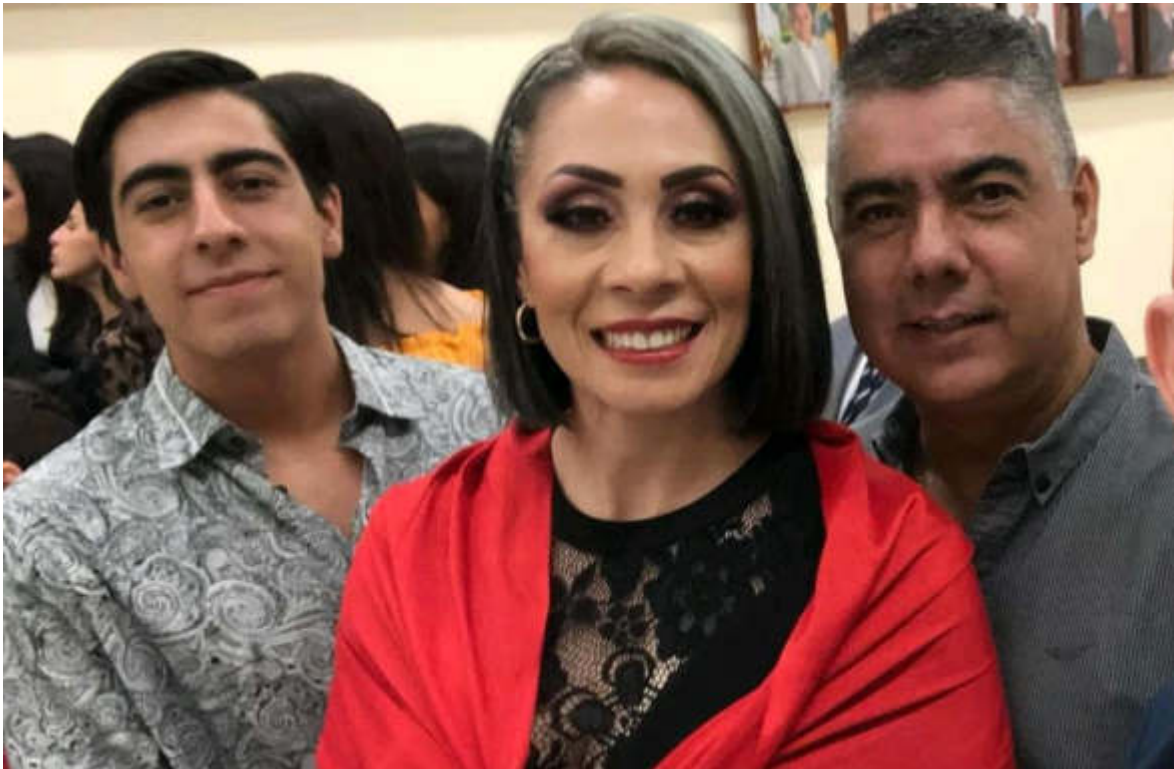
15 DE SEMPTIEMBRE 2019. ASISTENCIA AL GRITO DE INDEPENDENCIA.