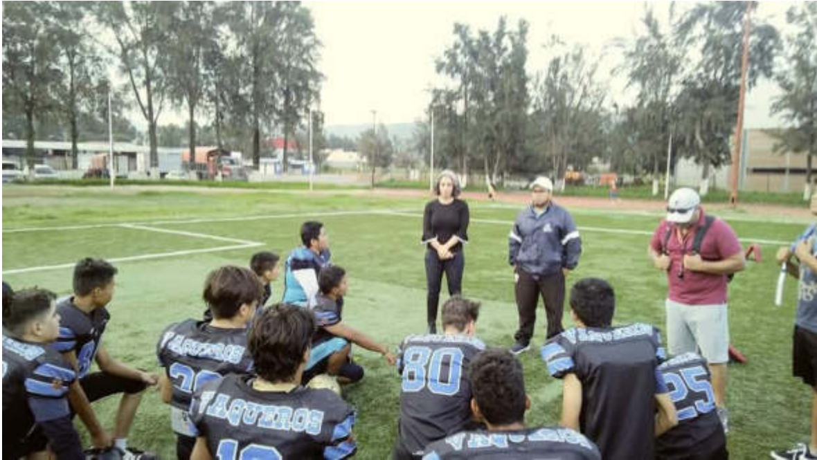
05 DE JULIO 2019. ASISTENCIA AL PRIMER JUEGO DE LA TEMPORADA SEMS ARENA DE LOS VAQUEROS.