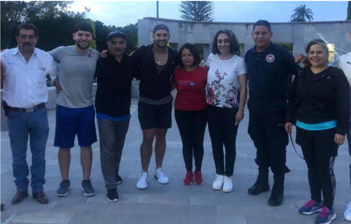
30 DE AGOSTO DE 2019. MEGA ACTIVACION FISICA.