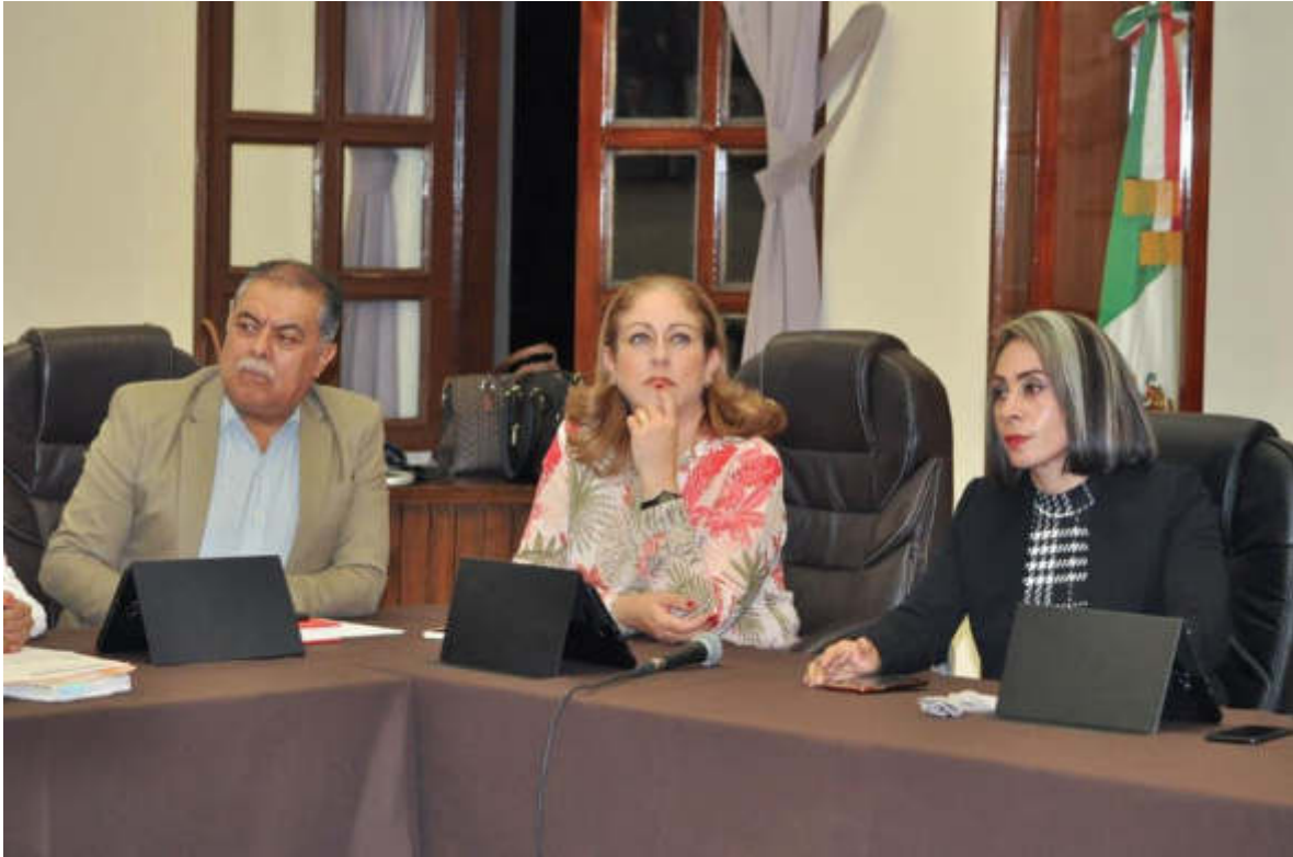
11 DE JULIO 2019. SESION EXTRAORDINARIA NO. 18 Y 19.