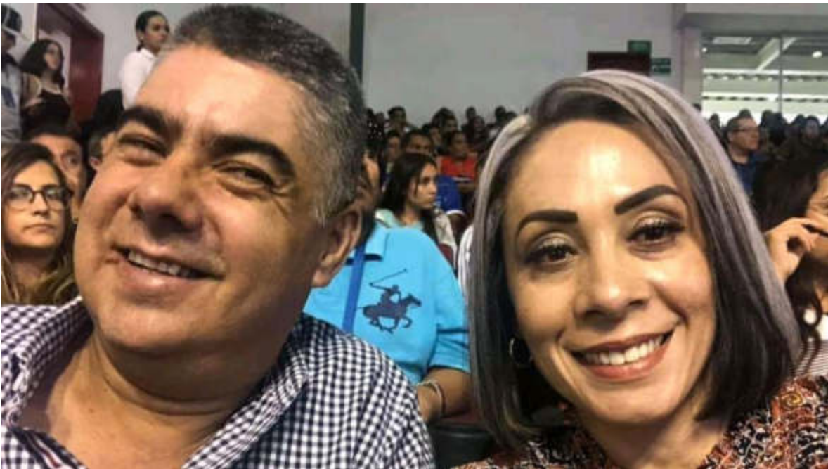
05 DE SEPTIEMBRE 2019. CONGRESO DEL SISTEMA ESTATAL DE CULTURA FISICA Y DEPORTE. CODE JALISCO.