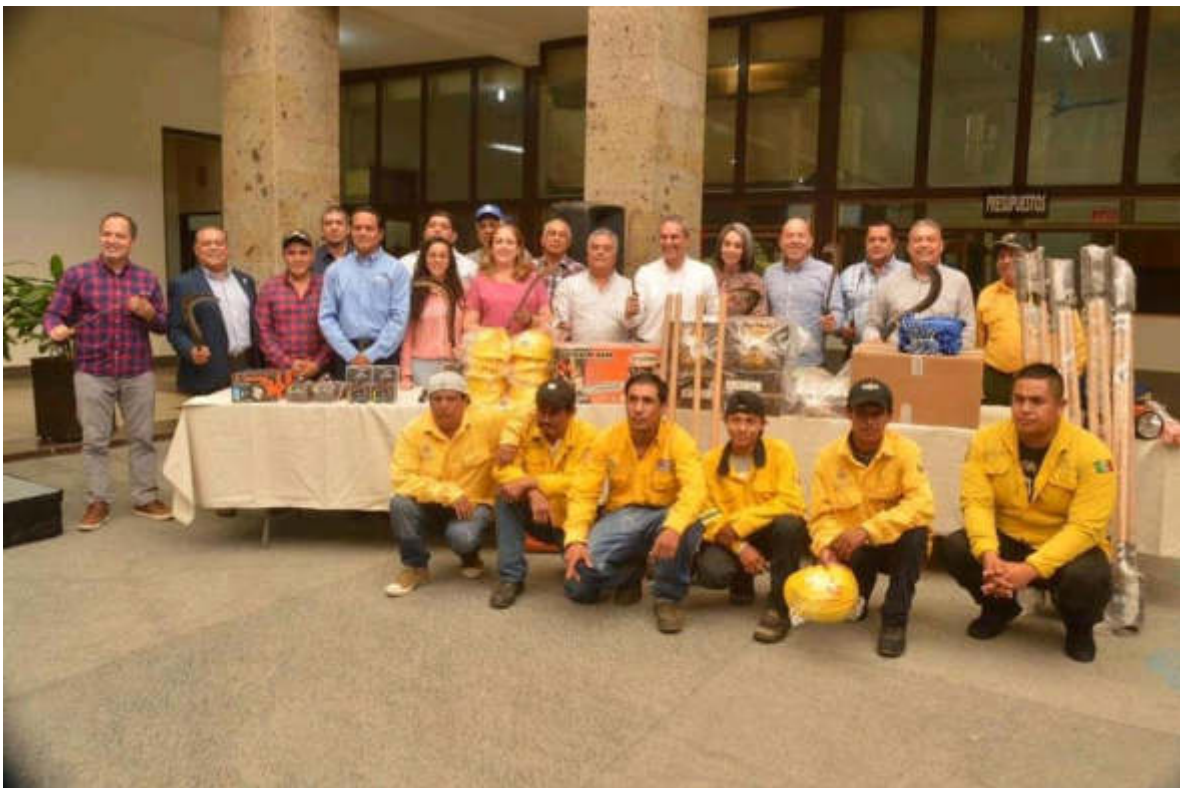
23 DE AGOSTO 2019. DONACION AL MUNICIPIO DE HERRAMIENTO Y MAQUINARIA.