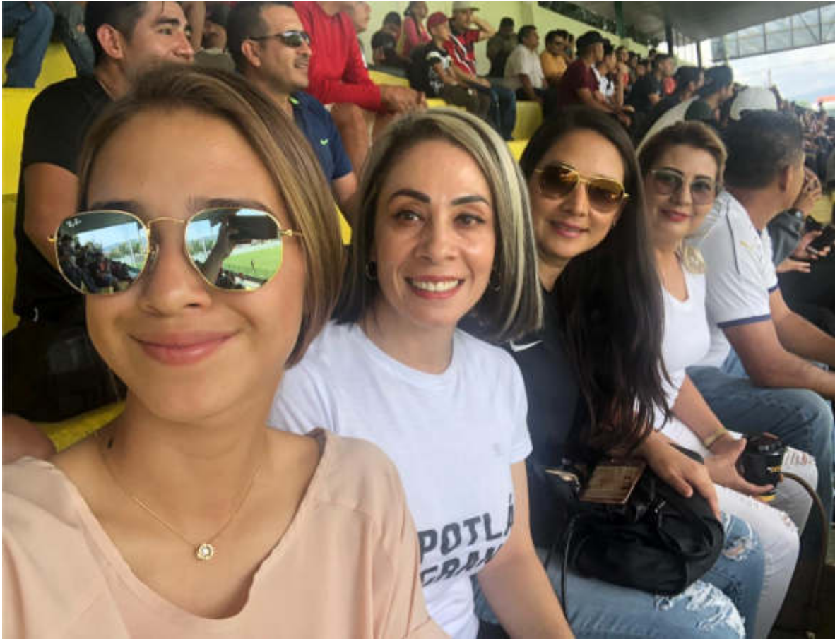
28 DE JULIO 2019. PARTIDO ENTRE COCULA Y ZAPOTLAN EN GRANDE, ESTADIO SANTA ROSA