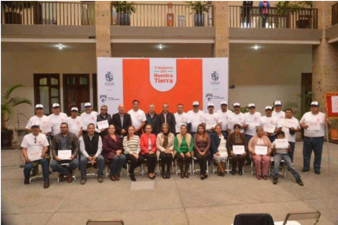
10 DE SEPTIEMBRE 2019. RECONOCIMIENTO AL CUERPO DE BOMBEROS.