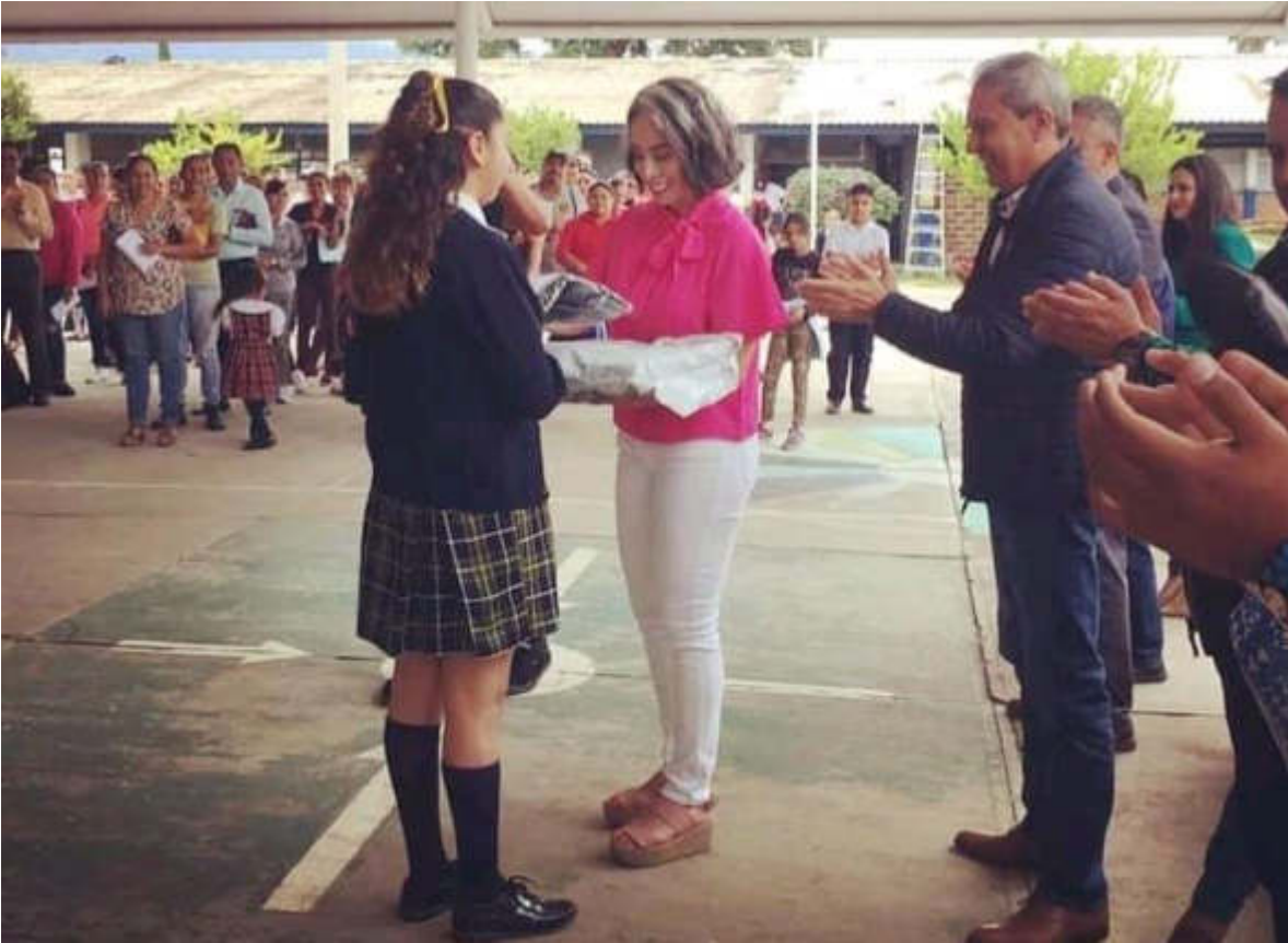
20 DE SEPTIEMBRE 2019. ENTREGA DE UNIFORMES EN LA ESCUELA SECUNDARIA NO. 05