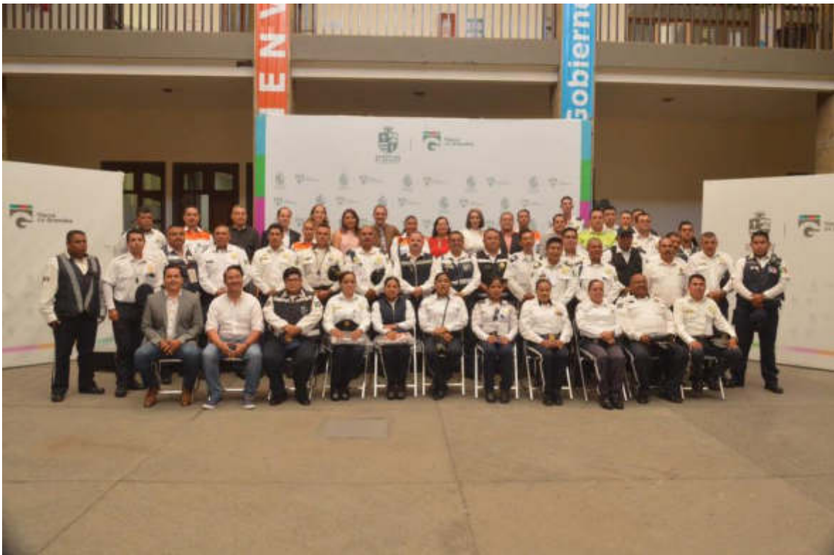
09 DE JULIO 2019. ENTREGA DE UNIFORMES A LOS ELEMENTOS DE LA JEFATURA DE TRANSITO Y MOVILIDAD MUNICIPAL.