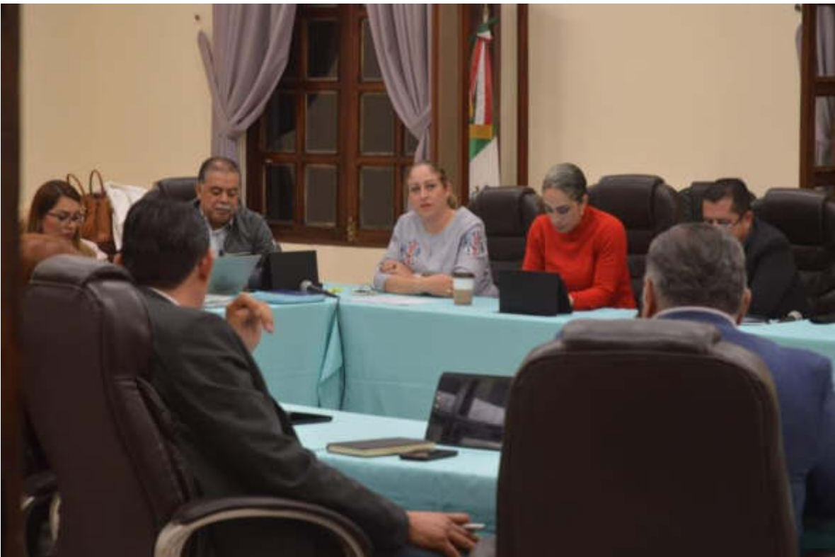
19 DE SEPTIEMBRE 2019. SESION EXTRAORDINARIA NO. 29