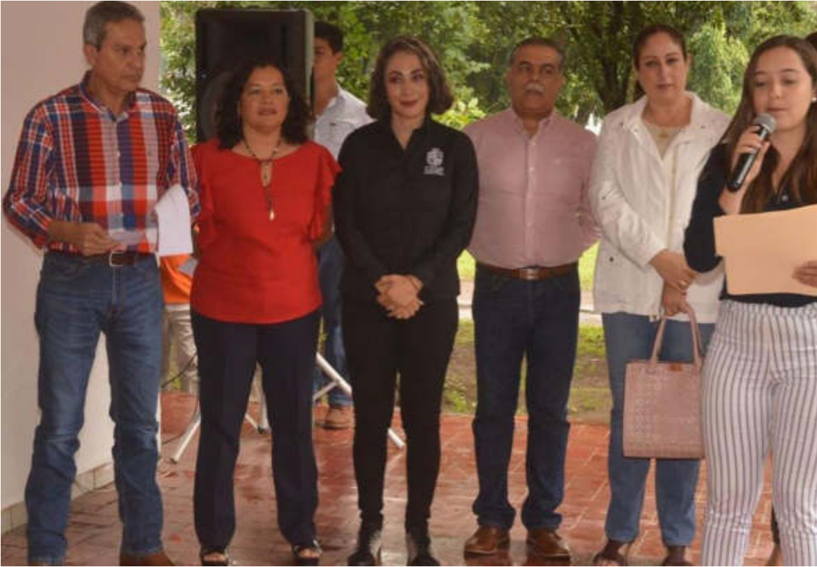
02 DE SEPTIEMBRE 2019. REINAUGURACION DE LAS INSTALACIONES DEL INSTITUTO MUNICIPAL DE LA MUJER ZAPOTLENSE.