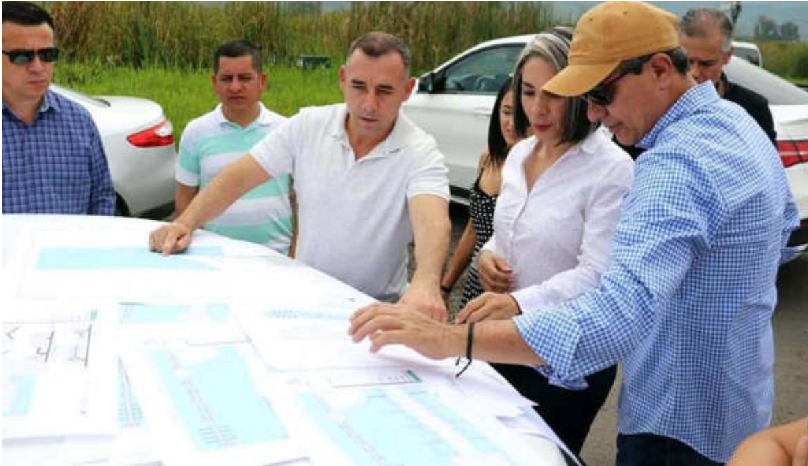
07 DE SEPTIEMBRE 2019. VISITA A LA LAGUNA DE ZAPOTLAN PARA CONOCER LOS PLANOS Y EL PROYECTO EJECUTIVO PARA LA CONSTRUCCION DEL MELECON DE LA LAGUNA.