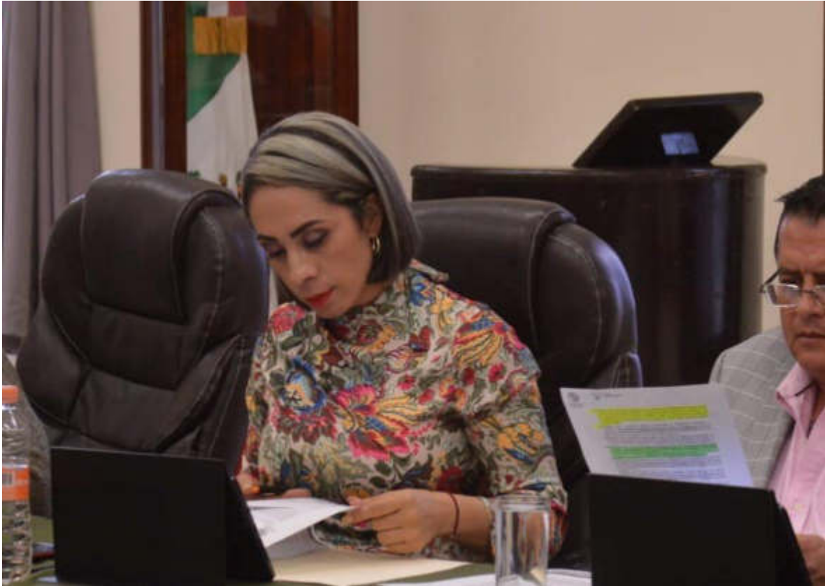
25 DE JULIO 2019. SESION ORDINARIA NO. 08