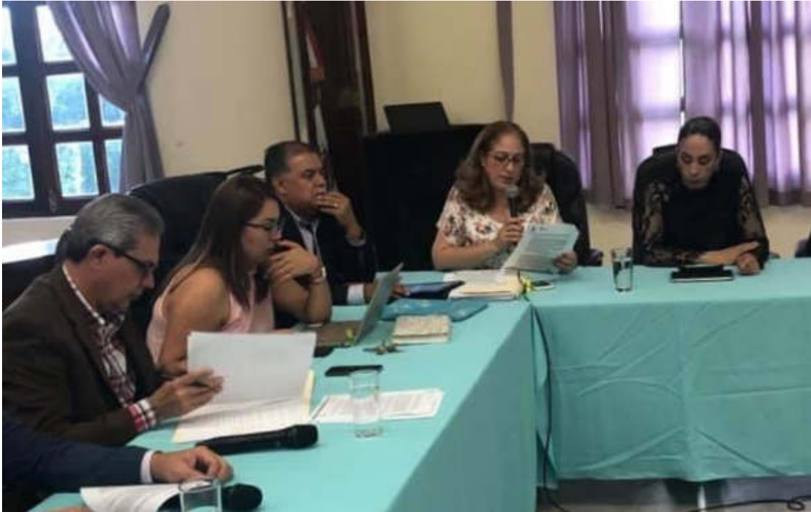
26 DE AGOSTO 2019. SESION EXTRAORDINARIO NO. 25