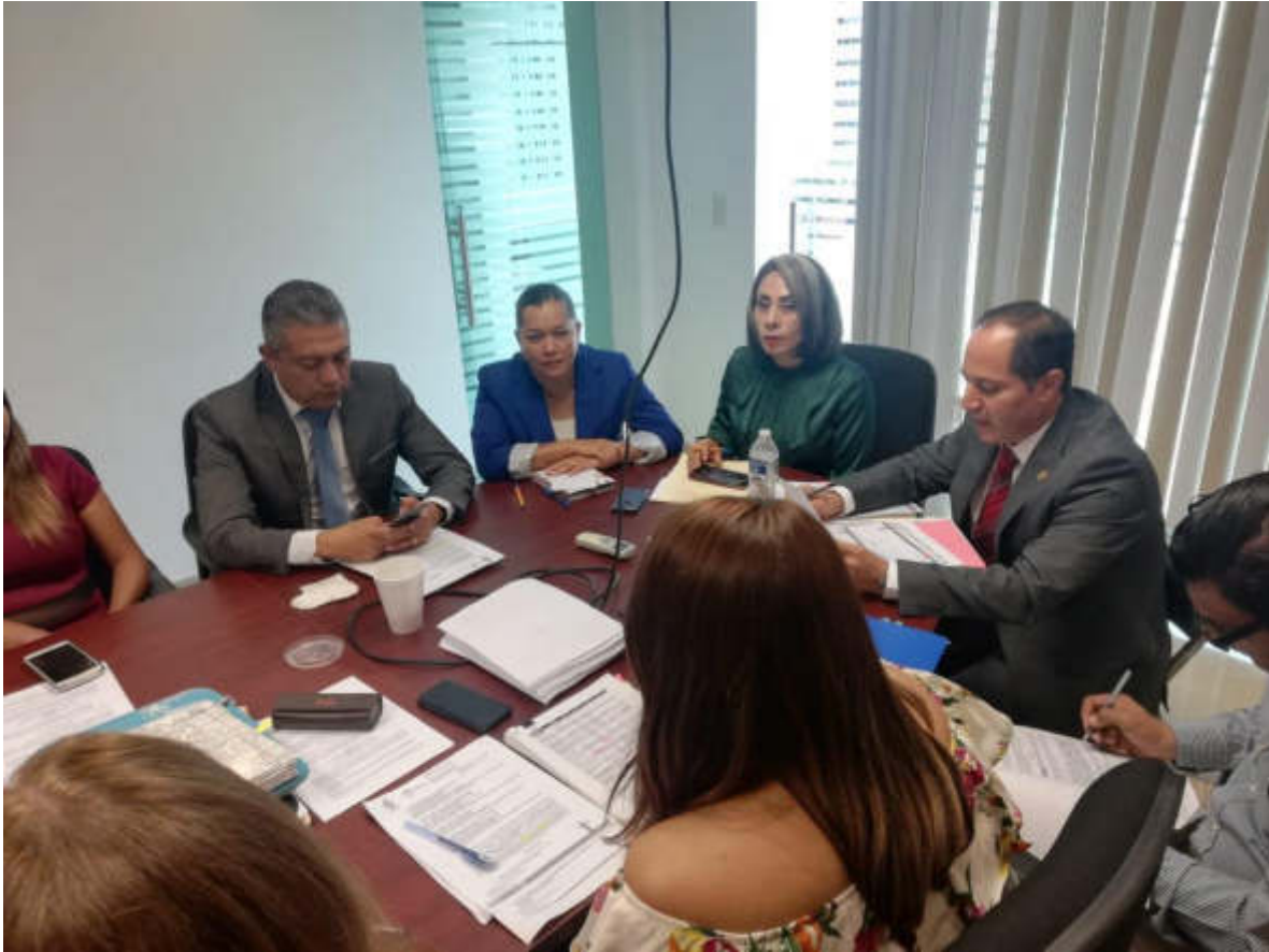
15 DE AGOSTO 2019. SESION NO. 08 DE LA COMISION DE DESARROLLO HUMANO, SALUD PUBLICA E HIGIENE.