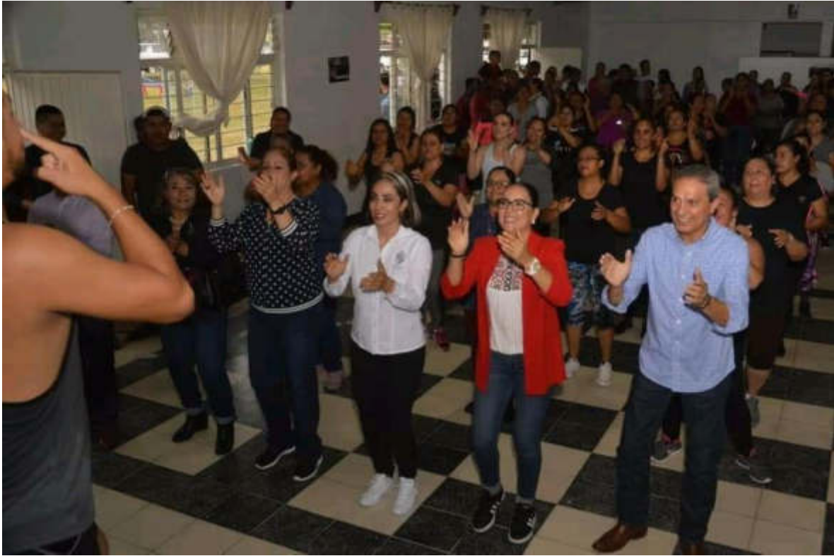
13 DE AGOSTO 2019. INAUGURACION DEL CENTRO COMUNITARIO EN EL TRIANGULO