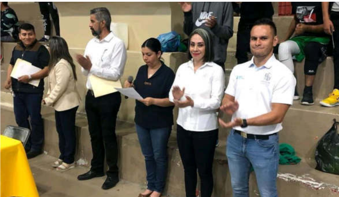
29 DE SEPTIEMBRE 2019. INAUGURACION DEL INICIO DEL TORNEO DE BASQUET BOL DE SECUNDARIAS, JUVENIL PRIMERA Y SEGUNDA FUERZA DE LA LIGA GUZMANENSE DE BASQUET BOL.