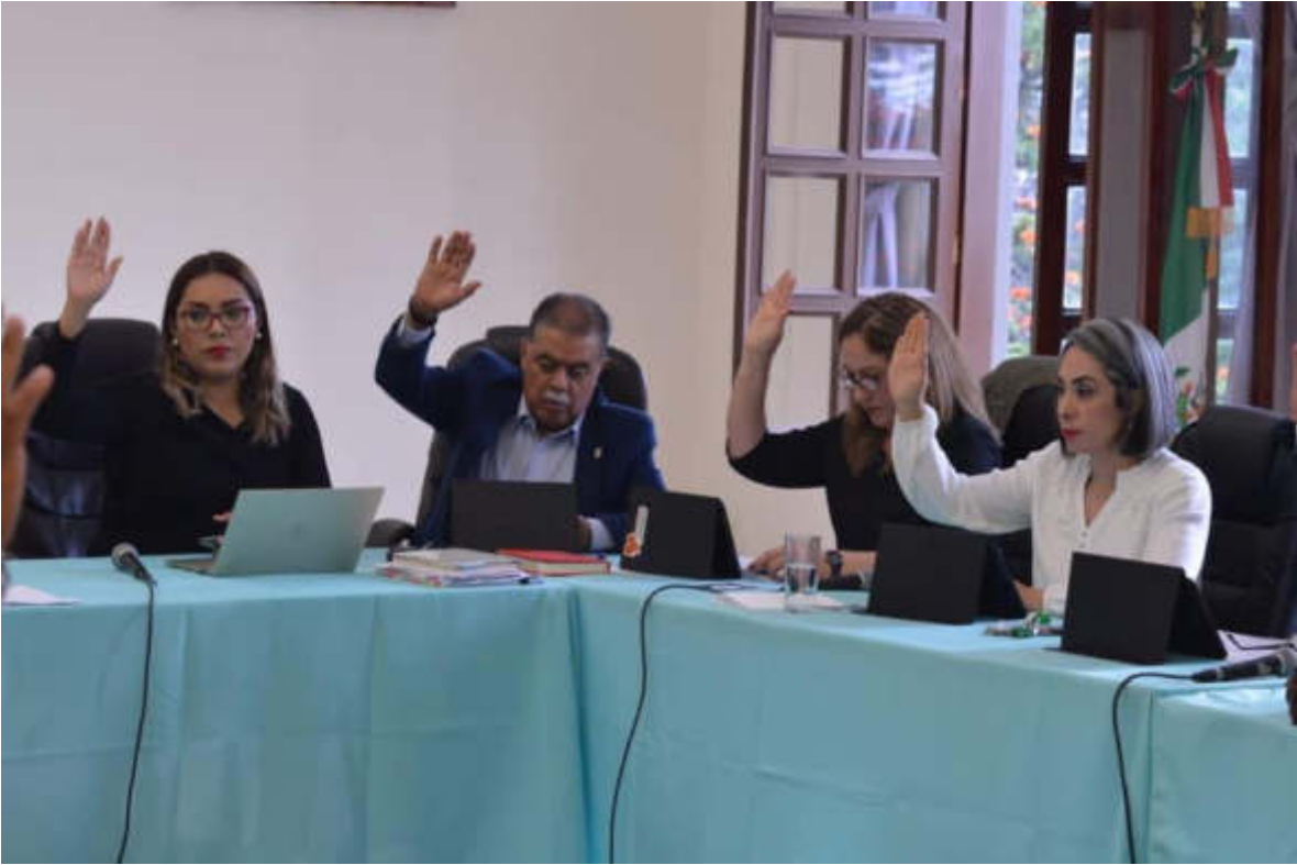
11 DE SEPTIEMBRE 2019. SESION ORDINARIA NO. 09