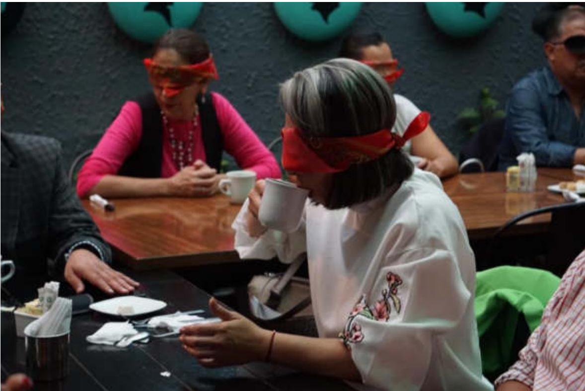
18 DE JULIO 2019. ACTIVIDAD PARA COMPRENDER LAS DIFICULTADES A LAS QUE SE ENFRENTAN LAS PERSONAS QUE SON DEBILES VISUALES.