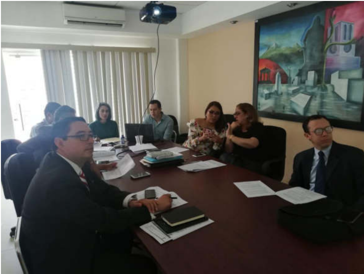
15 DE AGOSTO 2019. SESION DE LA COMISION DE DEPORTES, RECREACION Y ATENCION A LA JUVVENTUD.