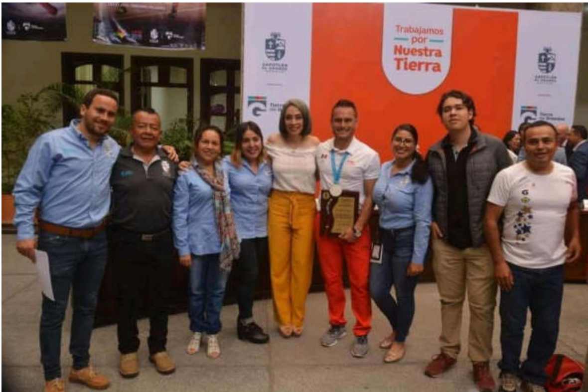
17 DE SEPTIEMBRE 2019. RECONOCIMIENTO A MEDALLISTAS PANAMERICANOS 2019.