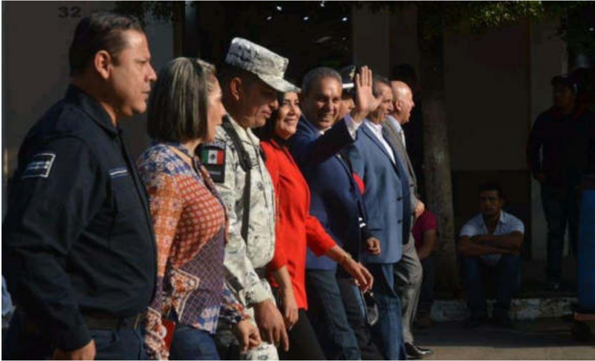
16 DE SEPTIEMBRE 2019. ASISTENCIA DEL TRADICIONAL DESFILE CIVICO CON MOTIVO DEL 209 ANIVERSARIO DEL INICIO DE LA LUCHA POR LA INDEPENDENCIA DE MEXICO.