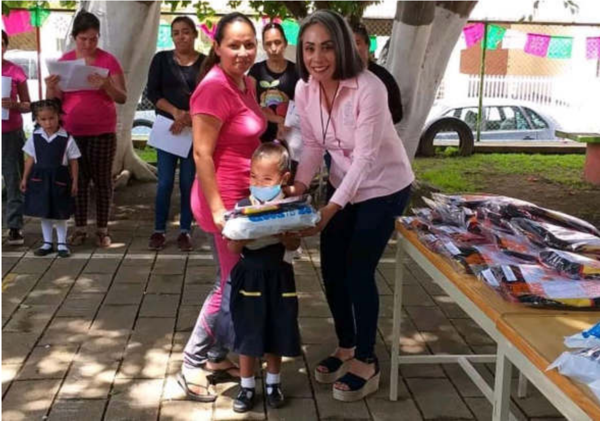
12 DE SEPTIEMBRE 2019. ENTREGA DE UNIFORMES EN UN JARDIN DE NIÑOS DEL PROGRAMA RECREA 2019.