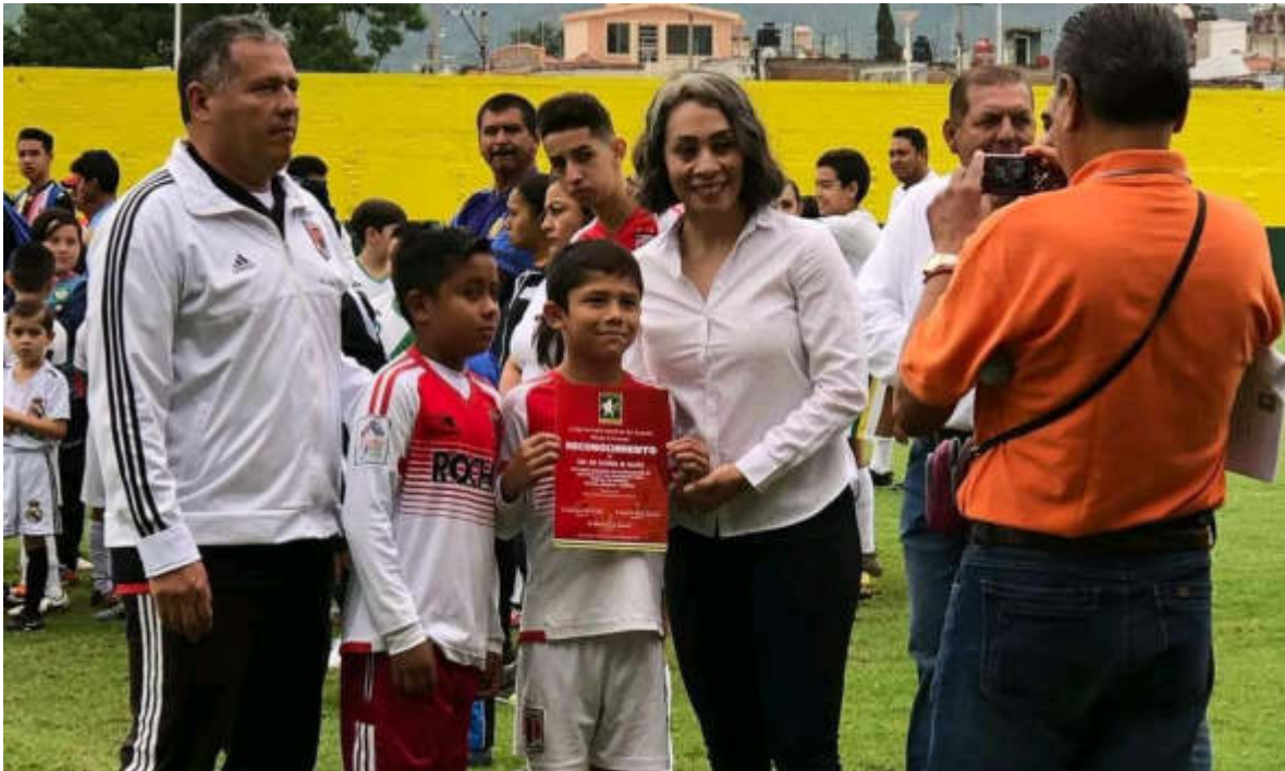
14 DE SEPTIEMBRE 2019. ASISTENCIA A LA INAUGURACION DE LA TEMPORADA 2019-2020 DE LA LIGA INFANTIL DE FUTBOL GUZMANENSE.