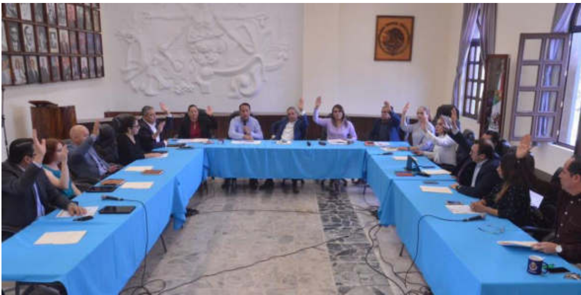
15 DE JULIO 2019. SESION EXTRAORDINARIA NO. 20