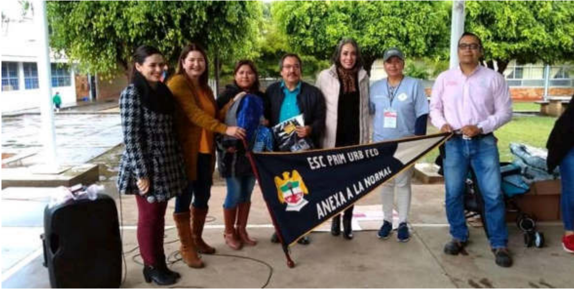
19 DE SEPTIEMBRE 2019. ENTREGA DEL PROGRAMA RECREA EN LA ESCUELA ANEXA A LA NORMAL