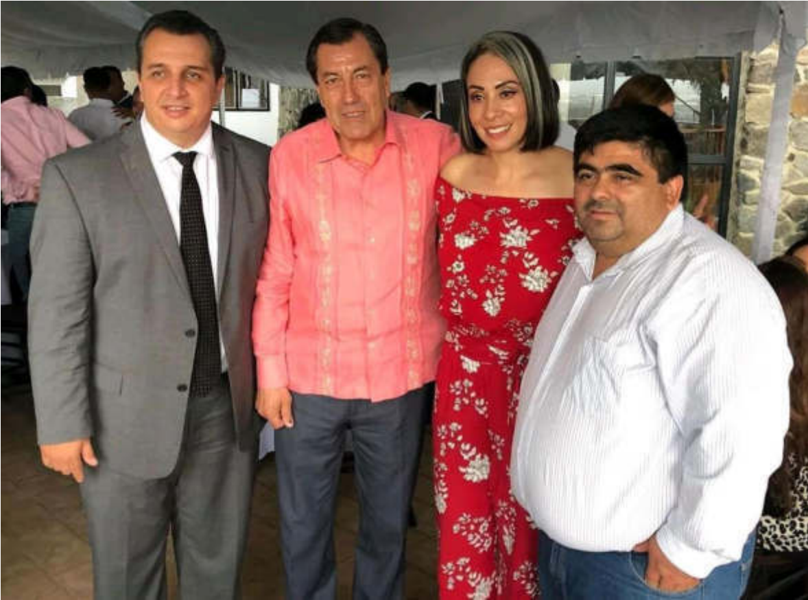
28 DE SEPTIEMBRE 2019. PRIMER INFORME DE ACTIVIDADES DEL DIPUTADO FEDERAL, HIGINIO DEL TORO.