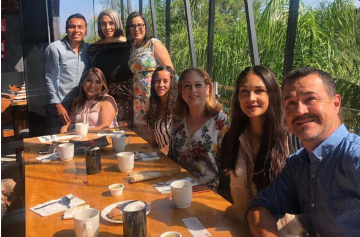
10 DE JULIO 2019. DESAYUNO CON CAUSAR POR PARTE DEL DIF DE ZAPOTLAN EL GRANDE.