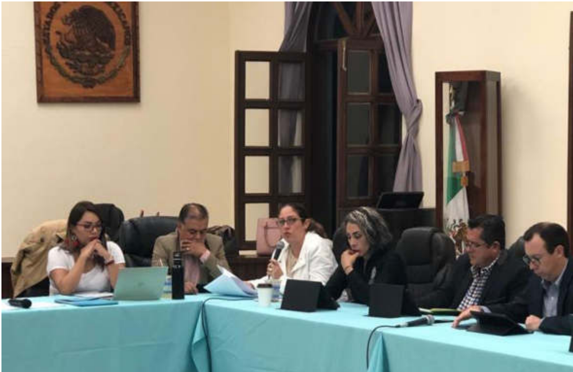
02 DE SEPTIEMBRE 2019. SESION EXTRAORDINARIA NO. 27