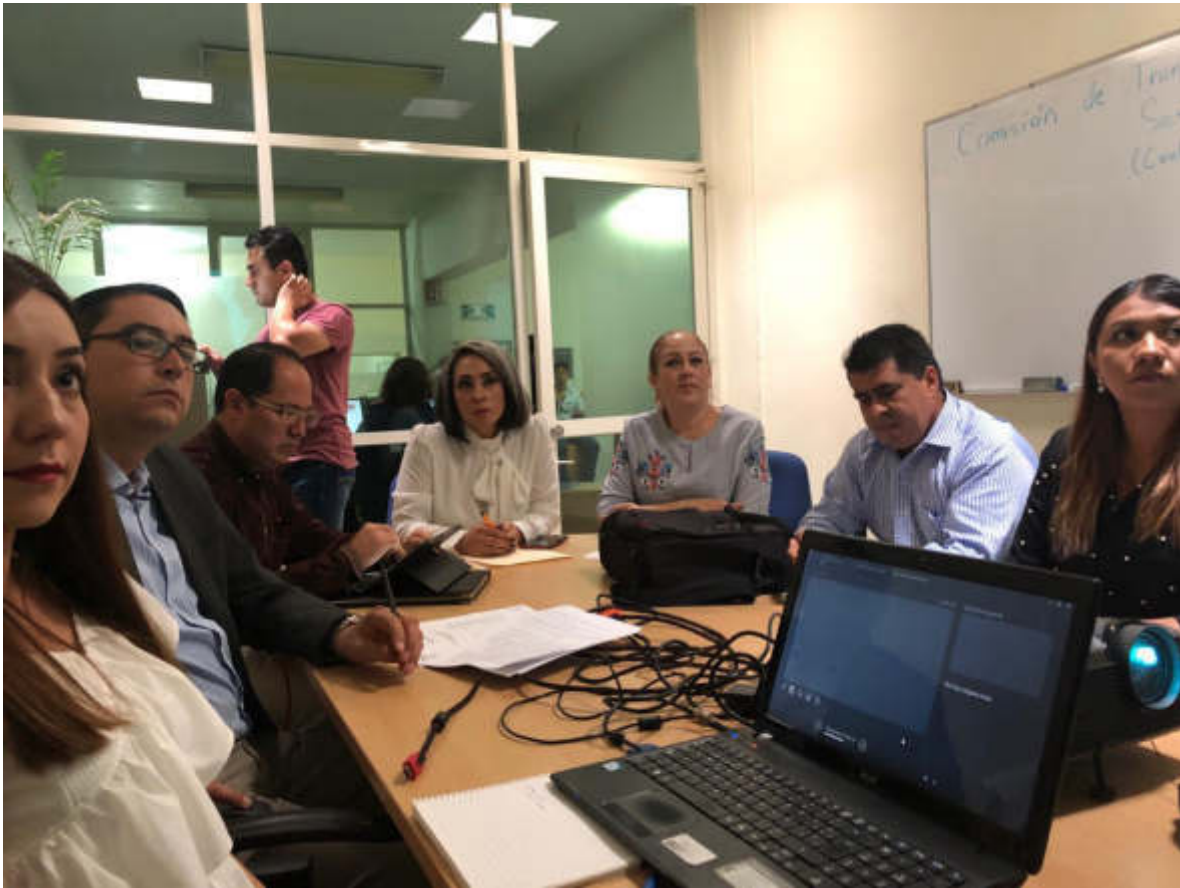
15 DE JULIO 2019. CONTINUACION DE LA SESION ORDINARIA 04 DE LAS COMISIONES DE TRANSPARENCIA Y REGLAMENTOS.