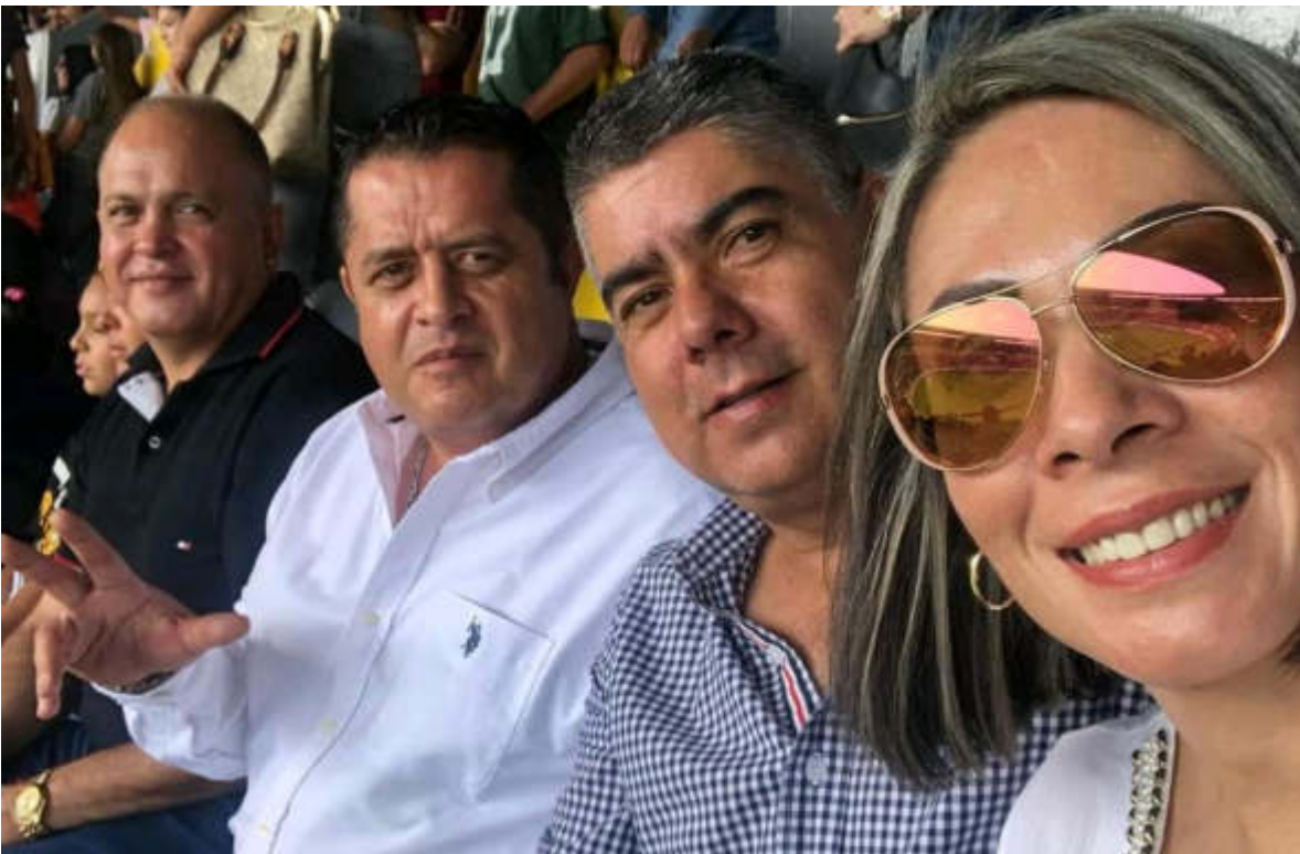
22 DE SEPTIEMBRE 2019. ASISTENCIA A LA FINAL DE LA COPA JALISCO.