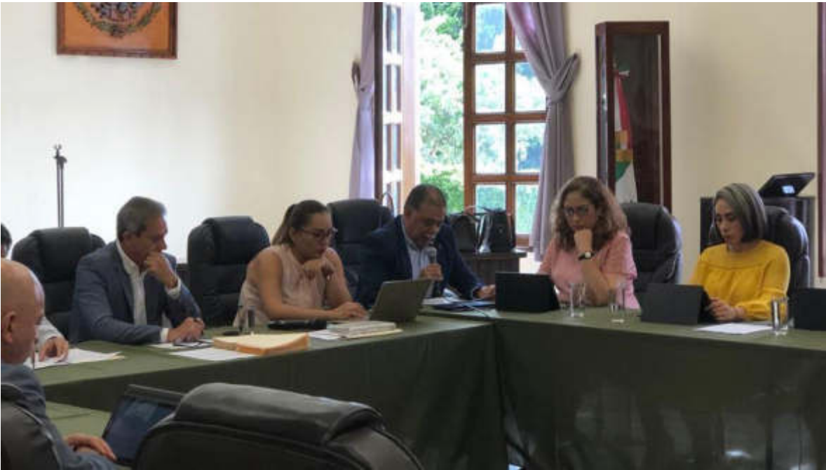
24 DE JULIO 2019. SESION EXTRAORDINARIA NO. 24