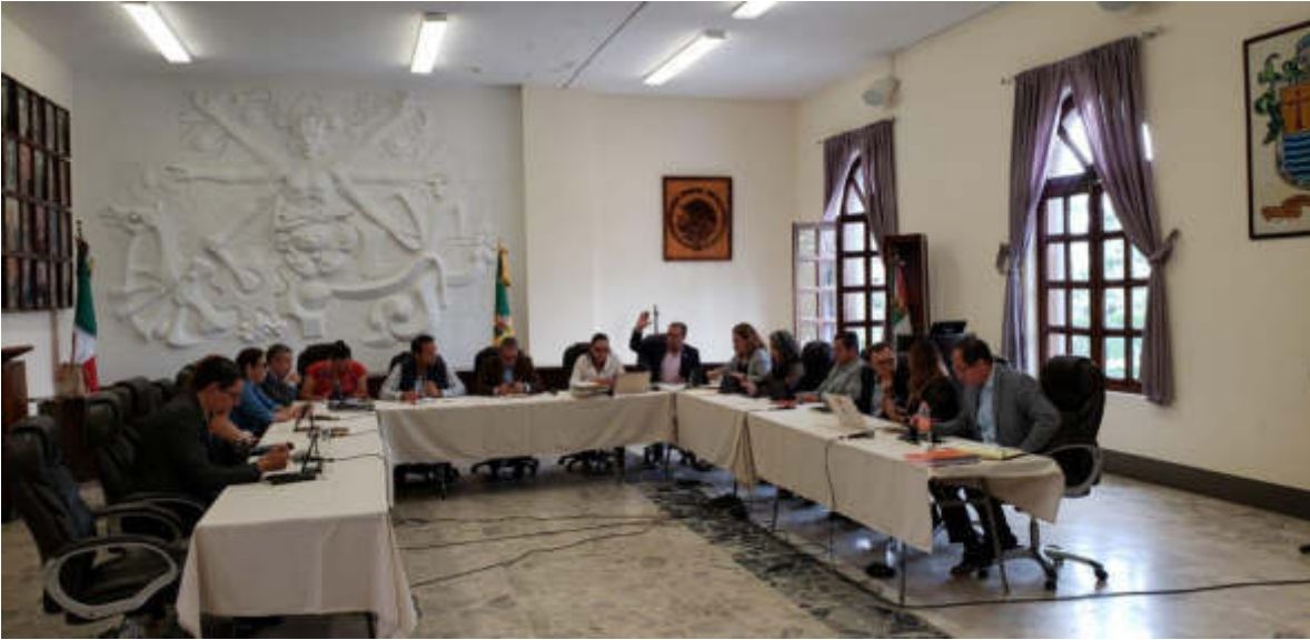
23 DE JULIO 2019. SESION EXTRAORDINARIA NO. 21