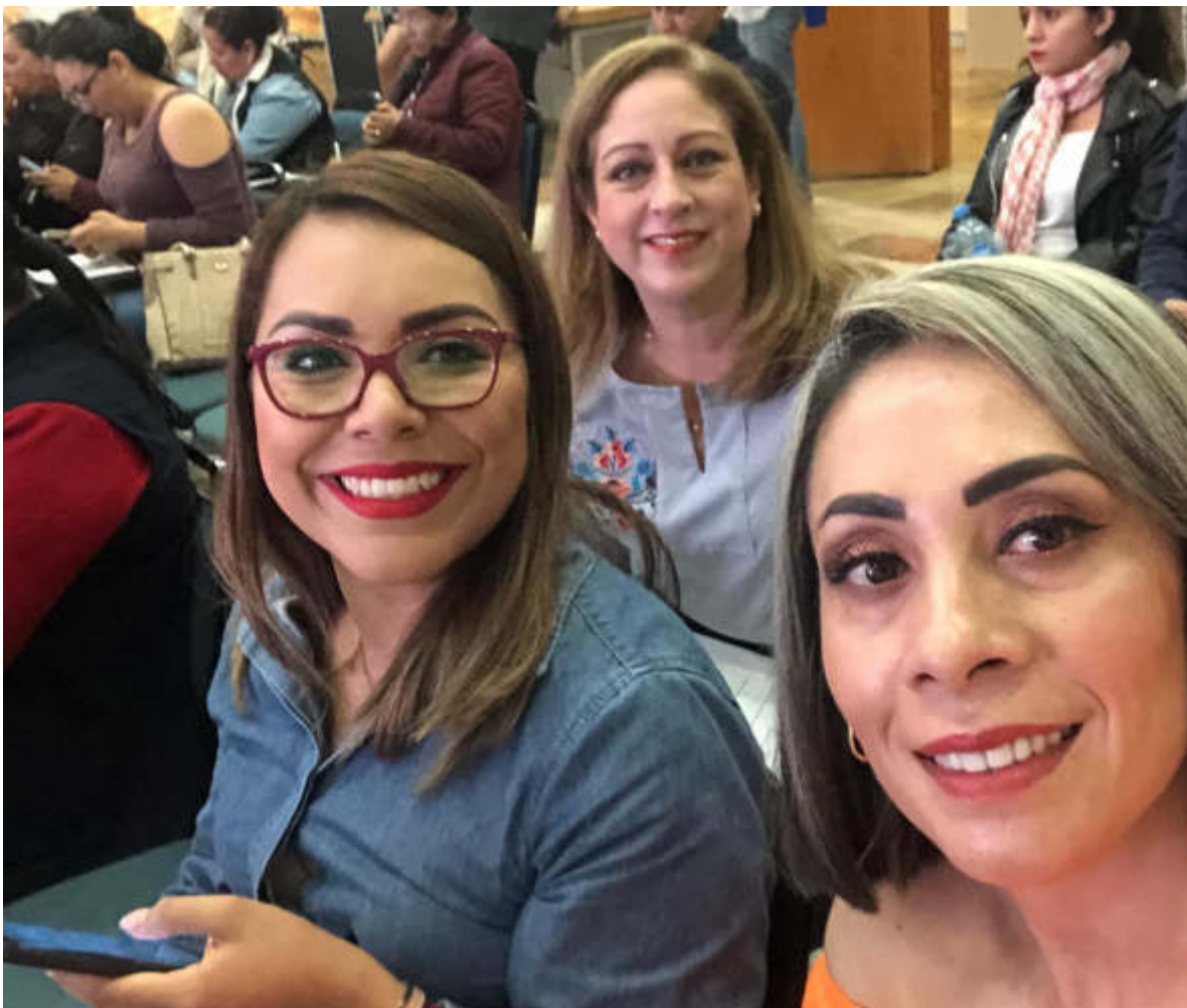
27 DE JULIO 2019. CONTINUAMOS CON NUESTRA CAPACITACIÓN "IMPORTANCIA DE LA PARTICIPACIÓN POLÍTICA DE LA MUJERES EN EL ÁMBITO LEGISLATIVO".