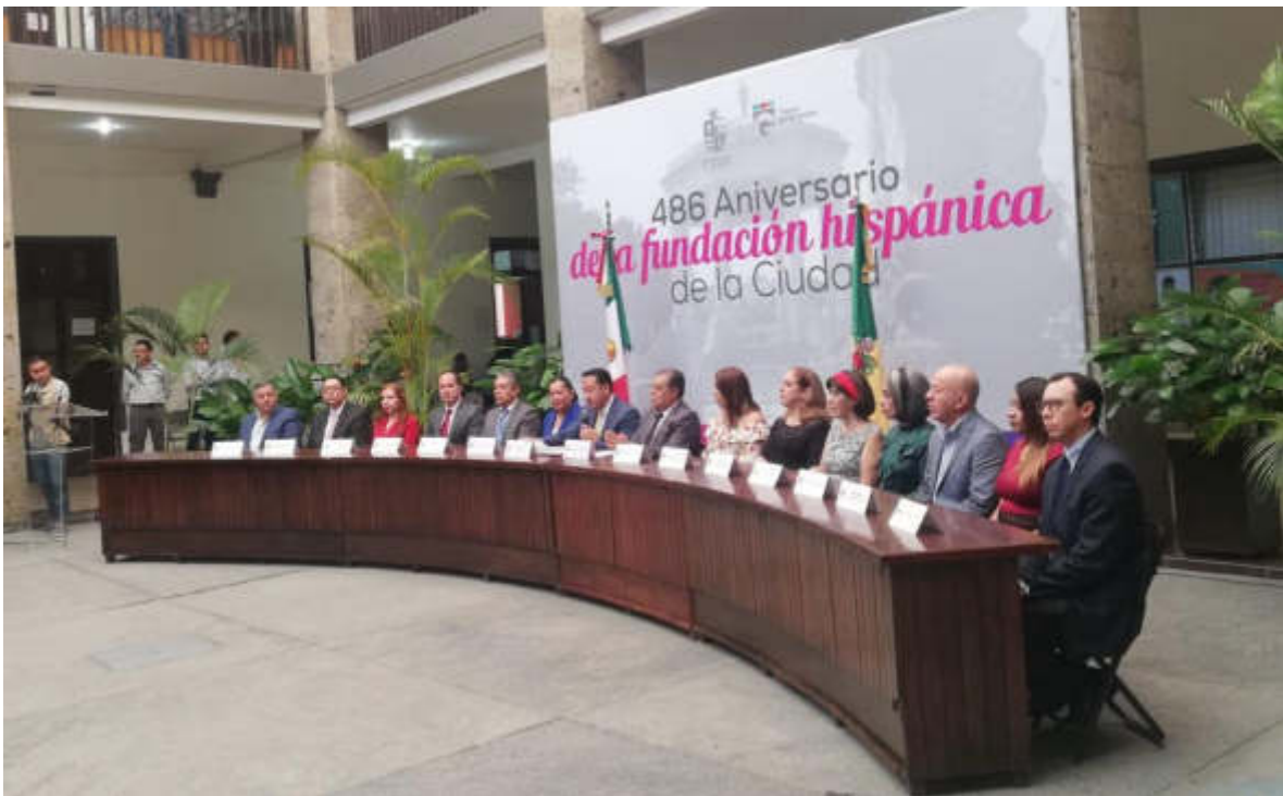
15 AGOSTO 2019. SESION SOLEMNE NO. 07