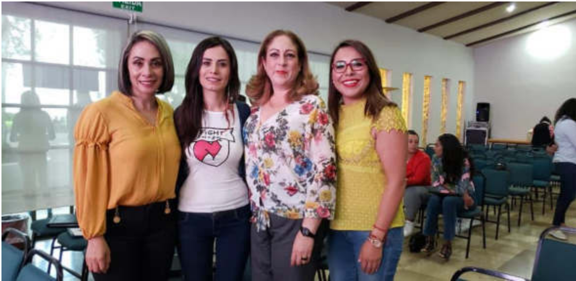
26 DE JULIO 2019. EN CAPACITACIÓN Y FOMENTO DE LIDERAZGOS PARA EL DESARROLLO POLÍTICO DE LAS MUJERES.