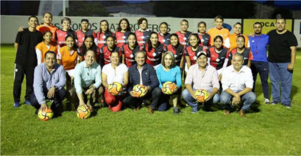
19 DE JULIO 2019. ENTREGA DEL UNIFORME OFICIAL A LA SELECCIÓN FEMENIL DE ZAPOTLAN EL GRANDE.