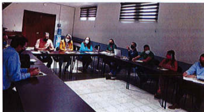
17 DE SEPTIEMBRE 2020

Av. Cristobal Colón #62, Centro Histórico CP 49000, Cd. Guzmán, Zapotlán el Grande, Jal. Tel: (341) 575 2500 www.ciudadguzman.gob.mx