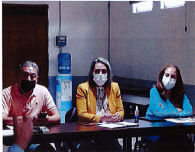
30 DE JULIO 2020