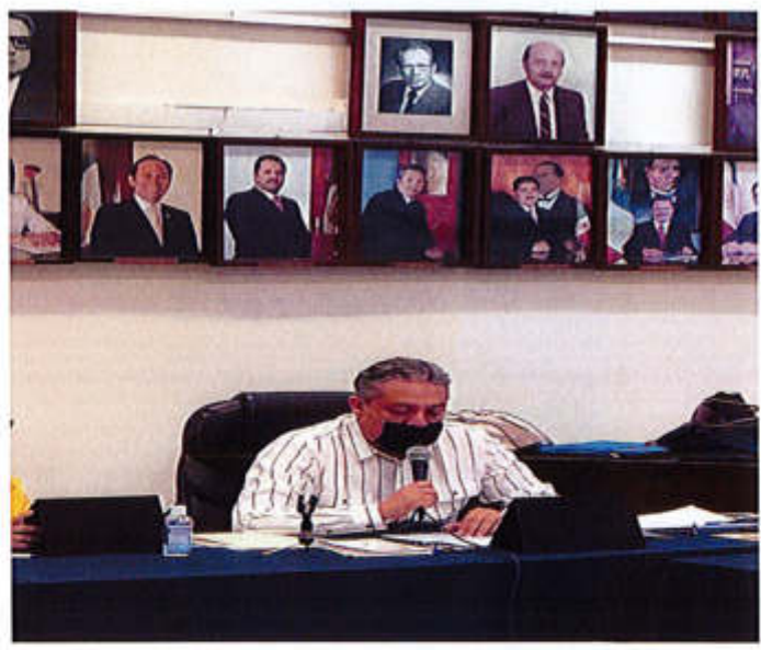
29 DE JULIO 2020.