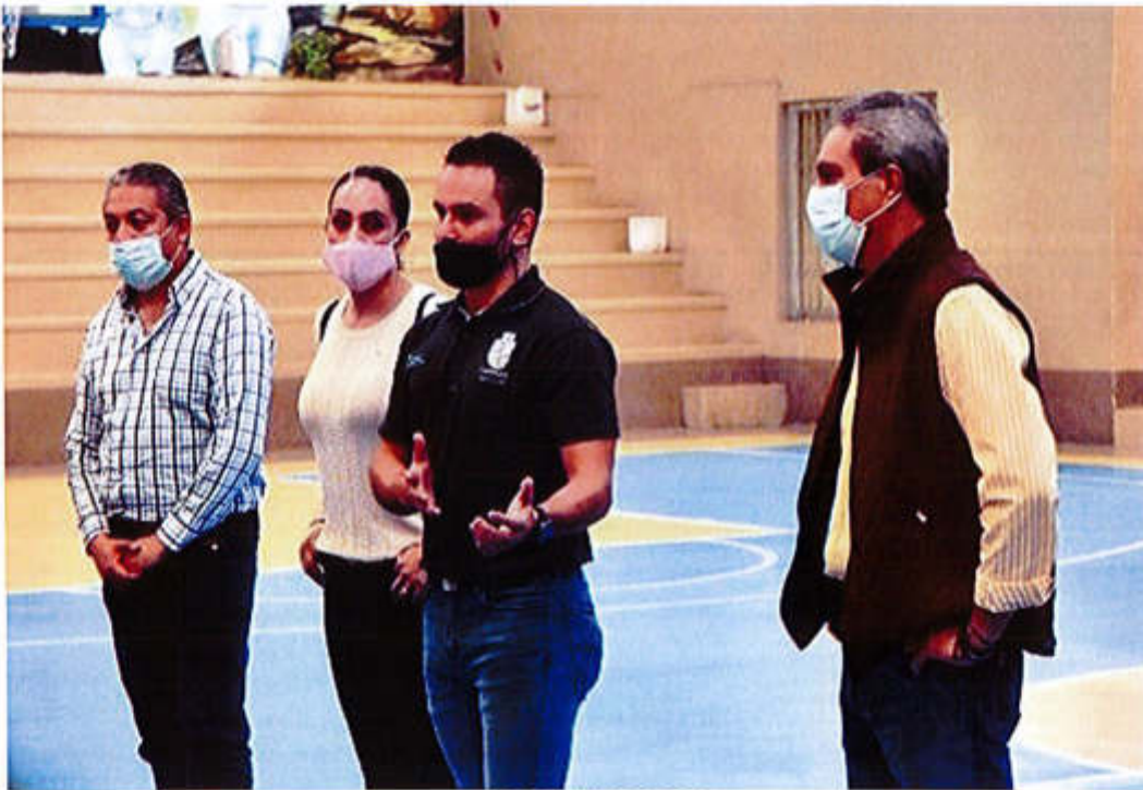
02 DE JULIO 2020.