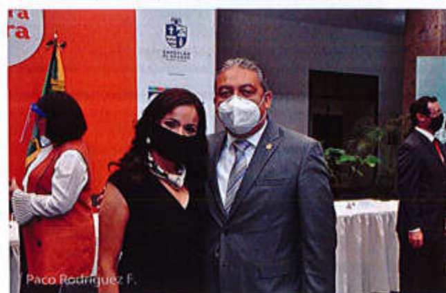
03 DE JULIO 2020.

Av. Cristobal Colón #62, Centro Histórico CP 49000, Cd. Guzmán, Zapotlán el Grande, Jal. Tel: (341) 575 2500 www.ciudadguzman.gob.mx