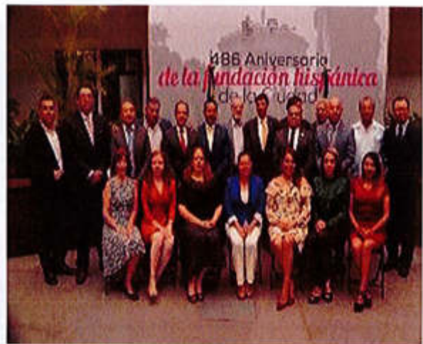
15 DE AGOSTO 2019- CELEBRACION DEL 486 ANIVERSARIO DE LA FUNDACION HISPANICA DE ZAPOTLAN EL GRANDE Y LA ENTREGA DE LA PRESEA AL "MERITO CIUDADANO" AL CENTRO UNIVERSITARIO DEL SUR DE LA UNIVERSIDAD DE GUADALAJARA.