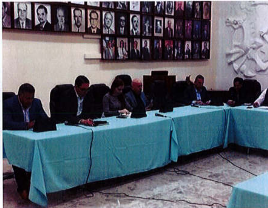
18 DE SEPTIEMBRE 2019- SESIÓN EXTRAORDINARIA NO. 29