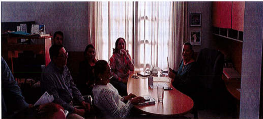
11 DE JULIO 2019- SESION EXTRAORDINARIA.