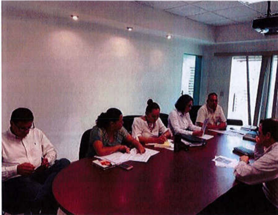
30 DE AGOSTO 2019- SESION EXTRAORDINARIA NO. 01.