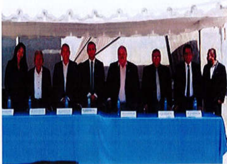
10 DE JULIO- PARTICIPACION COMO PARTE DEL PRESIDIO EN DIFERENES ACTOS ACADEMICOS EN REPRESENTACION AL AYUNTAMIENTO