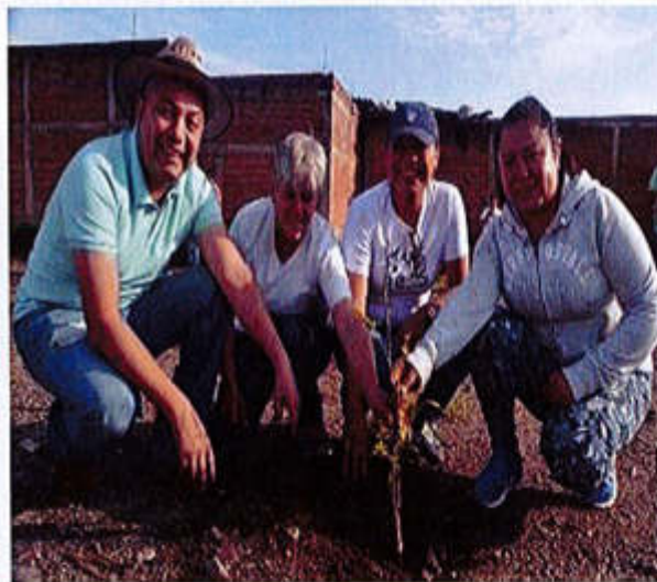
14 DE JULIO 2019- SE RELIZO LA REFORESTACION MASIVA Y ADOPCION E ARBOLES PARA QUE ZAPOTLAN EL GRANDE SEA UNA CIUDAD SUSTENTABLE.