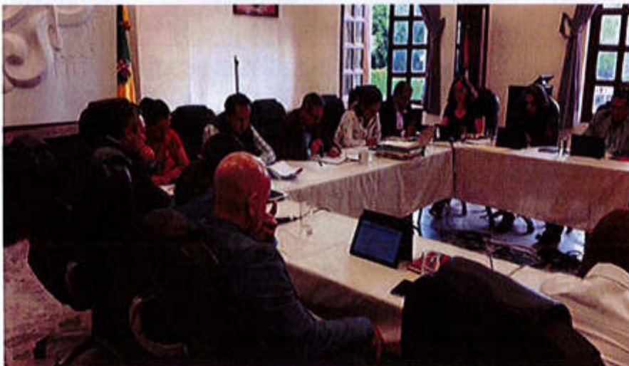
23 DE JULIO 2019- SESIÓN EXTRAORDINARIA NO. 21.