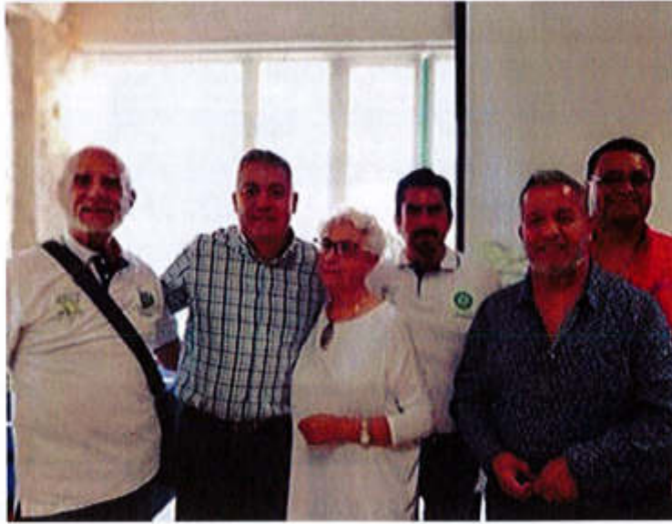
17 DE AGOSTO 2019- INAGURACION DE EL CONCURSO BONSAI QUE SE REALIZO EN ZAPOTLÁN EL GRANDE.