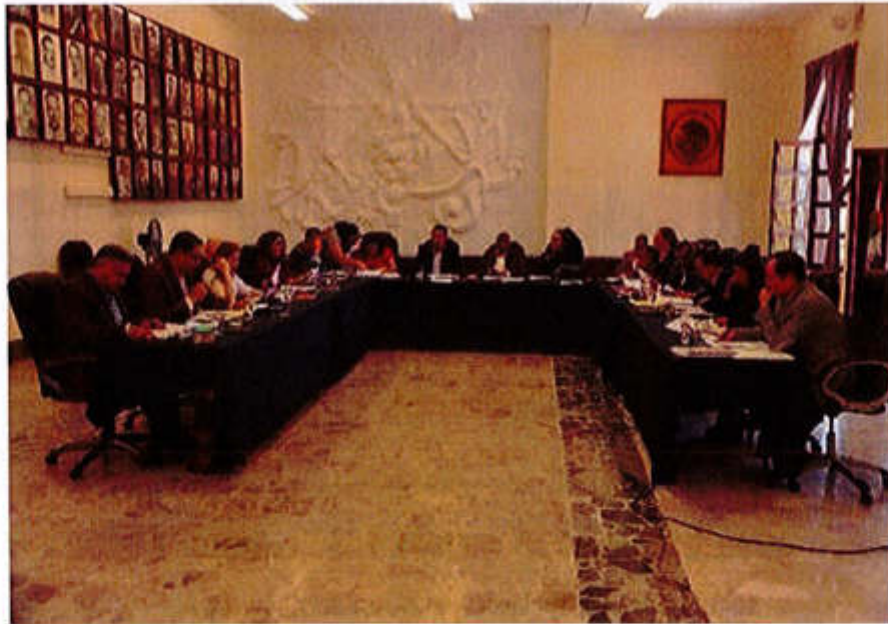
26 DE AGOSTO 2019, SESIÓN EXTRAORDINARIA NO. 25.