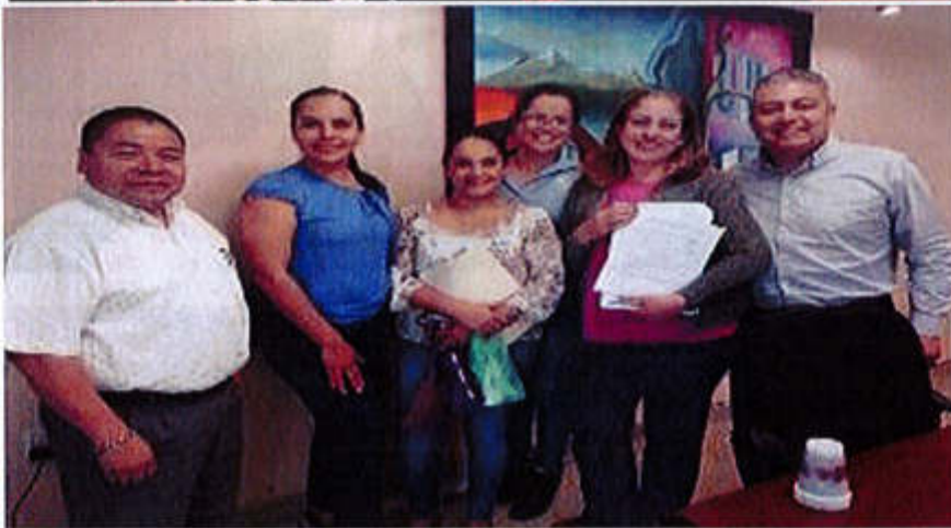
21, 22 Y 23 DE AGOSTO 2019- CONTINUACION DE LA SESION ORDINARIA 11.