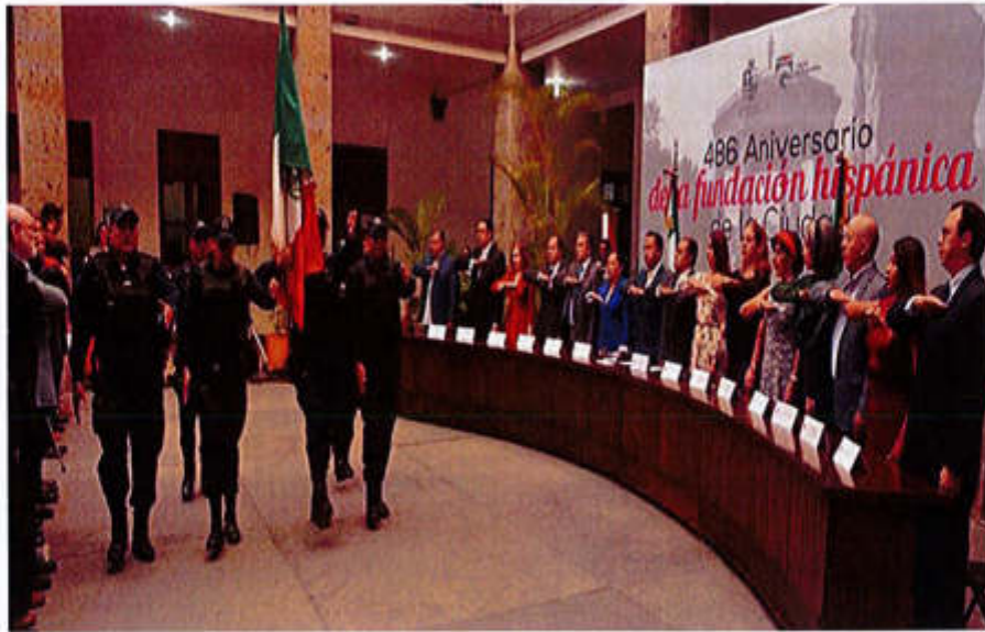
15 DE AGOSTO 2019- SESIÓN SOLEMNE NO. 7