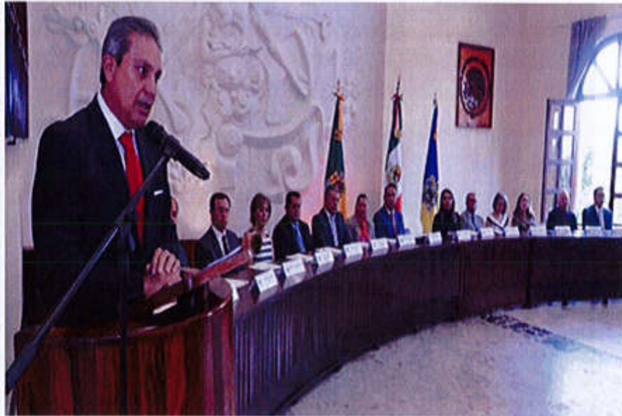
06 DE SEPTIEMBRE 2019- SESIÓN SOLEMNE NO. 8