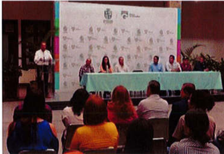
28 DE AGOSTO 2019- SE RECIBIO DONACION DE HERRAMIENTA Y MAQUINARIA POR PARTE DE EMPRESAS.