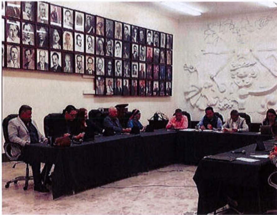
09 DE AGOSTO 2019, SESIÓN EXTRAORDINARIA NO. 23.