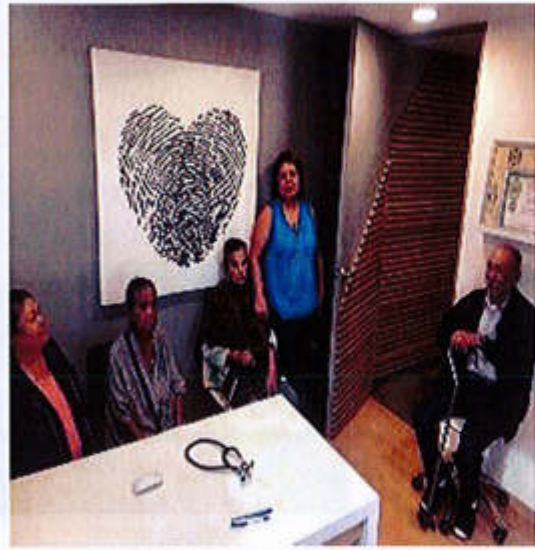
17 DE SEPTIEMBRE 2019- APOYO POR PARTE DEL CENTRO DE INVESTIGACION CARDIOVASCULAR EN ATENCION MÉDICA ESPECIALIZADA A LOS CIUDADANOS DE ZAPOTLAN Y TEOCUITATLAN.