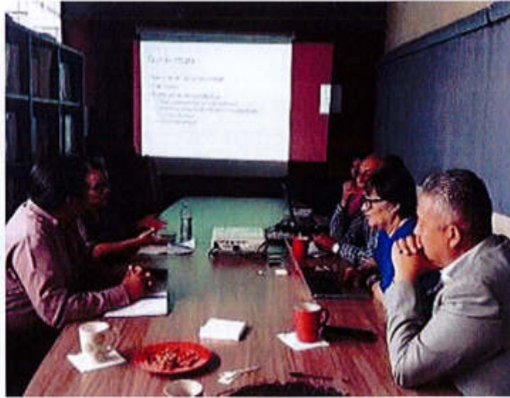
12 DE SEPTIEMBRE 2019- JORNADA DE TRABAJO EN COORDINACION CON CUSUR Y CIATEJ, EN PARTICIPACION DE PROPUESTA PARA LA COMUNIDAD DE ATEQUIZAYAN.