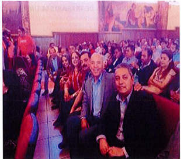
28 DE SEPTIEMBRE 2019- "ASISTENCIA EN EL PRIMER INFORME DE ACTIVIDADES DEL DIPUTADO HIGINIO DEL TORO PÉREZ".