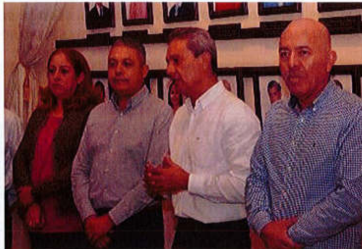
28 DE AGOSTO 2019- ENTREGA APOYOS DE ESTACIONOMETROS PARA LA ASISTENCIA SOCIAL.