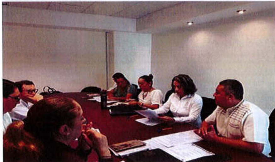
30 DE AGOSTO 2019- SESION EXTRAORDINARIA NO. 01.

Av. Cristobal Colón #62, Centro Histórico CP 49000, Cd. Guzmán, Zapotlán el Grande, Jal. Tel: (341) 575 2500 www.ciudadguzman.gob.mx