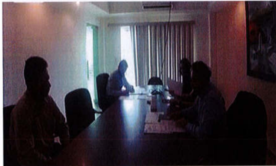
23 DE JULIO 2019- SESION ORDINARIA NO. 4. (PARTE 2).