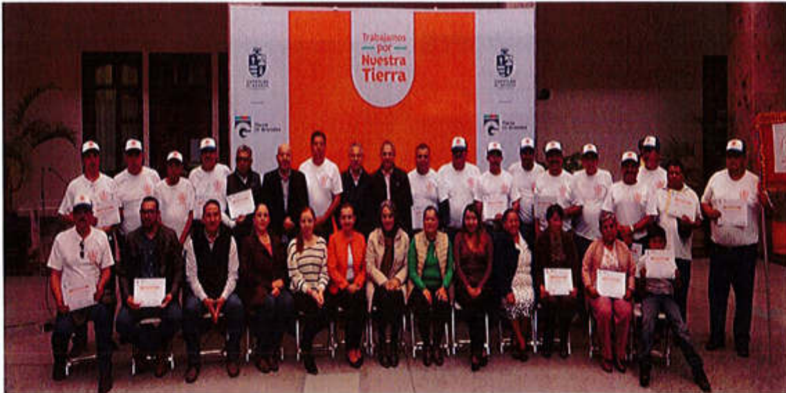
19 DE SEPTIEMBRE 2019- RECONOCIMIENTO AL PRIMER CUERPO DE BOMBEROS DE LA CIUDAD.