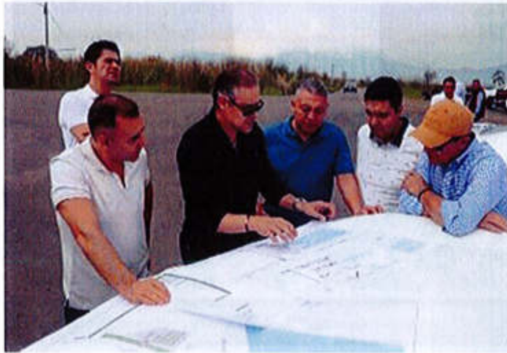
09 DE SEPTIEMBRE 2019- NUEVOS PROYECTOS PARA LA LAGUNA DE ZAPOTLAN EL GRANDE.