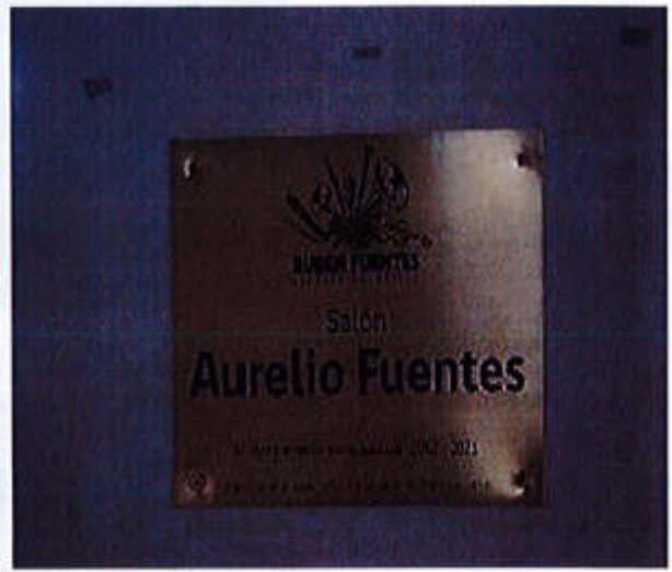
26 DE SEPTIEMBRE 2019- "HOMENAJE AL GRAN VIOLINISTA Y DIRECTOR DE ORQUESTA AURELIO FUENTES TRUJILLO EN EL 118 ANIVERSARIO DE SU NATALICIO".