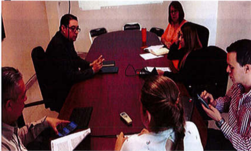
13 DE SEPTIEMBRE 2019- SESIÓN 13 EXTRAORDINARIA.