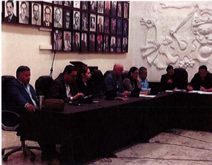
11 DE JULIO 2019, SESIÓN EXTRAORDINARIA NO. 18