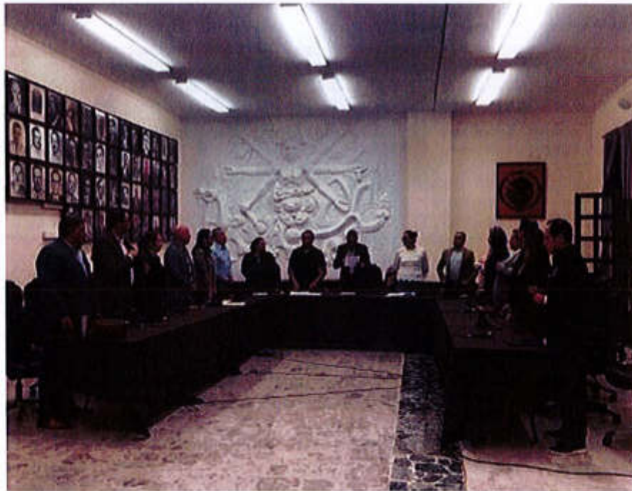
11 DE JULIO 2019 SESIÓN EXTRAORDINARIA NO. 19.