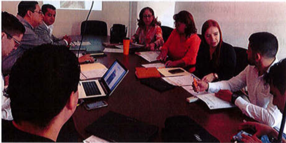
11 DE JULIO 2019- SESION ORDINARIA NO. 5

1.- CONOCIMIENTO DE LA RECEPCIÓN DE TURNOS QUE EN SESIÓN PÚBLICA ORDINARIA DE AYUNTAMIENTO NO.06 CELEBRADA EL DIA 14 DE MAYO DEL 2019 LE FUERO GIRADOS A LA PRESENTE COMISIÓN, PARA SU ESTUDIO, ANÁLISIS Y POSTERIOR DICTAMINACIÓN. (MISMOS QUE SE ANEXAN AL PRESENTE PARA SU CONOCIMIENTO).