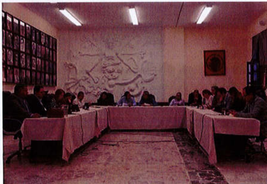
20 DE SEPTIEMBRE 2019, SESIÓN EXTRAORDINARIA NO. 30