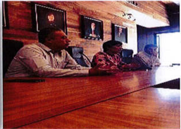
24 DE SEPTIEMBRE 2019- SE PRESENTO Y SOCIALIZO CON LOS REPRESENTANTES DE LA COMUNIDAD DE ATEQUIZAYAN EL PROYECTO DEL HUMEDAL ARTIFICIAL