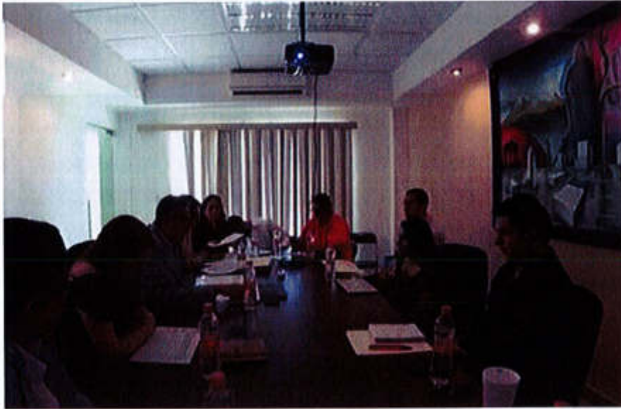
22 DE JULIO 2019- SESION ORDINARIA NO. 4.