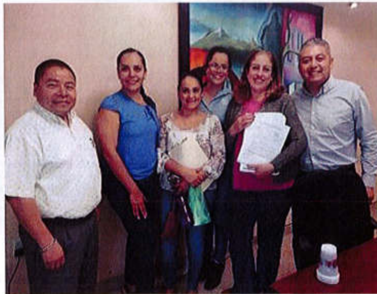
23 DE AGOSTO 2019- SE REALIZO LA APROBACION EN COMISION LA LEY DE INGRESOS 2020.