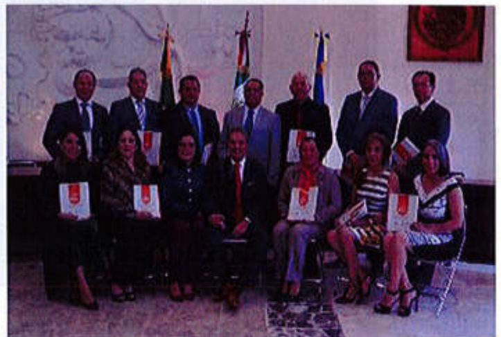
06 DE SEPTIEMBRE 2019- ENTREGA DEL PRIMER INFORME DE TRABAJO MUNICIPAL DE ZAPOTLAN EL GRANDE, ADMINISTRACION 2018-2021.