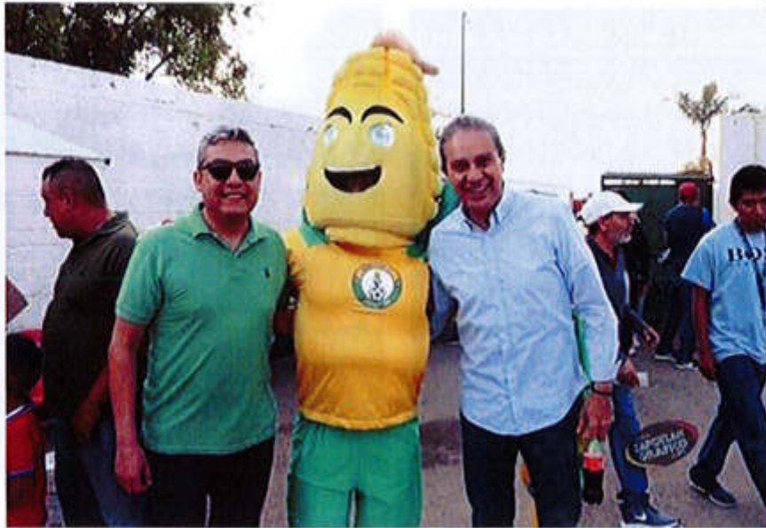
05 DE SEPTIEMBRE 2019- PRESENTACION DEL EQUIPO DE MAZORQUEROS FC EN LA TEMPORADA A 2019- 2020.