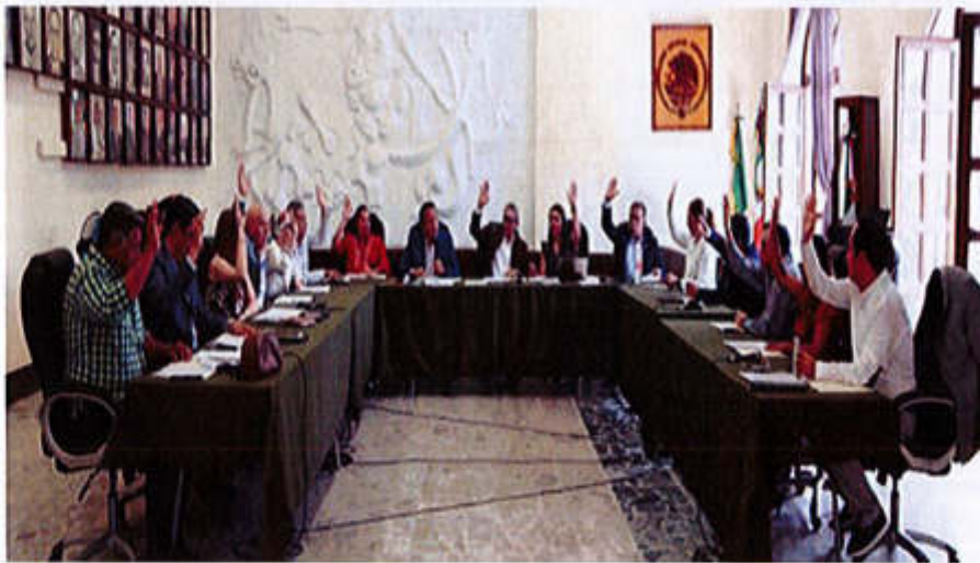
12 DE AGOSTO 2019- SESIÓN EXTRAORDINARIA NO. 24.

Av. Cristobal Colón #62, Centro Histórico CP 49000, Cd. Guzmán, Zapotlán el Grande, Jal. Tel: (341) 575 2500 www.ciudadguzman.gob.mx