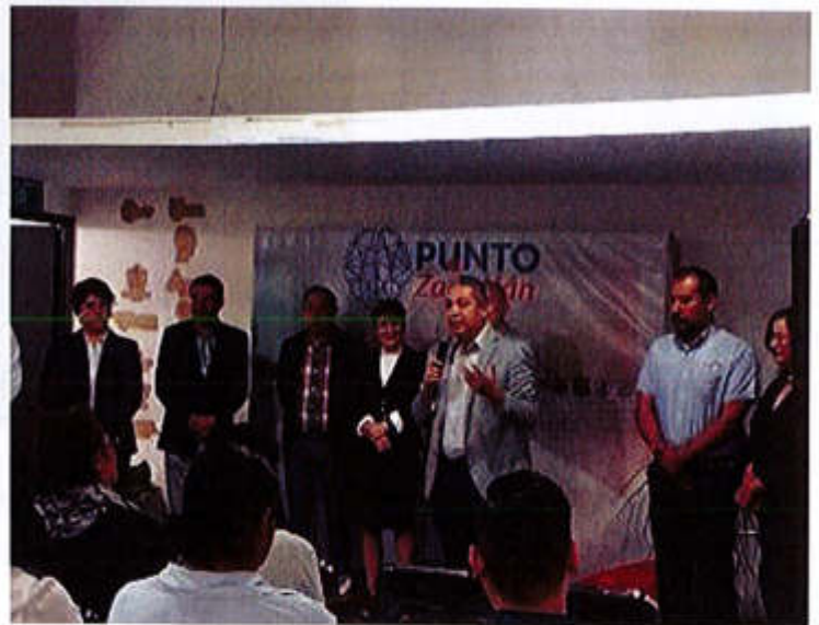
04 DE SEPTIEMBRE 2019- PARTICIPACION EN EL FORO "LA INNOVACION EN EL CAMPO"