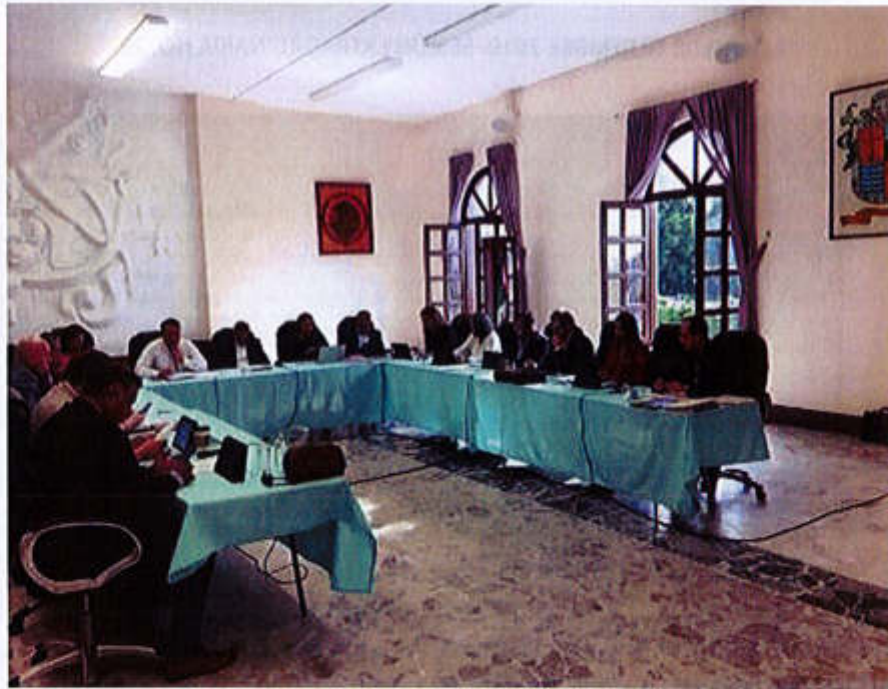
11 DE SEPTIEMBRE 2019- SESIÓN ORDINARIA NO. 09

Av. Cristobal Colón #62, Centro Histórico CP 49000, Cd. Guzmán, Zapotlán el Grande, Jal. Tel: (341) 575 2500 www.ciudadguzman.gob.mx