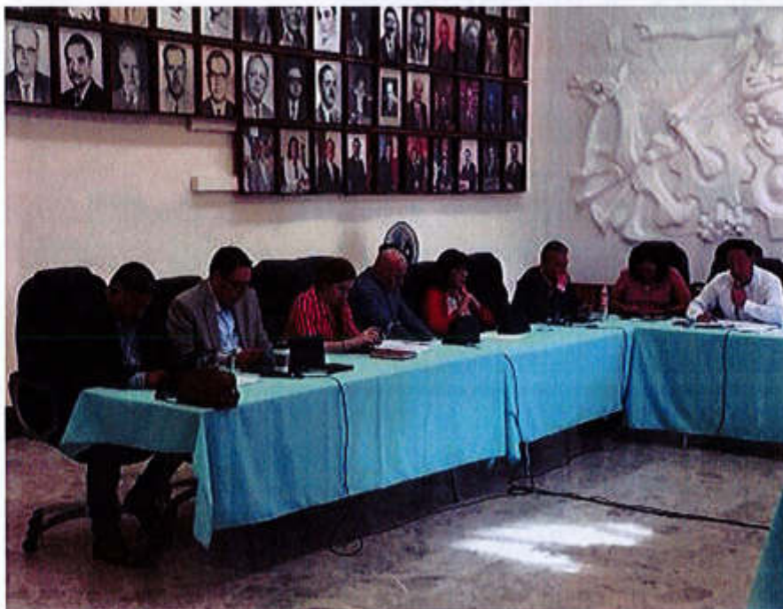
15 DE JULIO 2019- SESION EXTRAORDINARIA NO. 20.