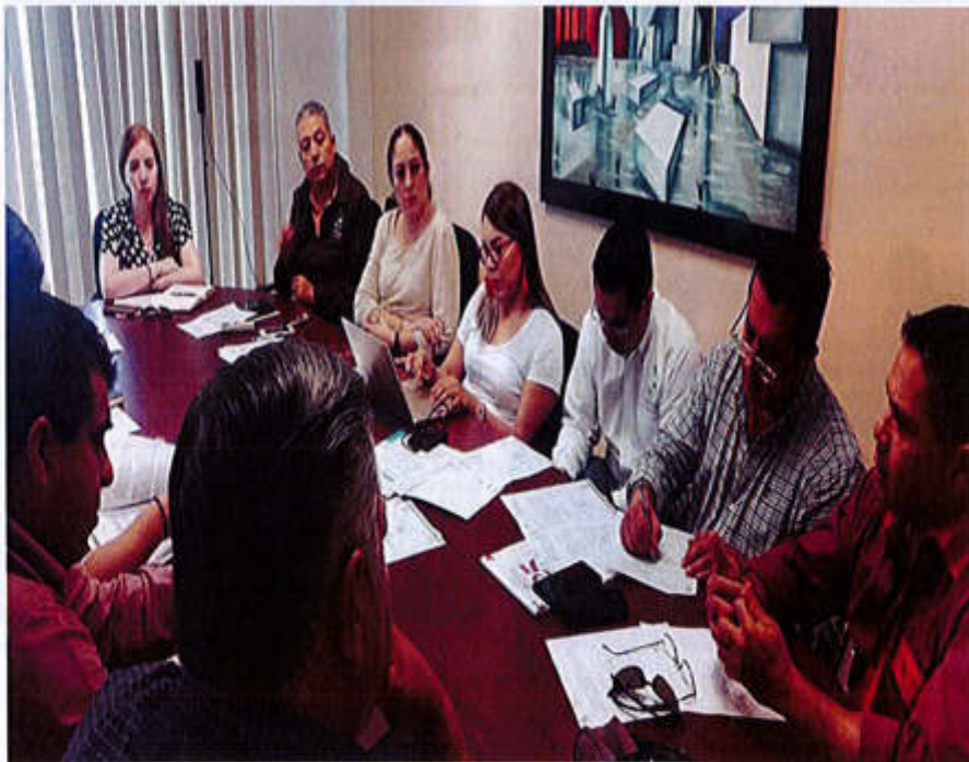
02 DE SEPTIEMBRE 2019- SESIÓN EXTRAORDINARIA NO. 12