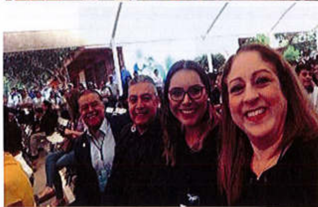
11 DE SEPTIEMBRE 2019- INICIO DE ENTREGA DE UNIFORMES ESCOLARES PARA EL CICLO ESCOLAR

Av. Cristobal Colón #62, Centro Histórico 2019-2020 EN LA ESCUELA TECNICA NO. 100 CP 49000, Cd. Guzmán, Zapotlán el Grande, Jal. Tel: (341) 575 2500 www.ciudadguzman.gob.mx