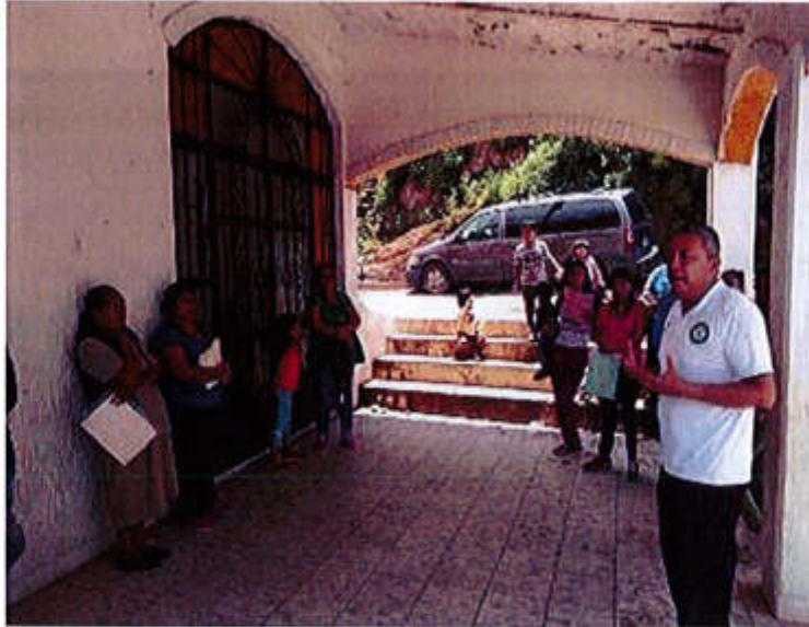
31 DE JULIO 2019- SE REALIZO UNA PLATICA PARA REALIZAR UN TRABAJO CONSTANTE YA QUE CON LOS CIUDADANOS ORGANIZADOS HACE LA DIFERENCIA PARA TENER UNA CIUDAD PARA TODOS.