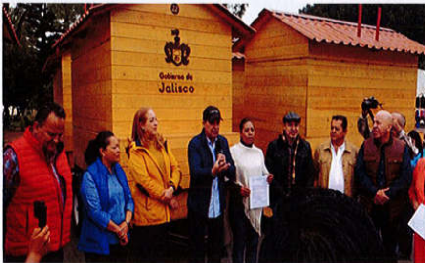
01 DE FEBRERO 2020- ENTREGA A LA ASOCIACIÓN DE COMERCIANTES CARROS PARA VENTA.