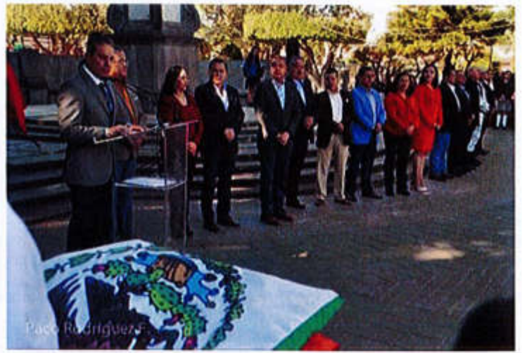
24 DE FEBRERO 2020- ASISTENCIA AL ANIVERSARIO DEL DIA DE LA BANDERA NACIONAL, EN LA PLAZA PRINCIPAL DE ZAPOTLÁN EL GRANDE, JALISCO.