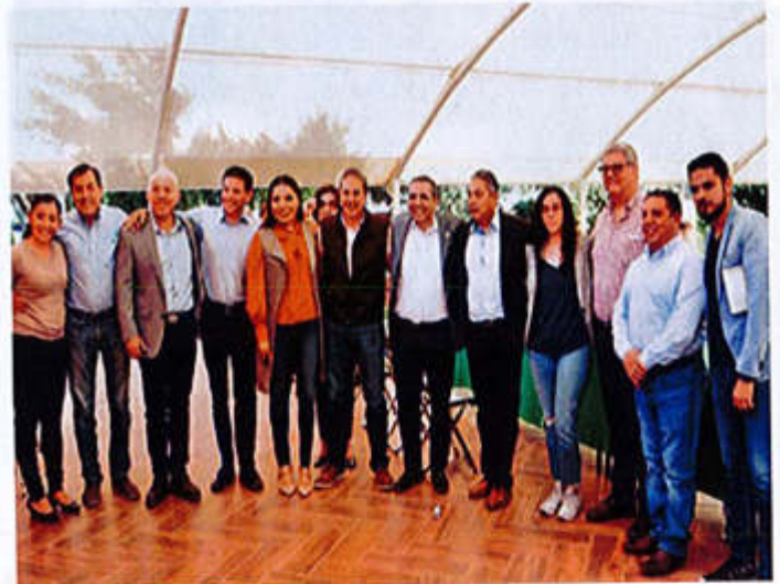
21 DE FEBRERO 2020- FIRMA DE CONVENIO DE COLABORACION CELEBRADO ENTRE EL H. AYUNTAMIENTO DE ZAPOTLAN EL GRANDE Y LA ASOCIACION MEXICANA DE SISTEMAS DE CAPTACION DE AGUA DE LLUVIA A.C. EN LA ESCUELA SECUNDARIA TECNICA NO. 100.