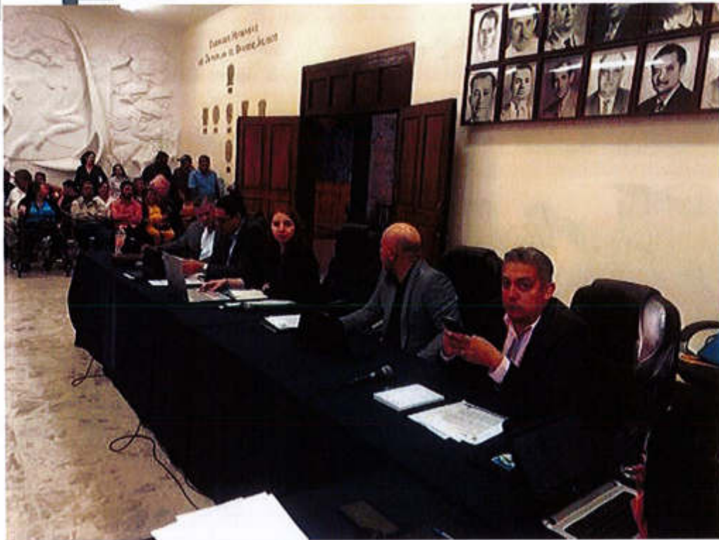
19 DE FEBRERO 2020- SESIÓN ORDINARIA NO. 13