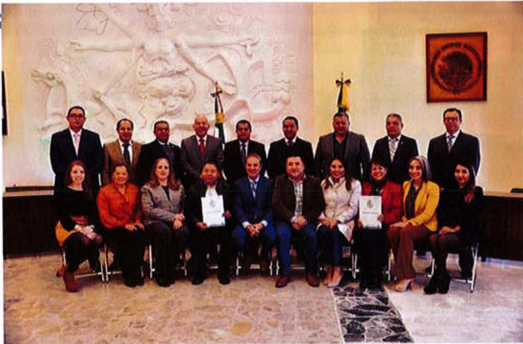
09 DE ENERO 2020- "SESIÓN EXTRAORDINARIA NO. 15"