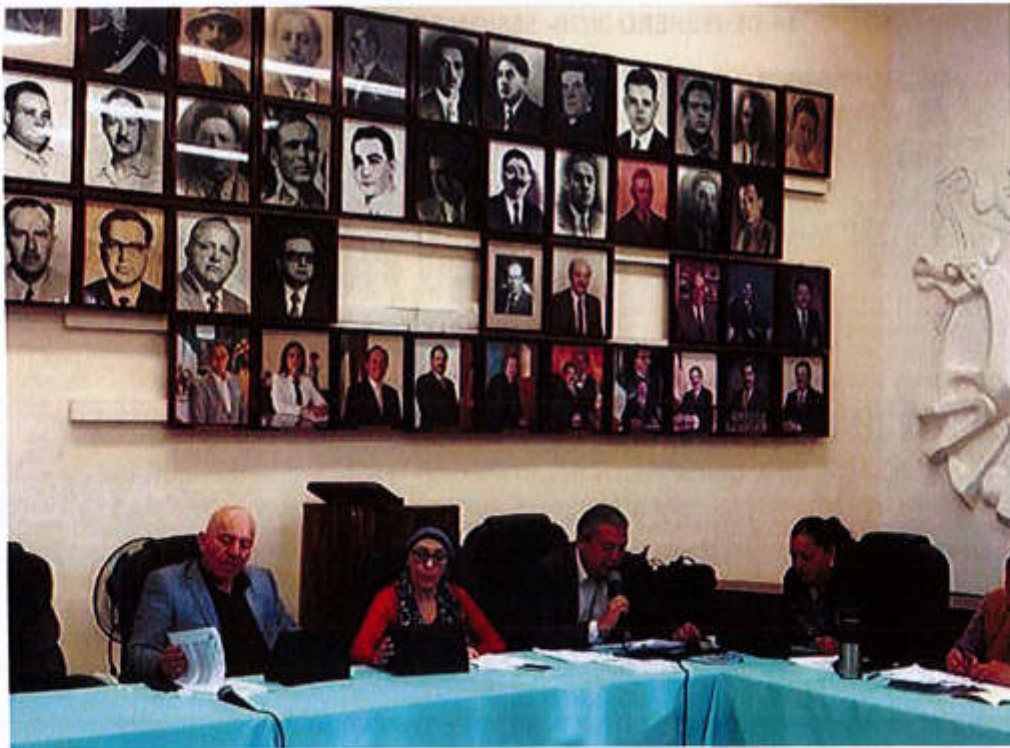
10 DE FEBRERO 2020- SESIÓN ORDINARIA NO. 12