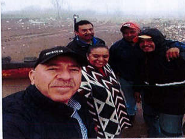
05 DE FEBRERO 2020- VISITA A LA REGION SANITARIA.