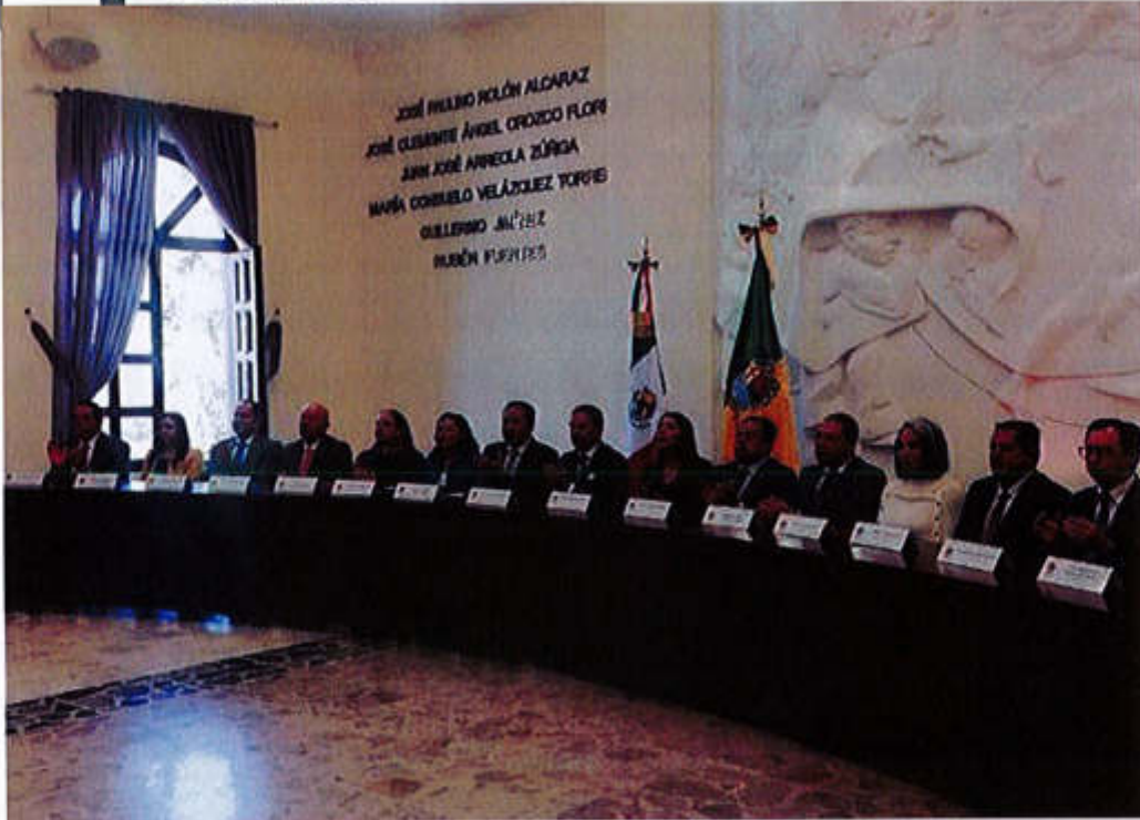
28 DE ENERO 2020- SESIÓN SOLEMNE NO. 17