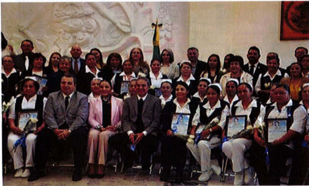
15 DE ENERO 2020- SESION SOLEMNE NO. 16

Av. Cristobal Colón #62, Centro Histórico CP 49000, Cd. Guzmán, Zapotlán el Grande, Jal. Tel: (341) 575 2500 www.ciudadguzman.gob.mx