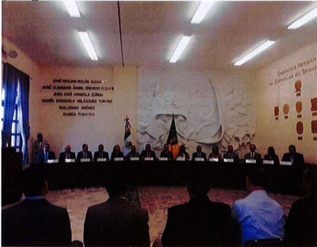
14 DE FEBRERO 2020- SESIÓN SOLEMNE NO. 18