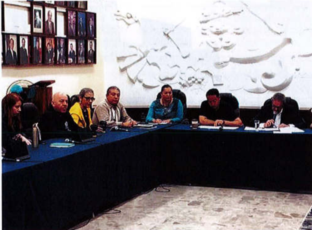
18 DE MARZO 2020- SESIÓN EXTRAORDINARIA NO. 47