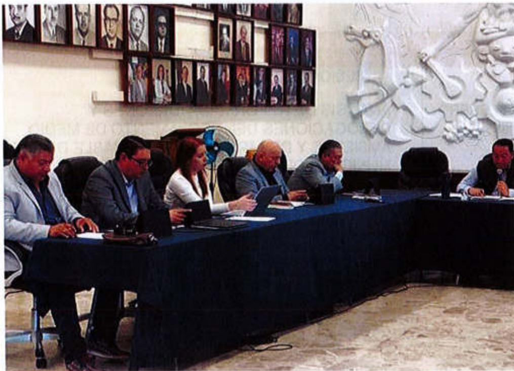
05 DE MARZO 2020- SESIÓN ORDINARIA NO. 14