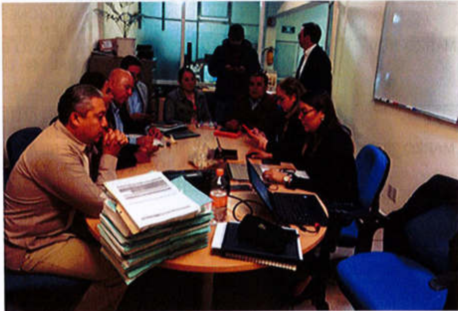
30 DE MARZO 2020- SESIÓN ORDINARIA NO. 7