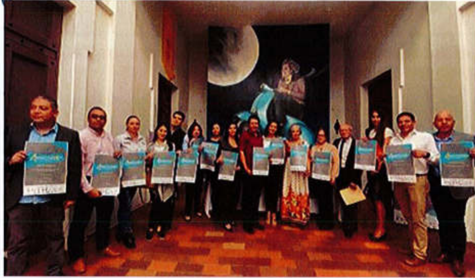
22 DE FEBRERO 2020- PRESENTACION DEL 4TO CONCURSO DE INNOVACIÓN, EMPREDIMIENTO, CIENCIA Y TECNOLOGÍA DE ZAPOTLÁN EN EL CENTRO CULTURAL "JOSE CLEMENTE OROZCO.