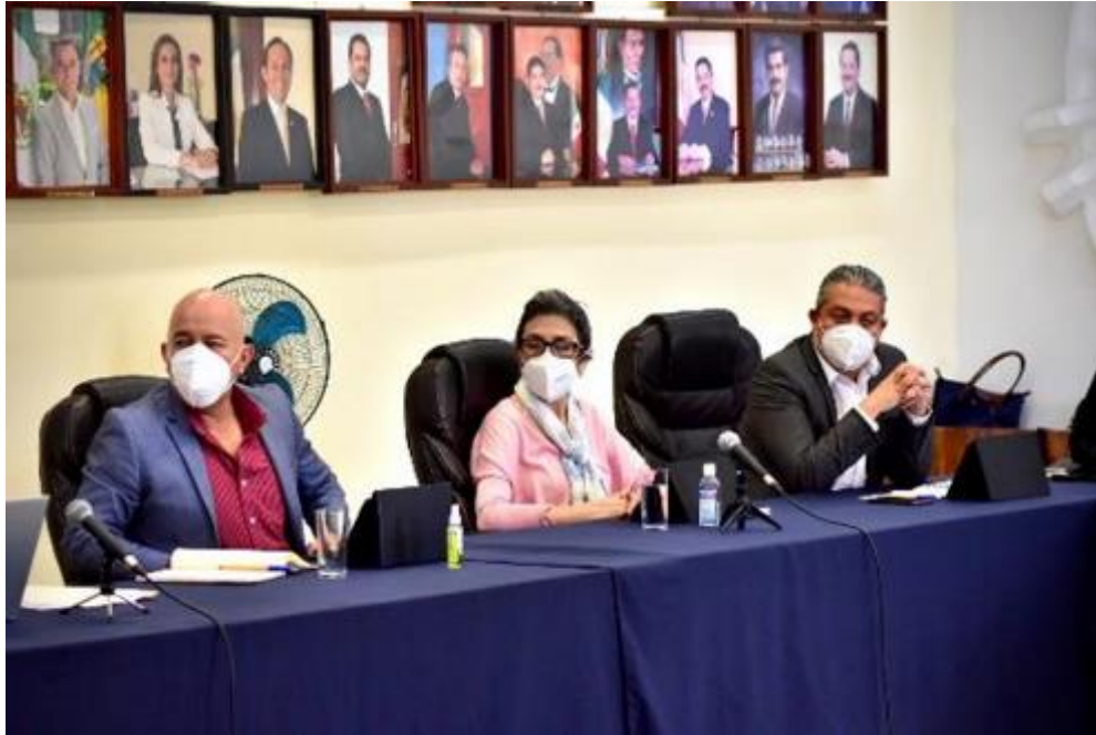
03 DE JULIO 2020.