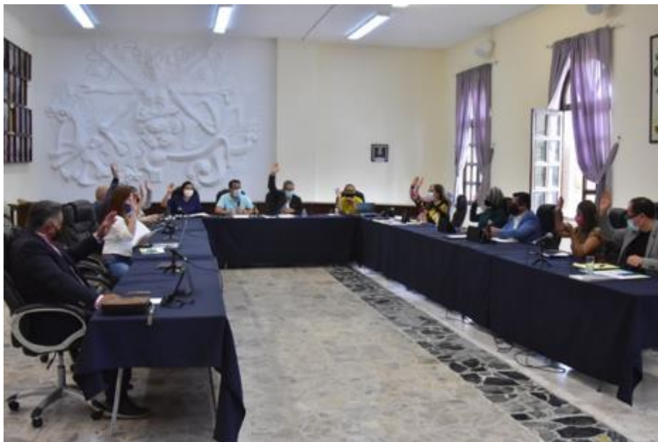
21 DE AGOSTO 2020.