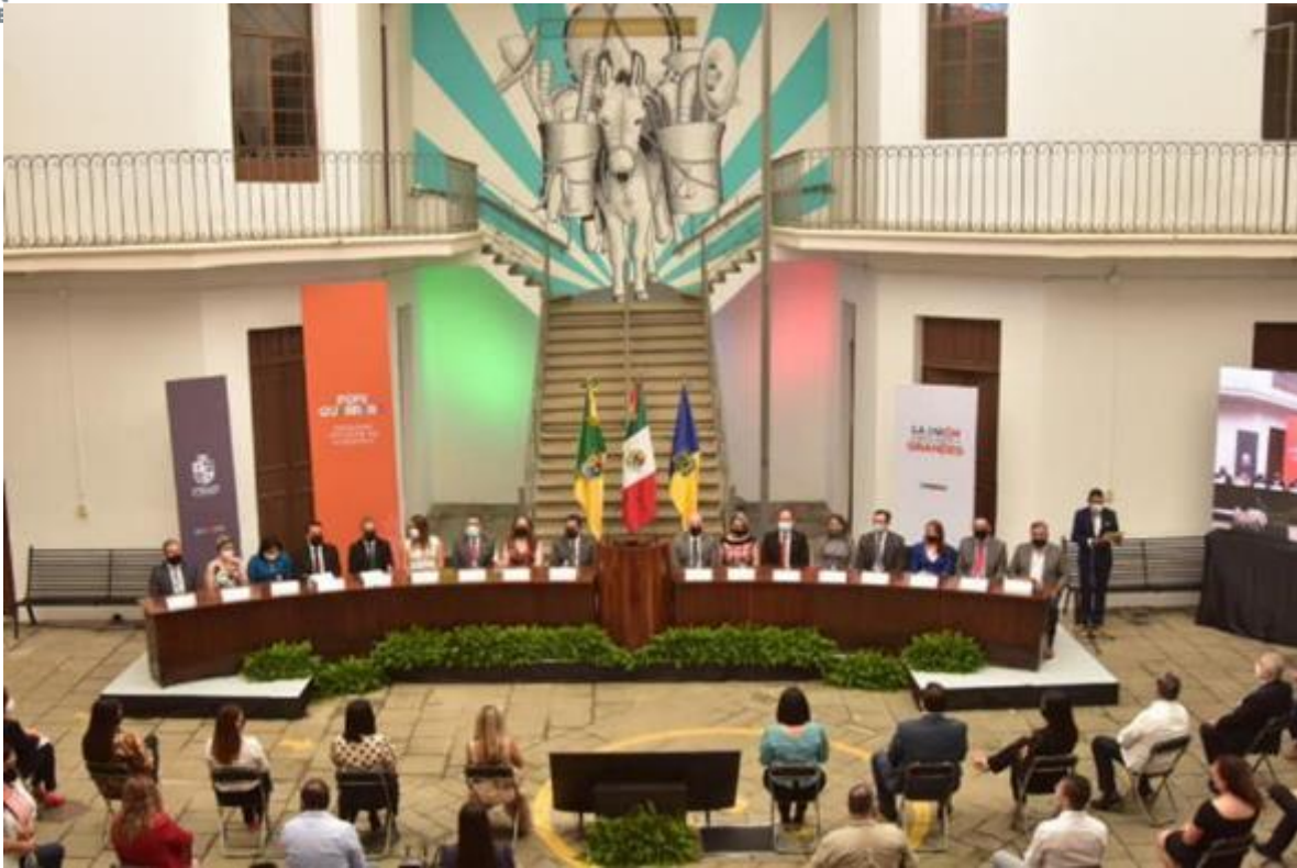
11 DE SEPTIEMBRE 2020.