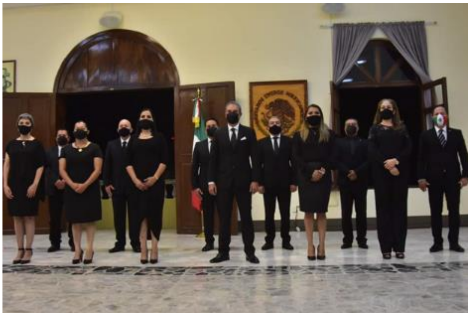
15 DE SEPTIEMBRE 2020.