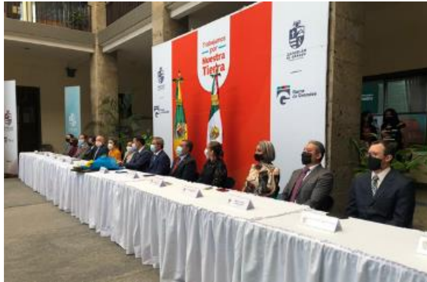
18 DE AGOSTO 2020.