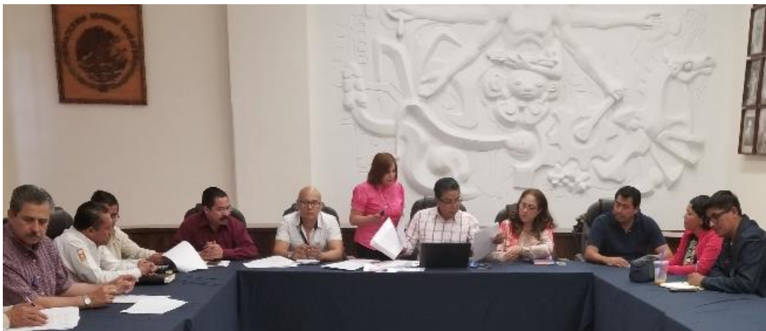
SESIÓN DEL 23 DE MARZO 2018. SUBASTA