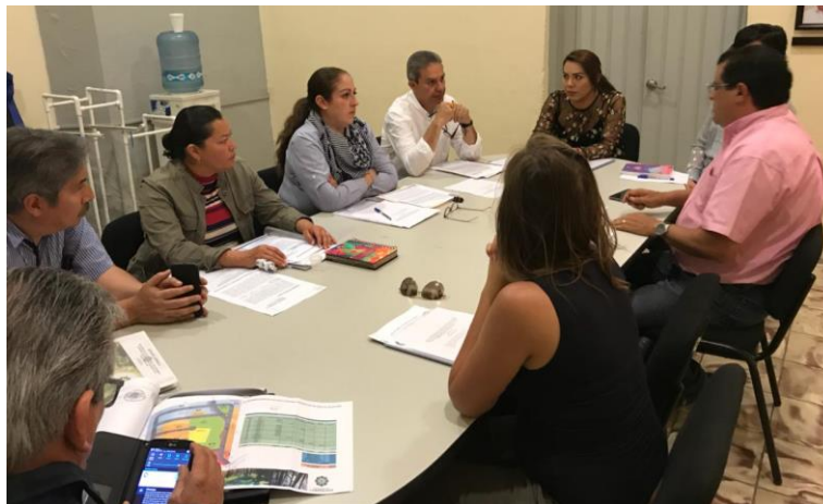
20 DE MARZO 2018. SESION EXTRAORDINARIA DE OBRA PÚBLICA, COMO COADYUVANTE HACIENDA PÚBLICA.