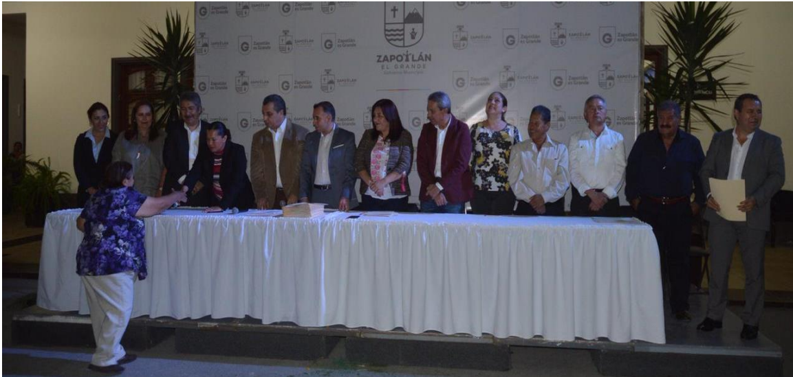
20 DE MARZO. ENTREGA DE DOCUMENTOS DE CONCESIÓN A LOCATARIOS DEL MERCADO SOLIDARIDAD.