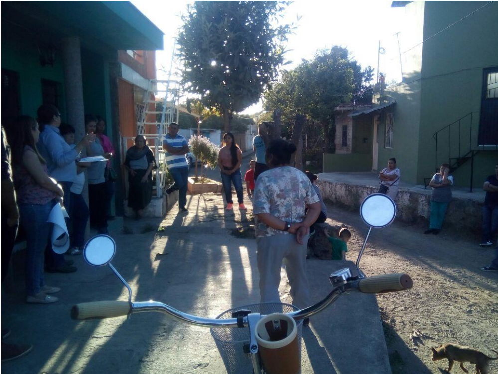
20 DE MARZO 2018. CONFORMACIÓN DEL COMITÉ DE OBRA EN EL ARROYO DE GONZALEZ ORTEGA.