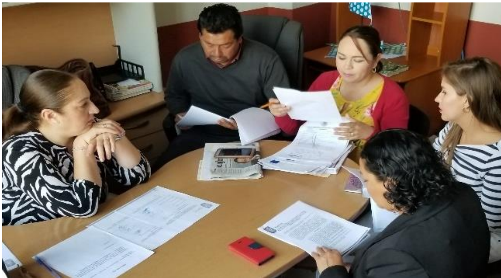
22 DE MARZO 2018. SESIÓN 34 EXTRAORDINARIA DE LA COMISIÓN DE HACIENDA Y DE PATRIMONIO CONJUNTA CON LA DE OBRA PUBLICA.