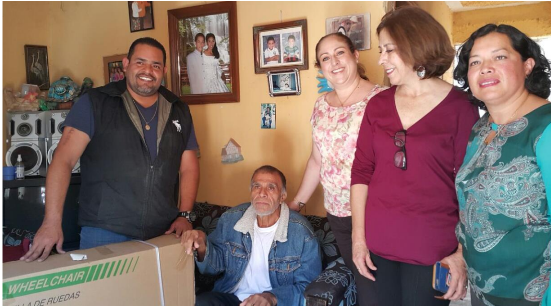
21 DE FEBRERO. ENTREGA DE SILLAS DE RUEDAS JALISCO INCLUYENTE. PRIVADA DE ESQUIPULAS.