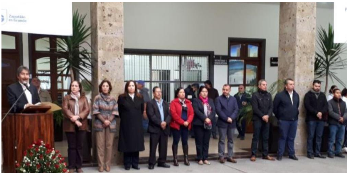
31 ENERO 2018. 194 ANIVERSARIO DE LA APROBACION DEL ACTA CONSTITUTIVA DE LA FEDERACION MEXICANA (1824).