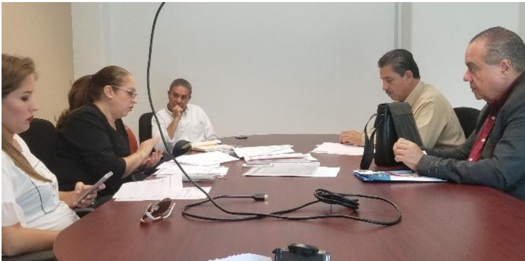
16 DE MARZO 2018. SESIÓN NO. 33 EXTRAORDINARIA DE LA COMISIÓN DE HACIENDA Y DE PATRIMONIO.