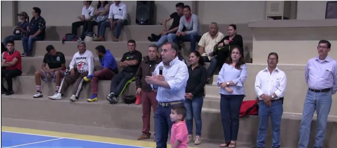
25 DE MARZO 2018. INAUGURACIÓN DE LAS INSTALACIONES REMODELADAS DEL GIMNASIO BENITO JUAREZ.