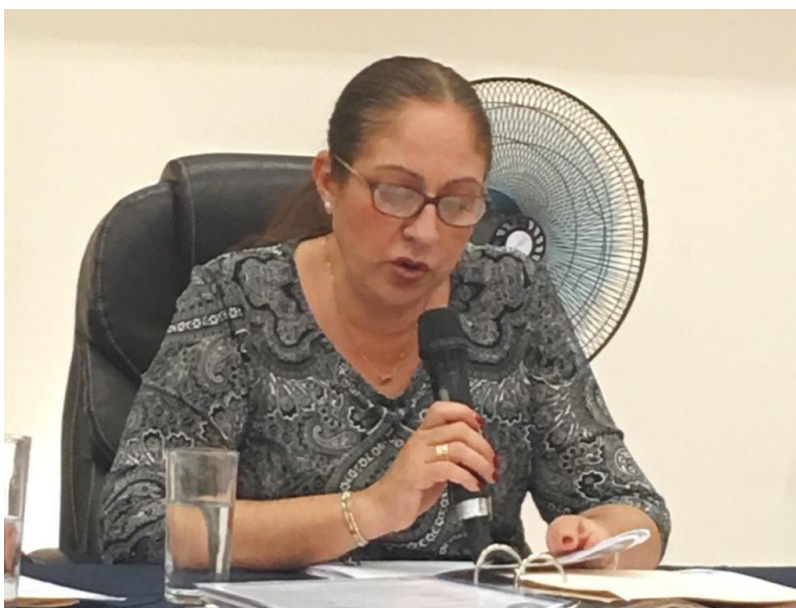
06 DE MARZO 2018. SESIÓN EXTRAORDINARIA NO. 56.