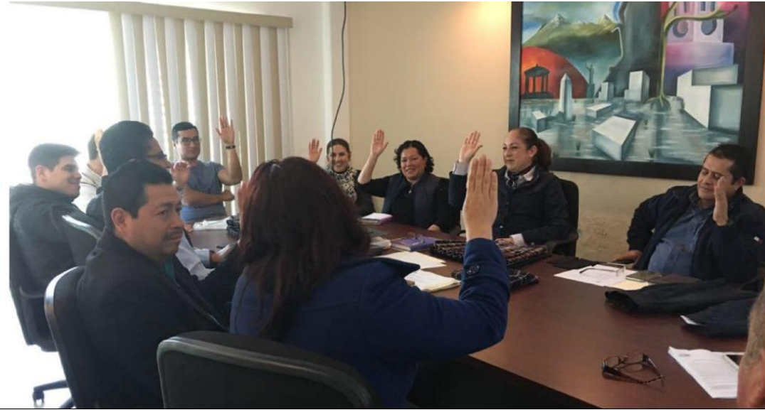
02 FEBRERO 2018. FALLO UNIFORMES ESCOLARES