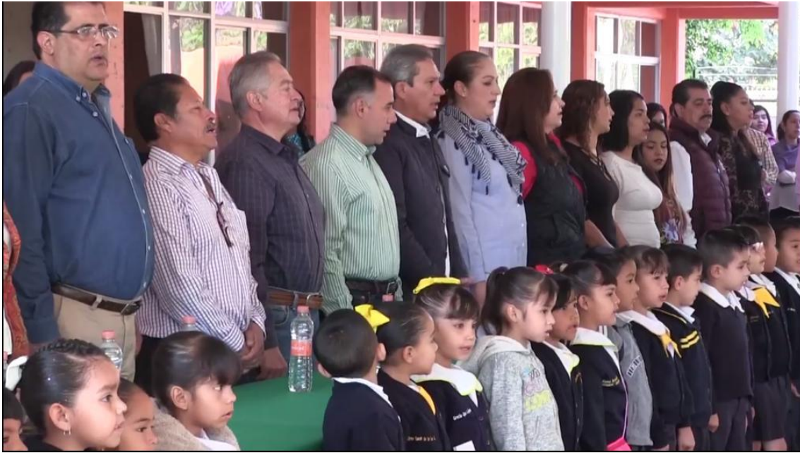
01 DE MARZO 2018. INAGURACION DE DOMO DEL JARDIN DE NIÑOS RAMON GARCIA.