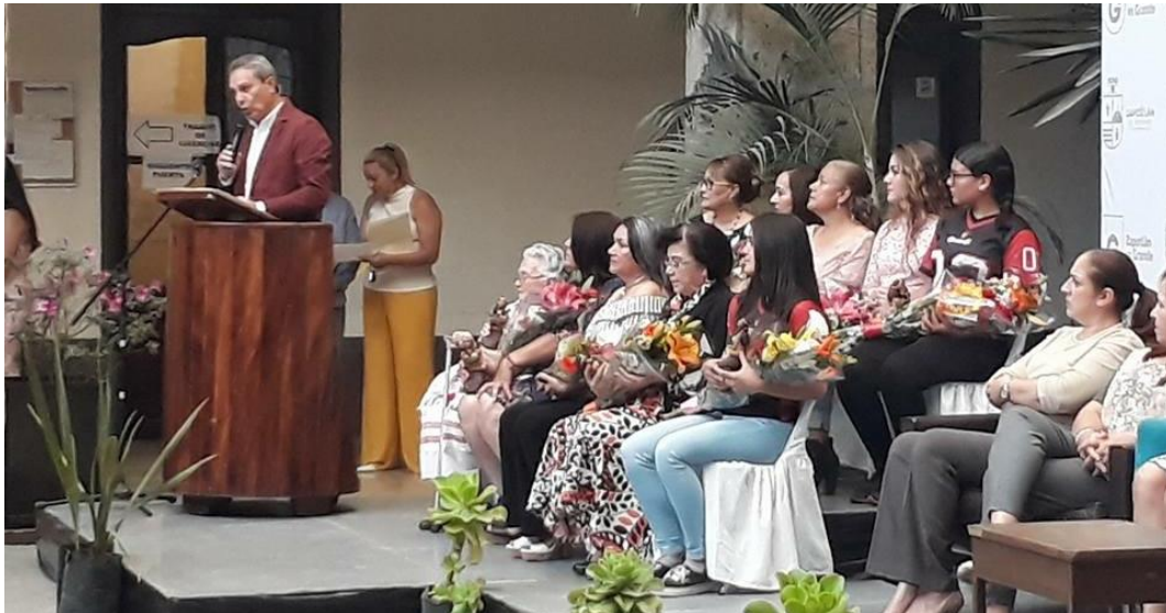
11 DE MARZO 2018. ENTREGA DE PRESEAS A LA MUJER ZAPOTLENSE DESTACADA.