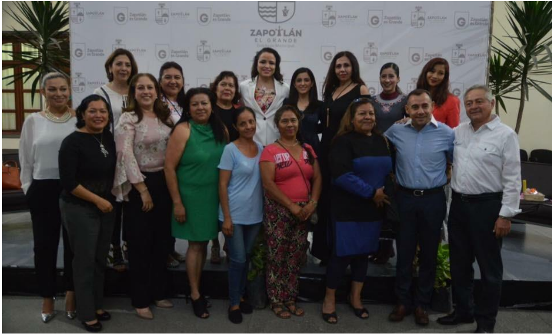
08 DE MARZO 2018. CHARLA CON MUJERES DESTACADAS CONMEMORANDO EL DÍA INTERNACIONAL DE LA MUJER.