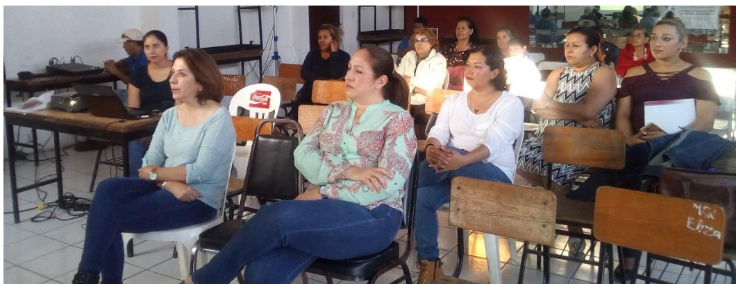
07 DE MARZO 2018. CONFERENCIA EN LA DELEGACIÓN EL FRESNITO CONMEMORANDO EL DÍA INTERNACIONAL DE LA MUJER.