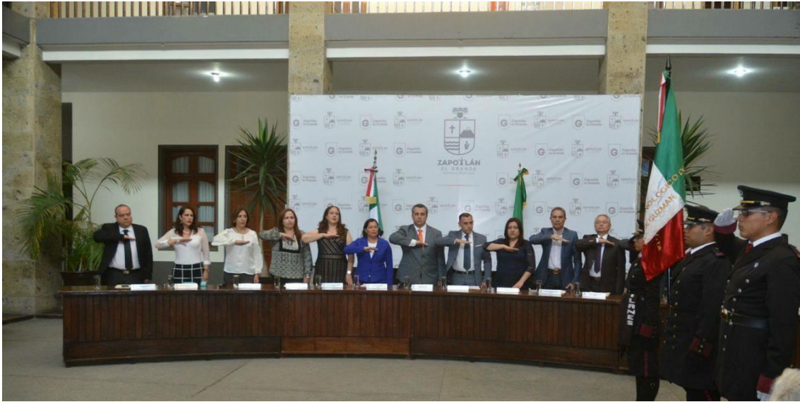
23 DE MARZO DE 2018. SESION EXTRAORDINARIA.