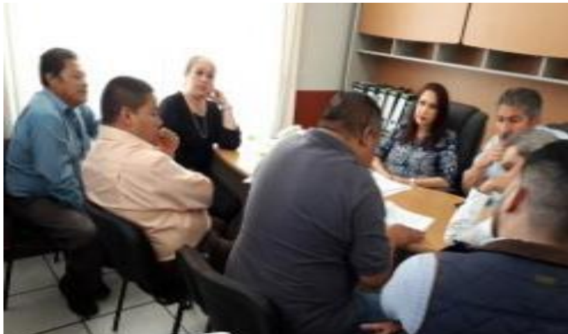
28 DE FEBRERO