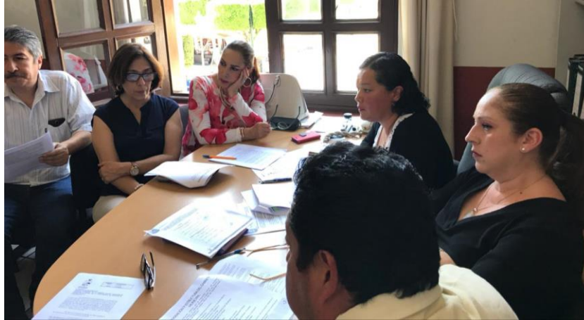
16 de marzo del 2018.

SESIÓN DE COMISIÓN DONDE SE APRUEBA LA CREACIÓN DEL GABINETE DE PREVENCIÓN SOCIAL DEL DELITO.