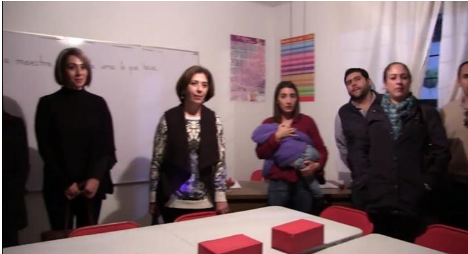
25 DE ENERO 2018. INAUGURACIÓN CASA LÍDERES.