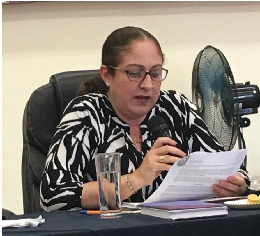
22 DE MARZO DEL 2018. SESION EXTRAORDINARIA NO.23