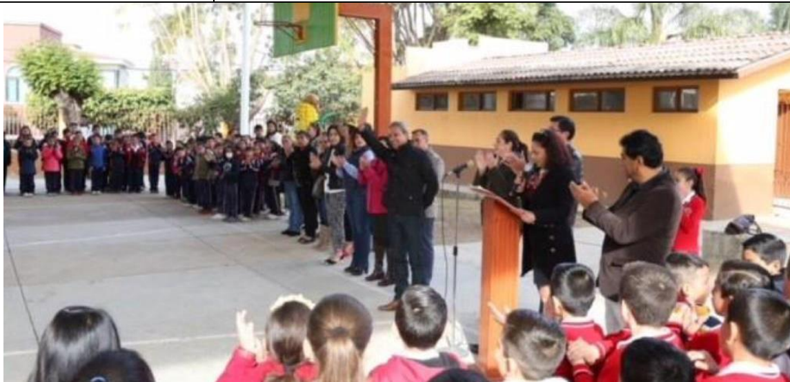
09 DE ENERO 2018. INAGURACION DE DOMO EN ESCUELA PRIMARIA GORDIANO GUZMAN.