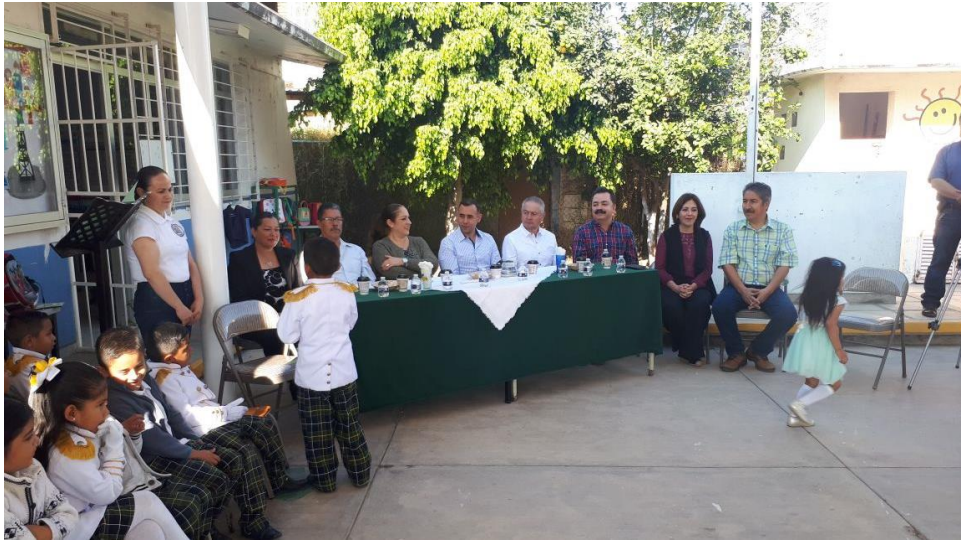
06 DE MARZO 2018. INAUGURACIÓN DEL DOMO JARDÍN DE NIÑOS AMADO NERVO.