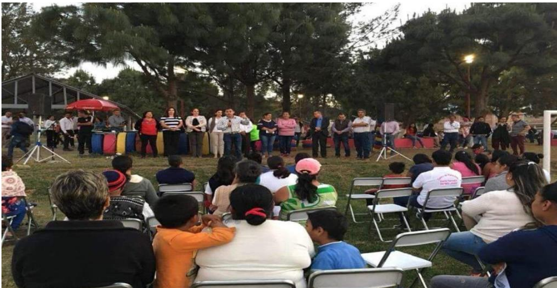
05 DE MARZO DE 2018. INAGURACION DEL PARQUE UNION DE COLONOS