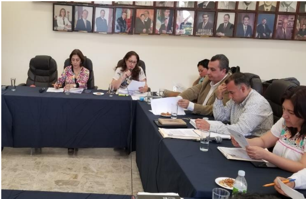
12 DE FEBRERO. SESIÓN ORDINARIA NO. 22