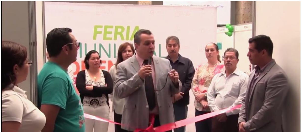
22 DE FEBRERO 2018. PRIMERA FERIA MUNICIPAL DEL EMPLEO.