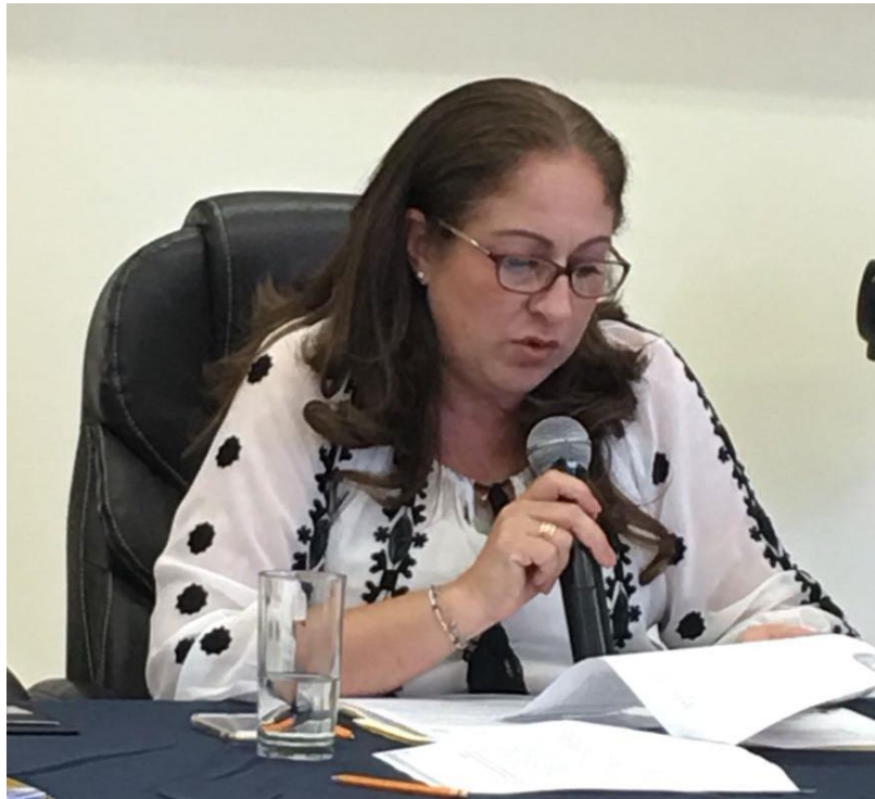
15 DE MARZO 2018. SESION EXTRAORDINARIA NO. 57 Y 58