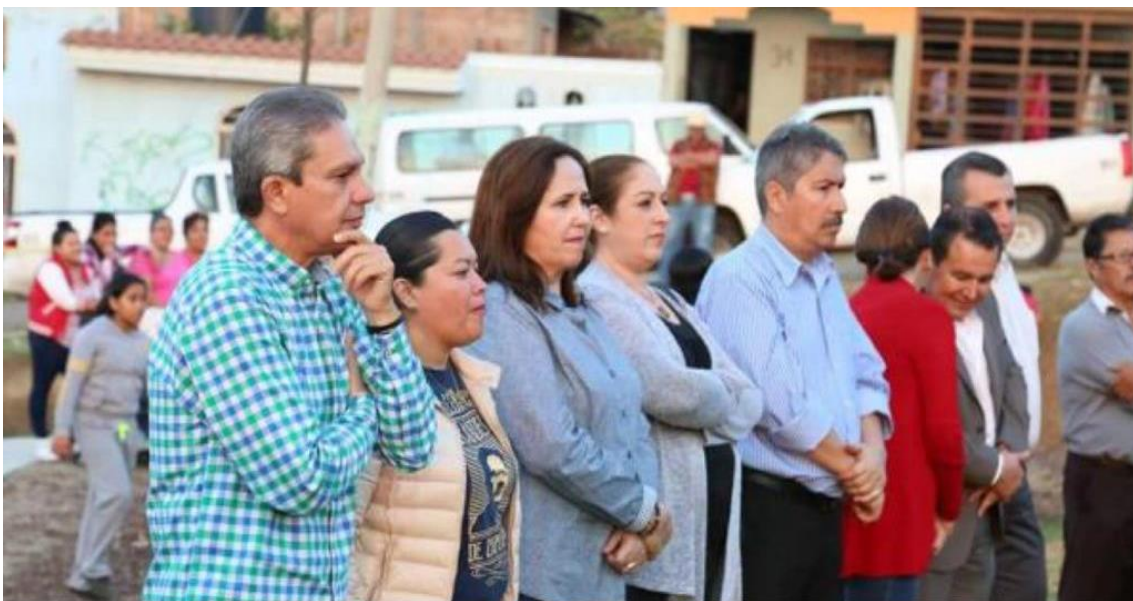
15 FEBRERO 2018. INAGURACION PARQUE COLONIA EL PASTOR DE ARRIBA.