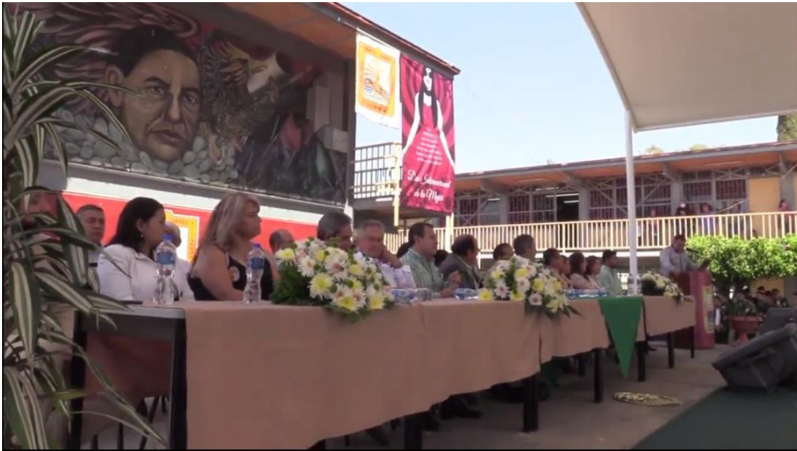
08 DE MARZO 2018. INAGURACION DOMO DE LA ESCUELA SECUNDARIA NO. 1 BENITO JUAREZ