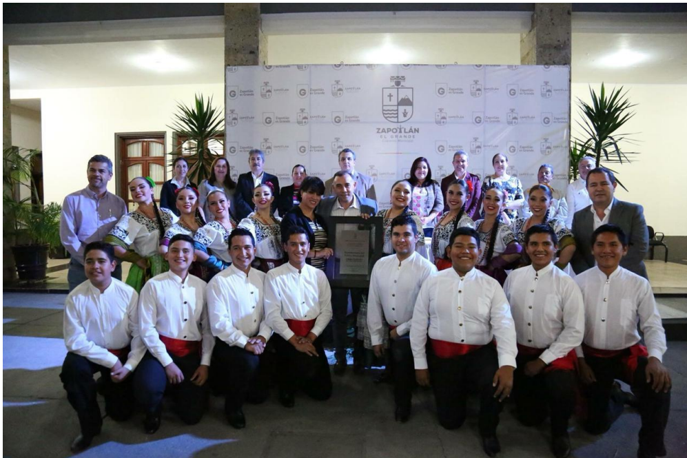
20 DE MARZO 2018. ENTREGA DE RECONOCIMIENTO AL BALLE TLAYACAN.