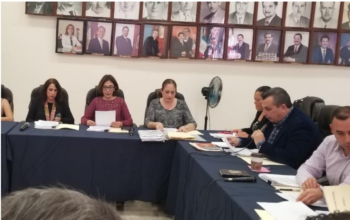
06 DE MARZO DEL 2018. SESIÓN EXTRAORDINARIA NO. 56