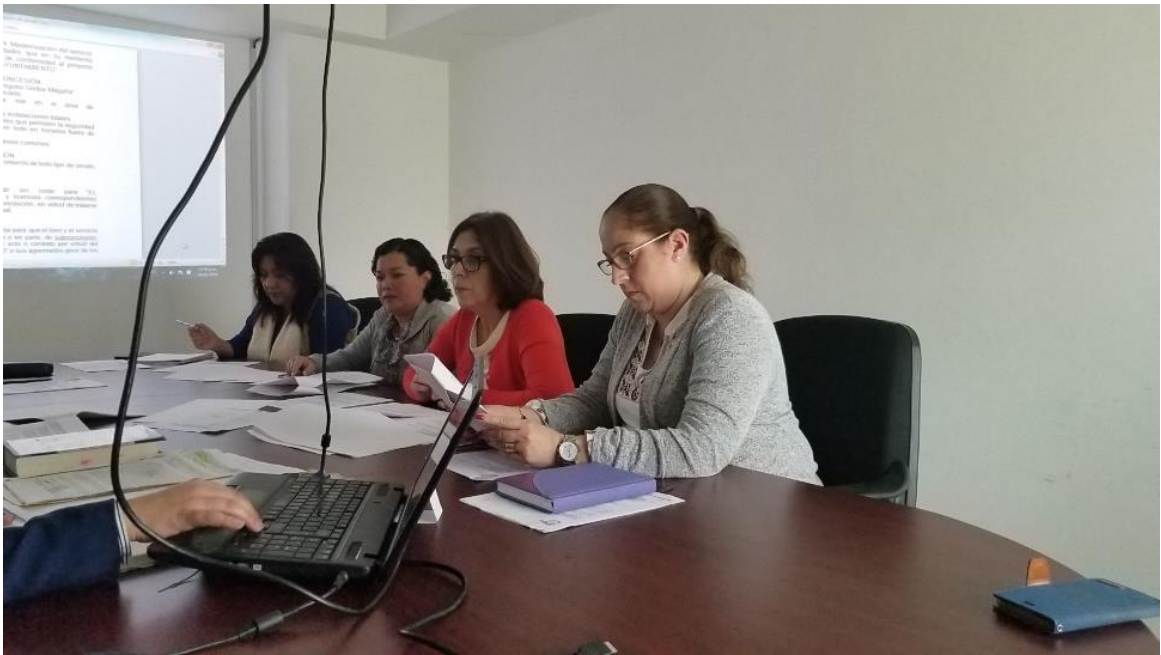
19 DE FEBRERO DEL 2018.