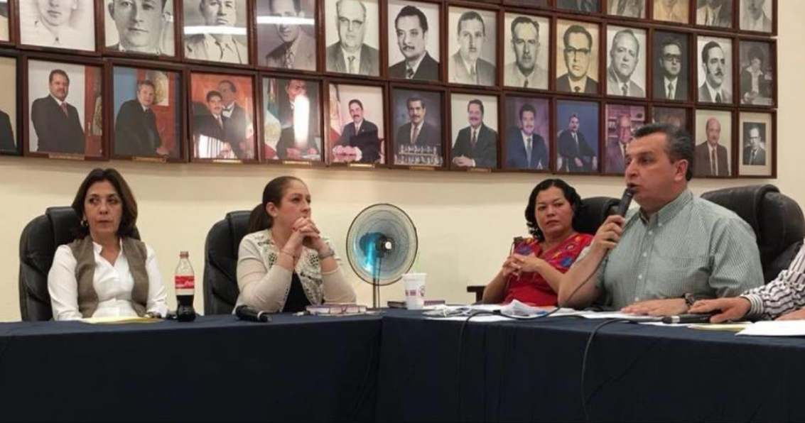
12 FEBRERO 2108. SESION ORDINARIA NO. 22