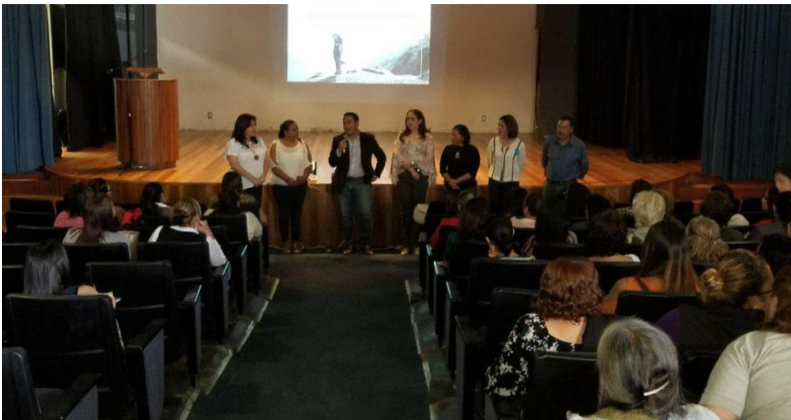
08 DE MARZO 2018. CONFERENCIA EN CASA DE LA CULTURA DIA INTERNACIONAL DE LA MUJER.