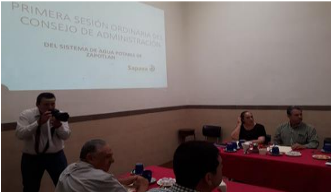
27 DE FEBRERO 2018.