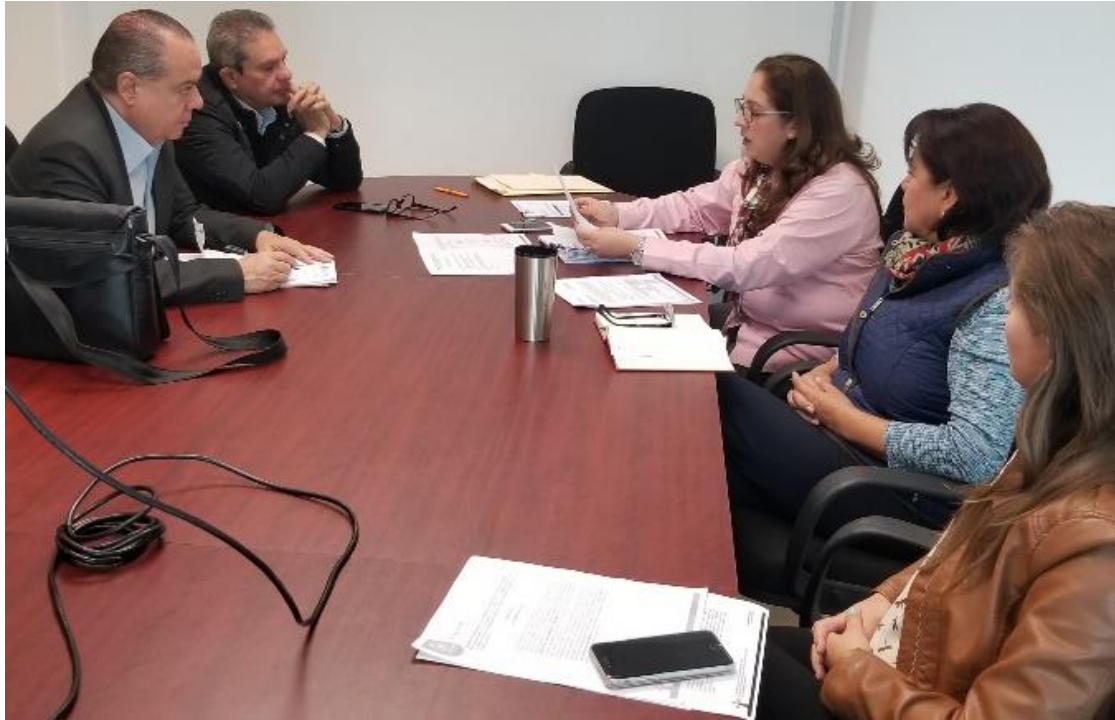
8 DE FEBRERO 2018. SESIÓN NO. 30 EXTRAORDINARIA DE LA COMISIÓN DE HACIENDA Y DE PATRIMONIO