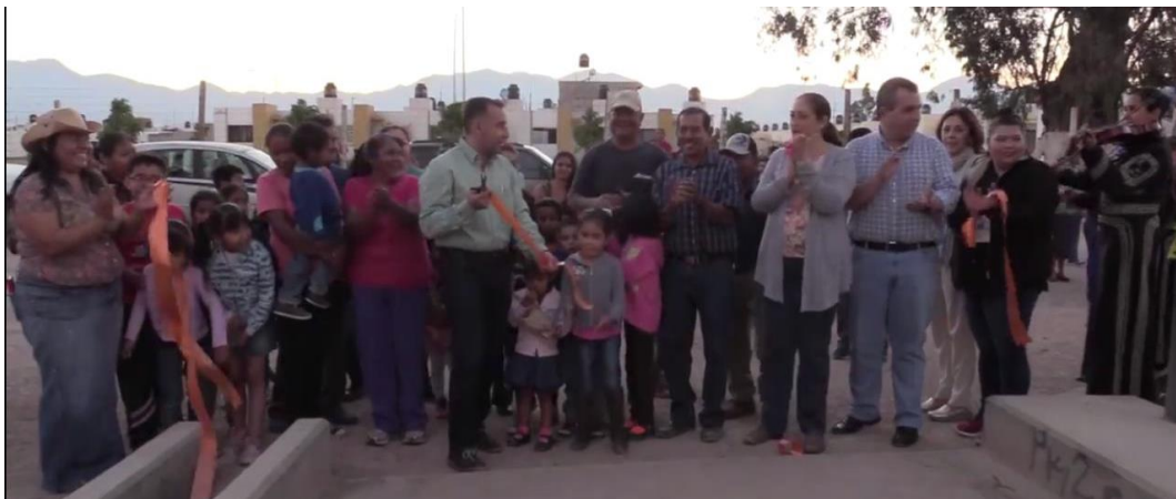
14 DE MARZO 2018. INAUGURACIÓN DE LA CALLE APOLO Y PUENTE.