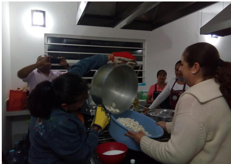
22 DE FEBRERO 2018. CINE EN TU COLONIA, COLONIA TEOCALLI.