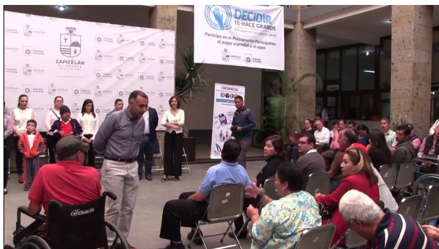
27 DE FEBRERO 2018. DÍA NACIONAL DE LA INCLUSIÓN LABORAL PARA PERSONAS CON DISCAPACIDAD.