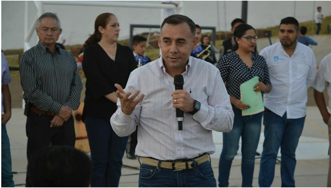
16 DE MARZO 2018. INAUGURACIÓN DEL PARQUE LA GIRALDA.