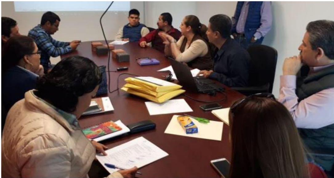
20 FEBRERO 2018. ELECCION DE PRESIDENTE DE LA COMISION.