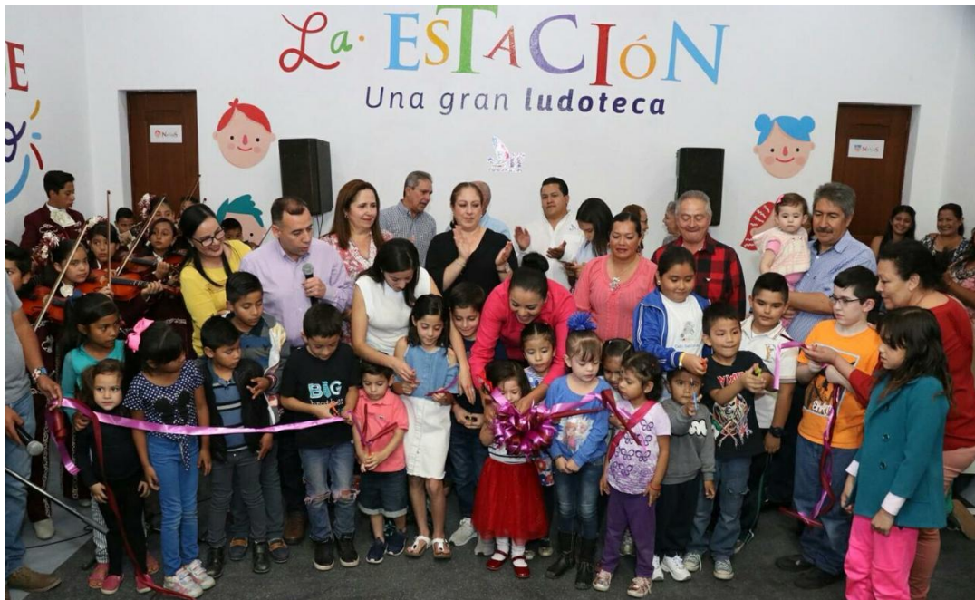
09 DE MARZO 2018. INAUGURACIÓN DE LA LUDOTECA "LA ESTACIÓN".