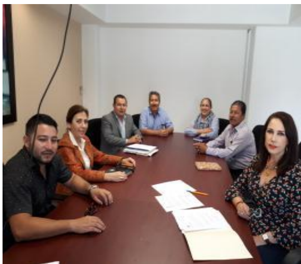
DEL 01 DE MARZO.