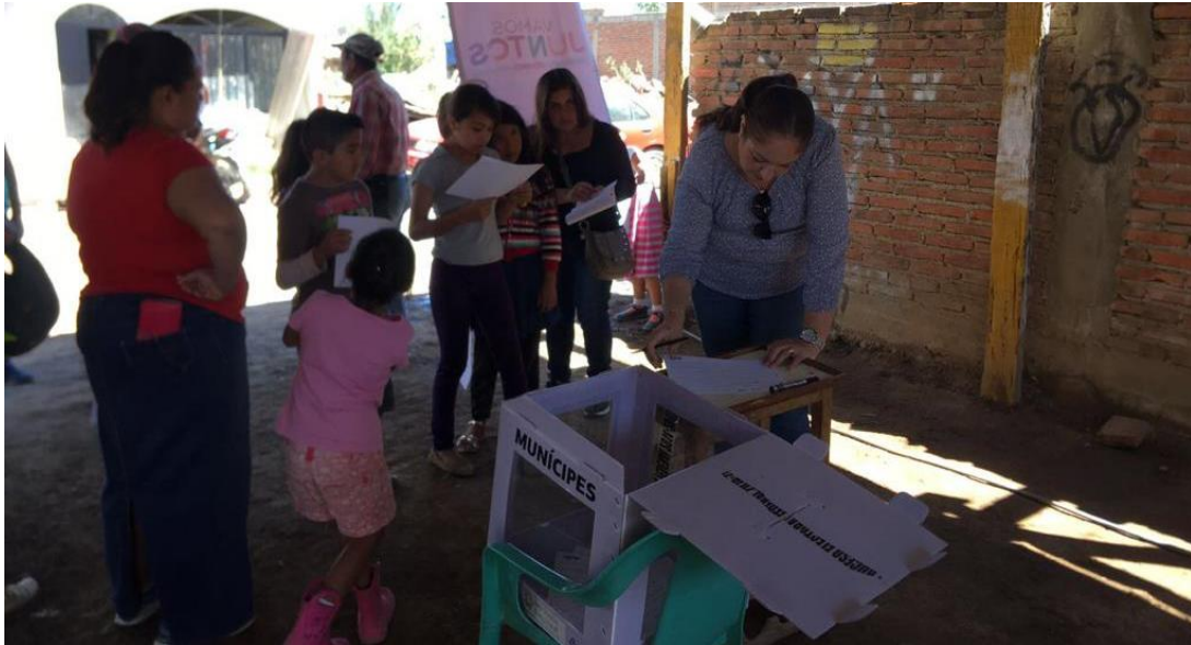
10 DE MARZO 2018. CONSULTA PUBLICA "VAMOS JUNTOS".