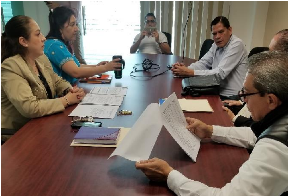
23 DE FEBRERO 2018. SESIÓN NO. 31 ORDINARIA DE LA COMISIÓN DE HACIENDA Y DE PATRIMONIO.