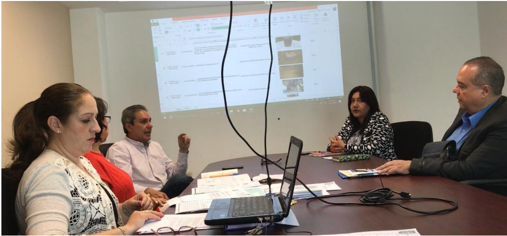
05 DE MARZO 2018. SESION 32 EXTRAORDINARIA