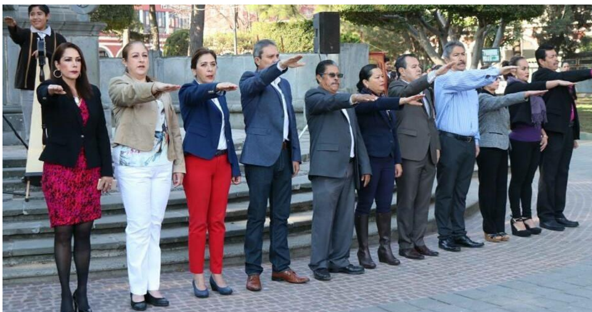
24 DE FEBRERO 2018 ACTO CIVICO ANIVERSARIO DE LA BANDERA NACIONAL.