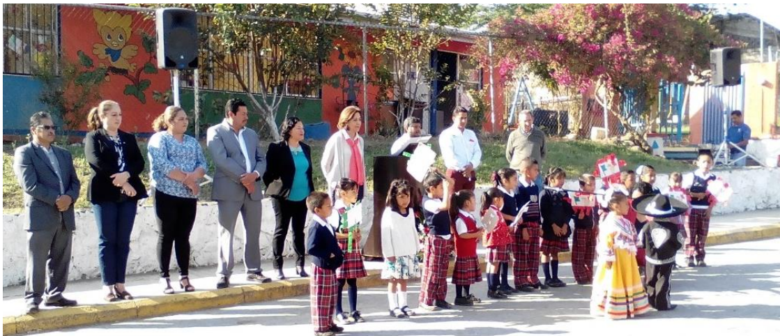
26 DE FEBRERO. ACTO CIVICO EN LA DELEGACION DE ATEQUIZAYAN, CON MOTIVO DEL DIA DE LA BANDERA.