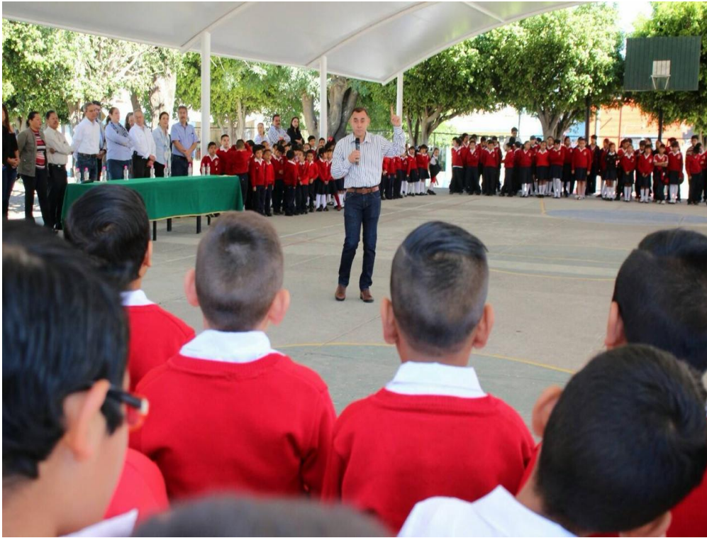
20 DE MARZO 2018. INAUGURACIÓN DE DOMO PRIMARIA CRISTOBAL COLON.