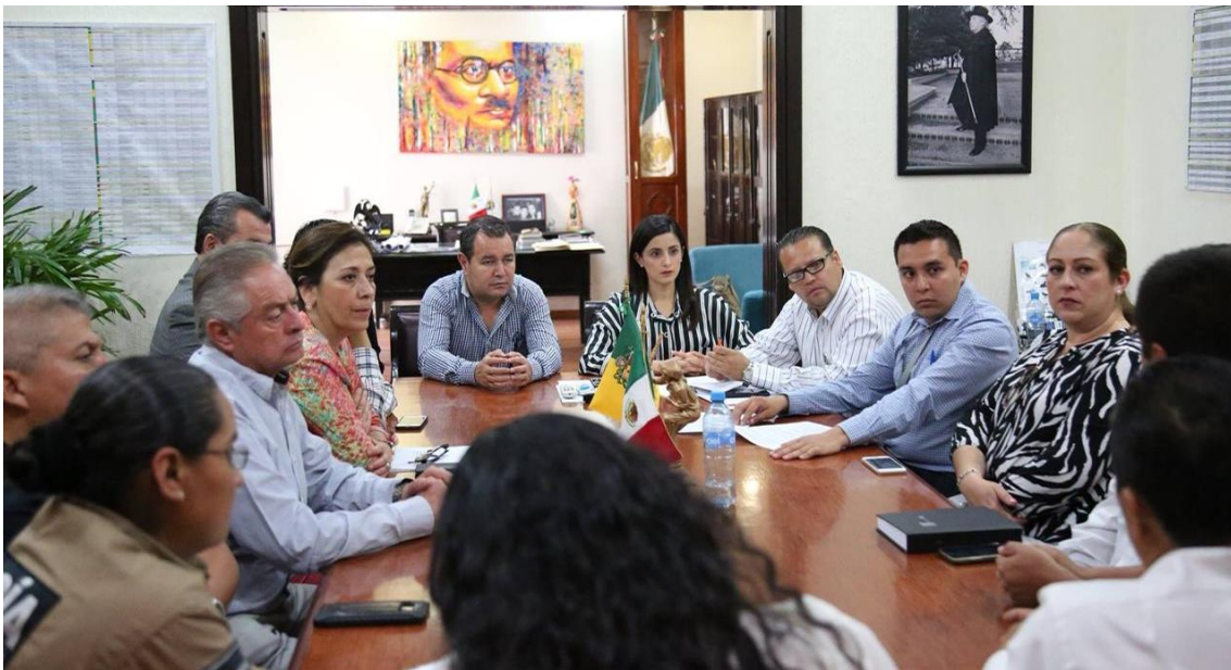
22 DE MARZO 2018. INTEGRACIÓN DEL SISTEMA PARA LA PROTECCIÓN DE NIÑOS, NIÑAS Y ADOLESCENTES.