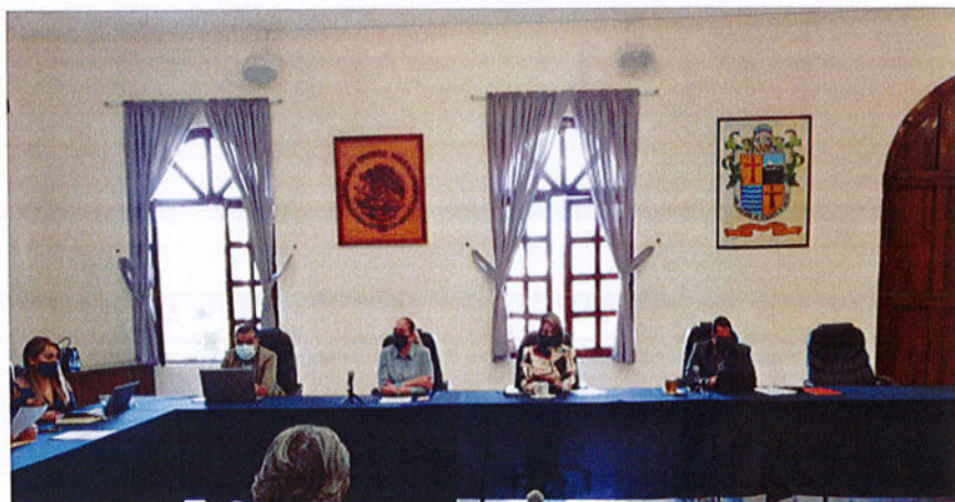
SESIÓN PÚBLICA EXTRAORDINARIA DE AYUNTAMIENTO N° 101.