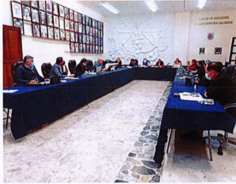
SESIÓN PÚBLICA EXTRAORDINARIA DE AYUNTAMIENTO N° 96.