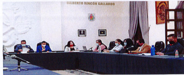
SESIÓN PÚBLICA EXTRAORDINARIA DE AYUNTAMIENTO N° 105.