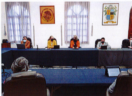
SESIÓN PÚBLICA EXTRAORDINARIA DE AYUNTAMIENTO N° 100.