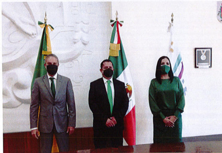
SESIÓN SOLEMNE DE AYUNTAMIENTO N° 27.