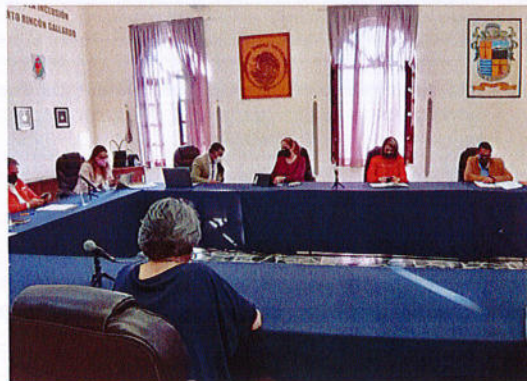
SESIÓN PÚBLICA EXTRAORDINARIA DE AYUNTAMIENTO N° 99.