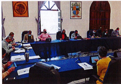
SESIÓN PÚBLICA EXTRAORDINARIA DE AYUNTAMIENTO N° 97.