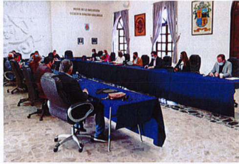
SESIÓN PÚBLICA EXTRAORDINARIA DE AYUNTAMIENTO N° 98.