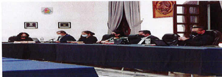
SESIÓN PÚBLICA EXTRAORDINARIA DE AYUNTAMIENTO N° 106.