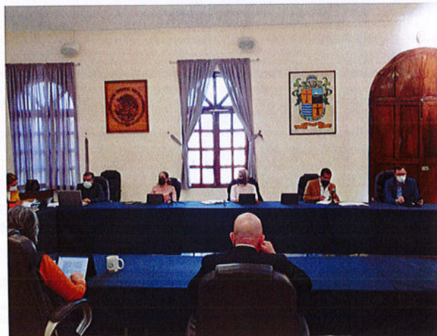
SESIÓN PÚBLICA EXTRAORDINARIA DE AYUNTAMIENTO N° 104.