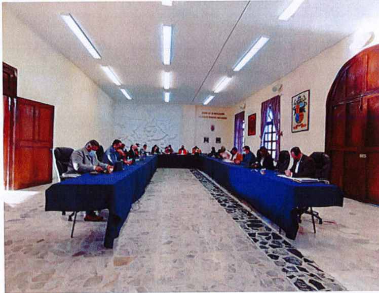
SESIÓN PÚBLICA EXTRAORDINARIA DE AYUNTAMIENTO N° 103.