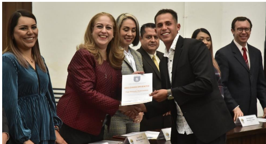
20 DE DICIEMBRE 2019. SESION SOLEMNE NO 14.