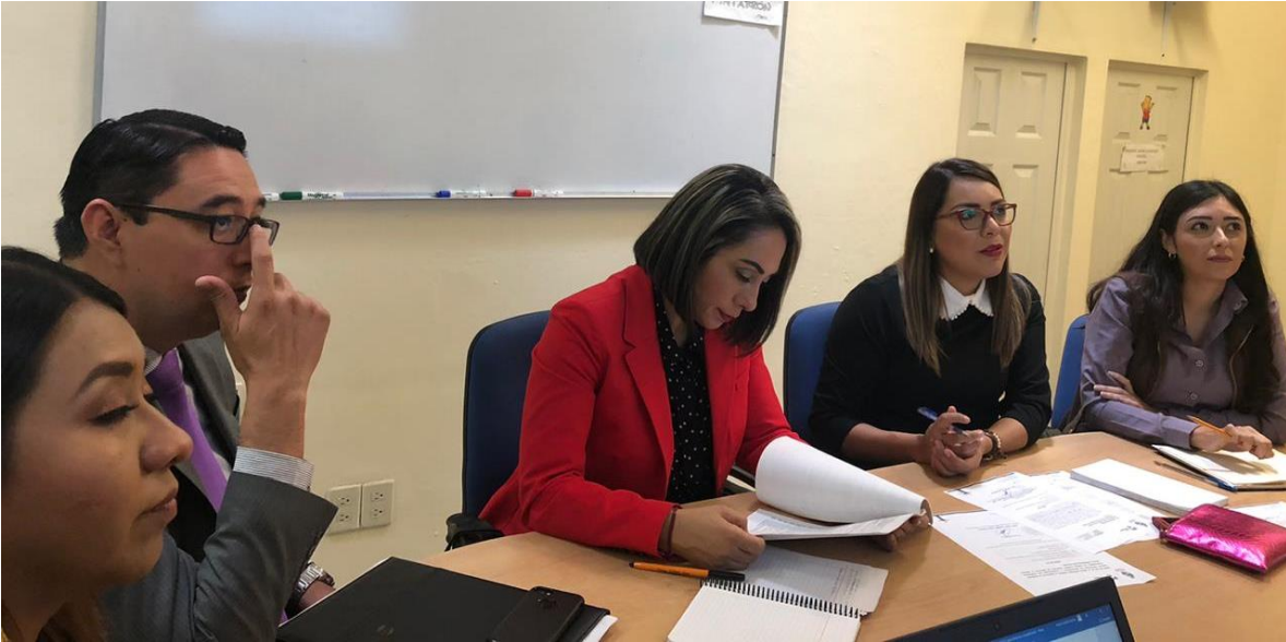
04 DE DICIEMBRE 2019. SESION ORDINARIA NO. 15 DE LA COMISION EDILICIA DE REGLAMENTOS Y GOBERNACION.