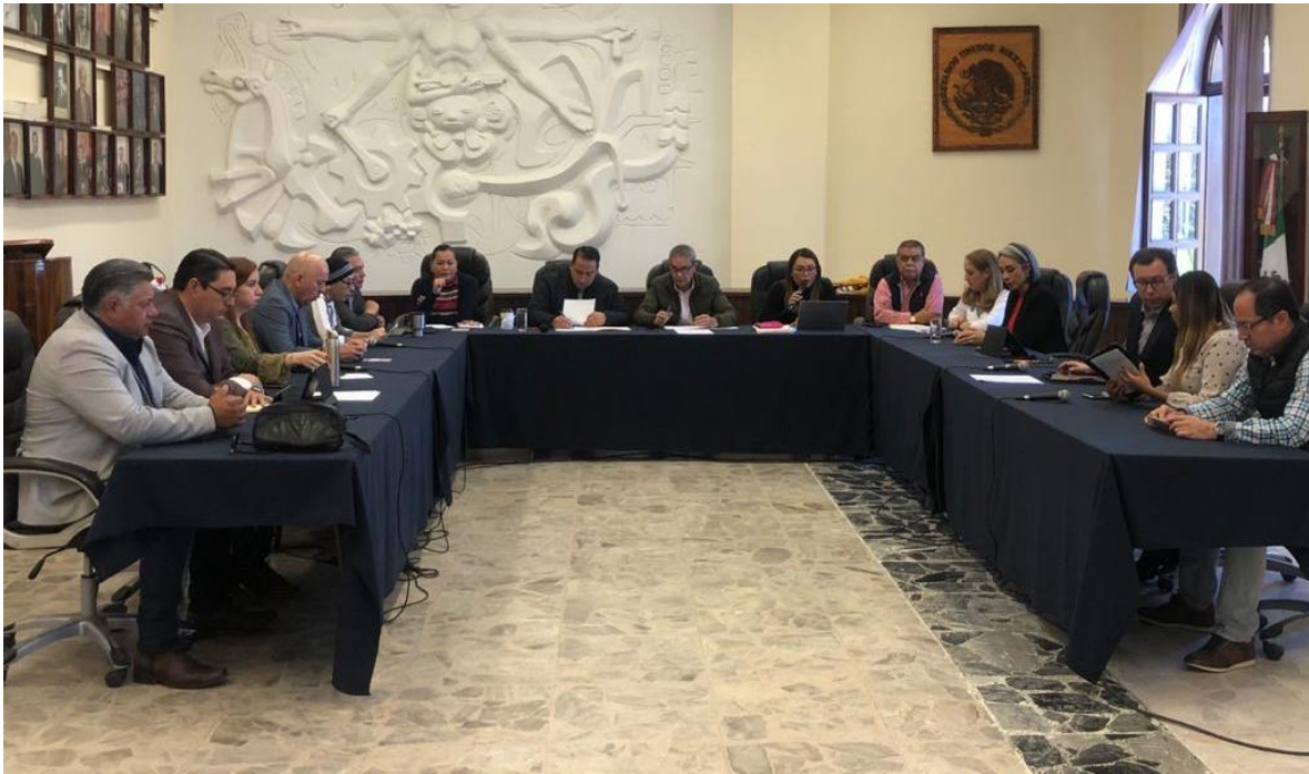
13 DE DICIEMBRE 2019. SESION EXTRAORDINARIA NO. 41