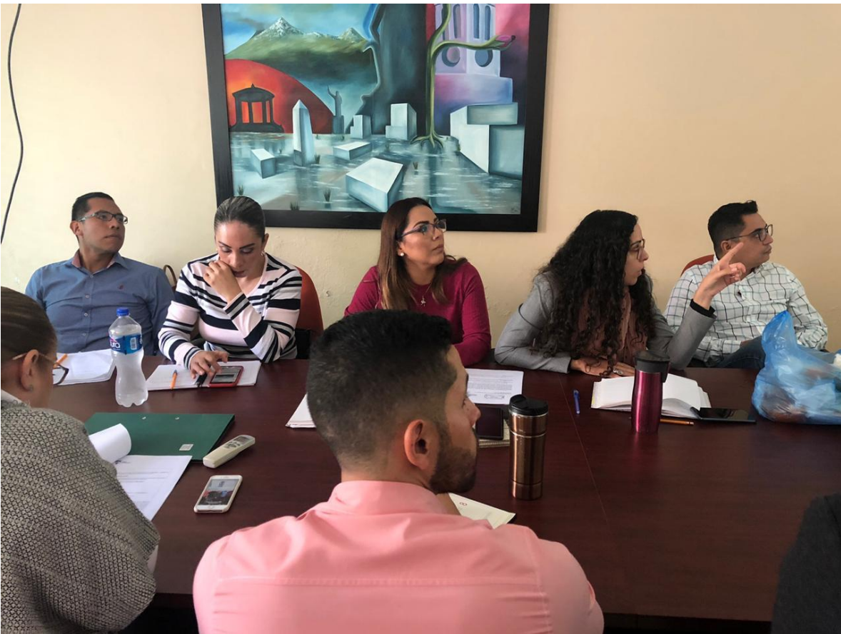
06 DE DICIEMBRE 2019. SESION ORDINARIA NO 17, DE LA COMISION DE REGLAMENTOS Y GOBERNACION EN COADYUVANCIA CON MEDIO AMBIENTE.