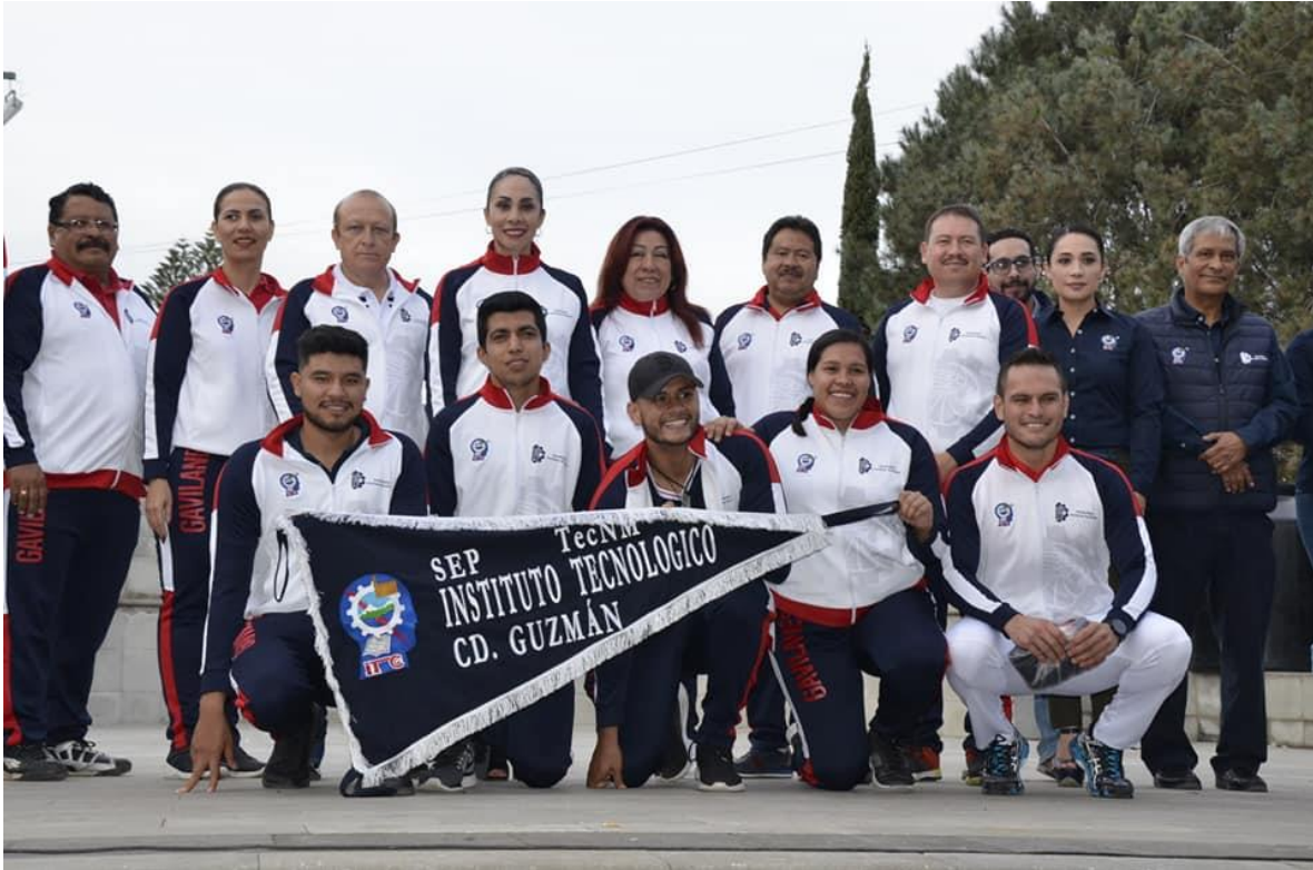
30 DE OCTUBRE 2019.