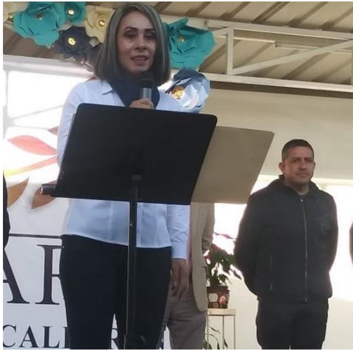
11 DE OCTUBRE 2019