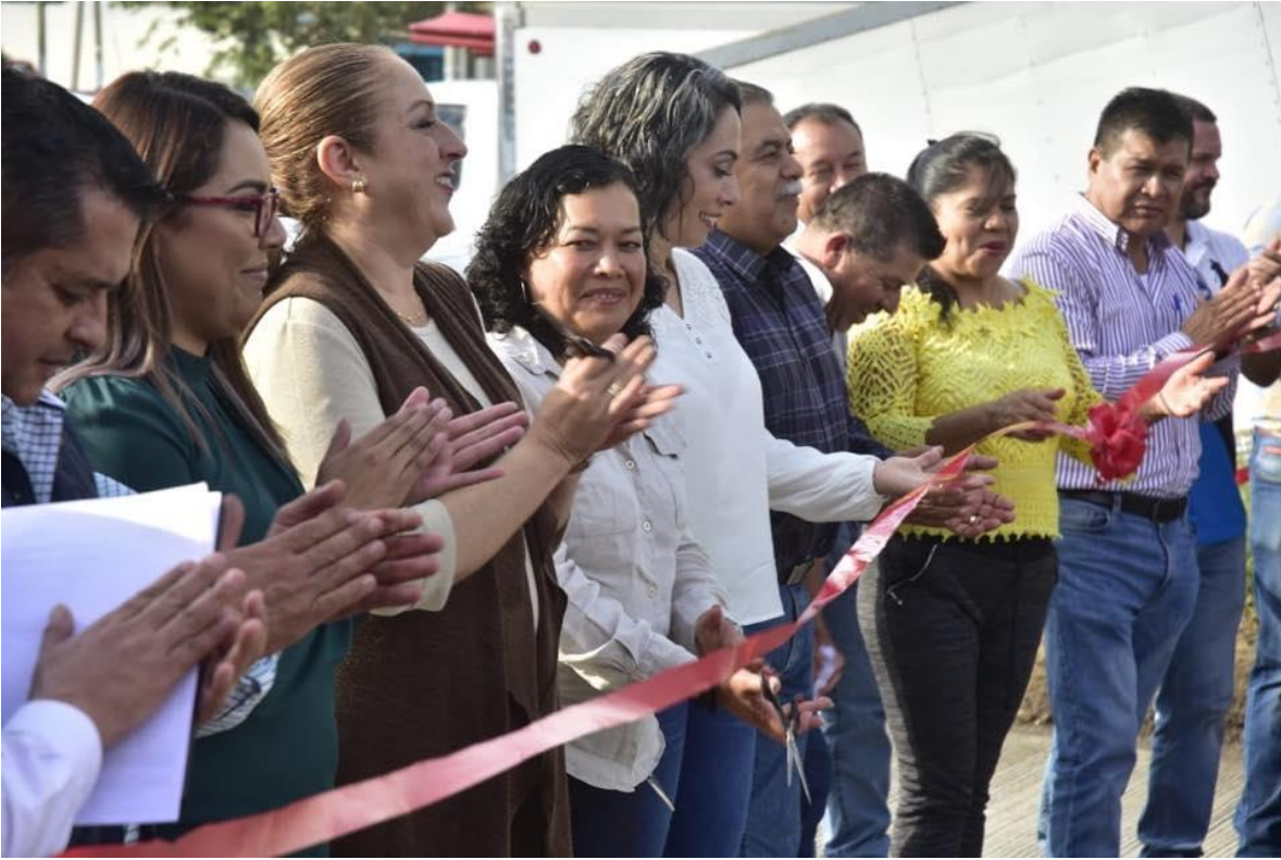
05 DE NOVIEMBRE 2019.