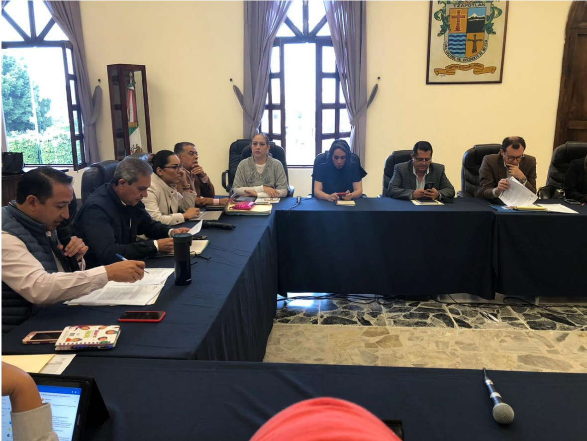
25 DE NOVIEMBRE 2019. SESION EXTRAORDINARIA NO 36.