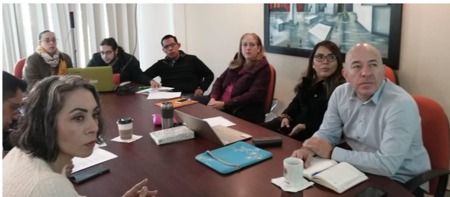
12 DE DICIEMBRE 2019. CONTINUACION DE LA SESION ORDINARIA NO. 17 DE LA COMISION DE ADMINISTRACION PUBLICA.