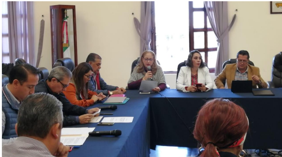
05 DE DICIEMBRE 2019. SESION EXTRAORDINARIA NO. 38