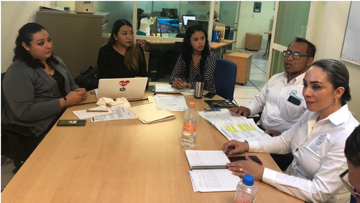
26 DE NOVIEMBRE 2019. SESION ORDINARIA NO. 07 DE LA COMISION EDILICIA DE CALLES, ALUMBRADO Y CEMENTERIOS, CONJUNTO CON LA COMISION DE REGLAMENTOS.