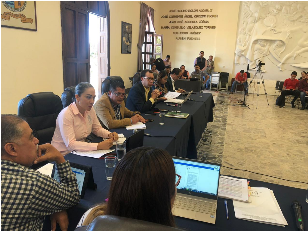
22 DE NOVIEMBRE 2019. SESION EXTRAORDINARIA NO.35