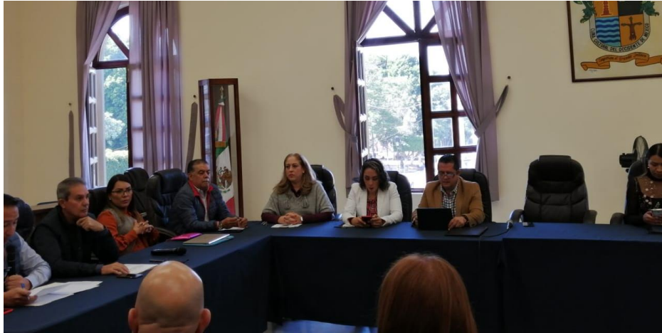
05 DE DICIEMBRE 2019. SESION EXTRAORDINARIA NO. 37