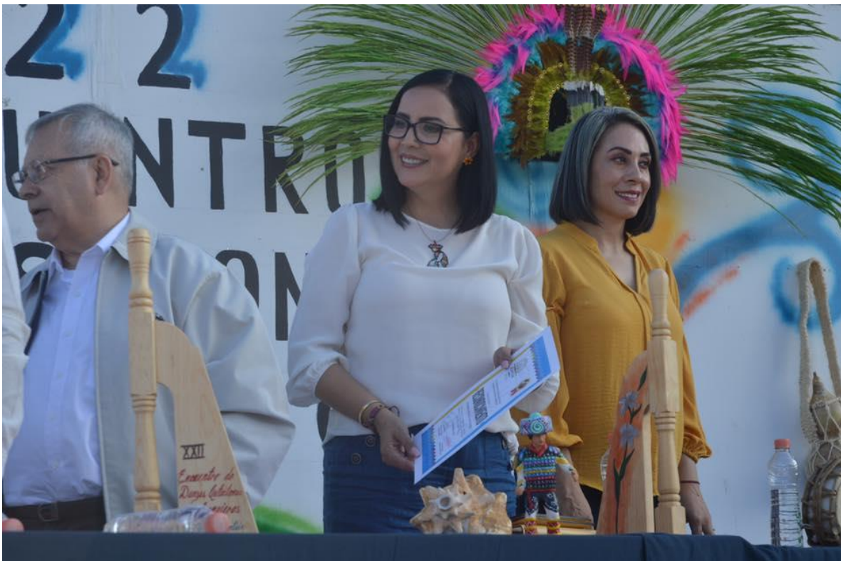
12 DE OCTUBRE 2019.