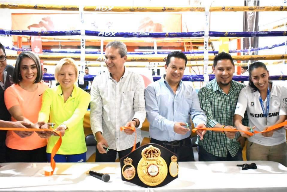
21 DE NOVIEMBRE 2019.