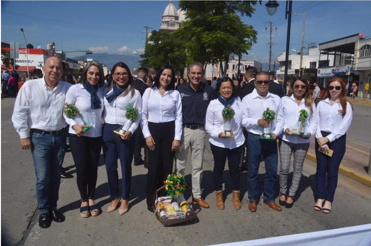
11 DE OCTUBRE 2019.