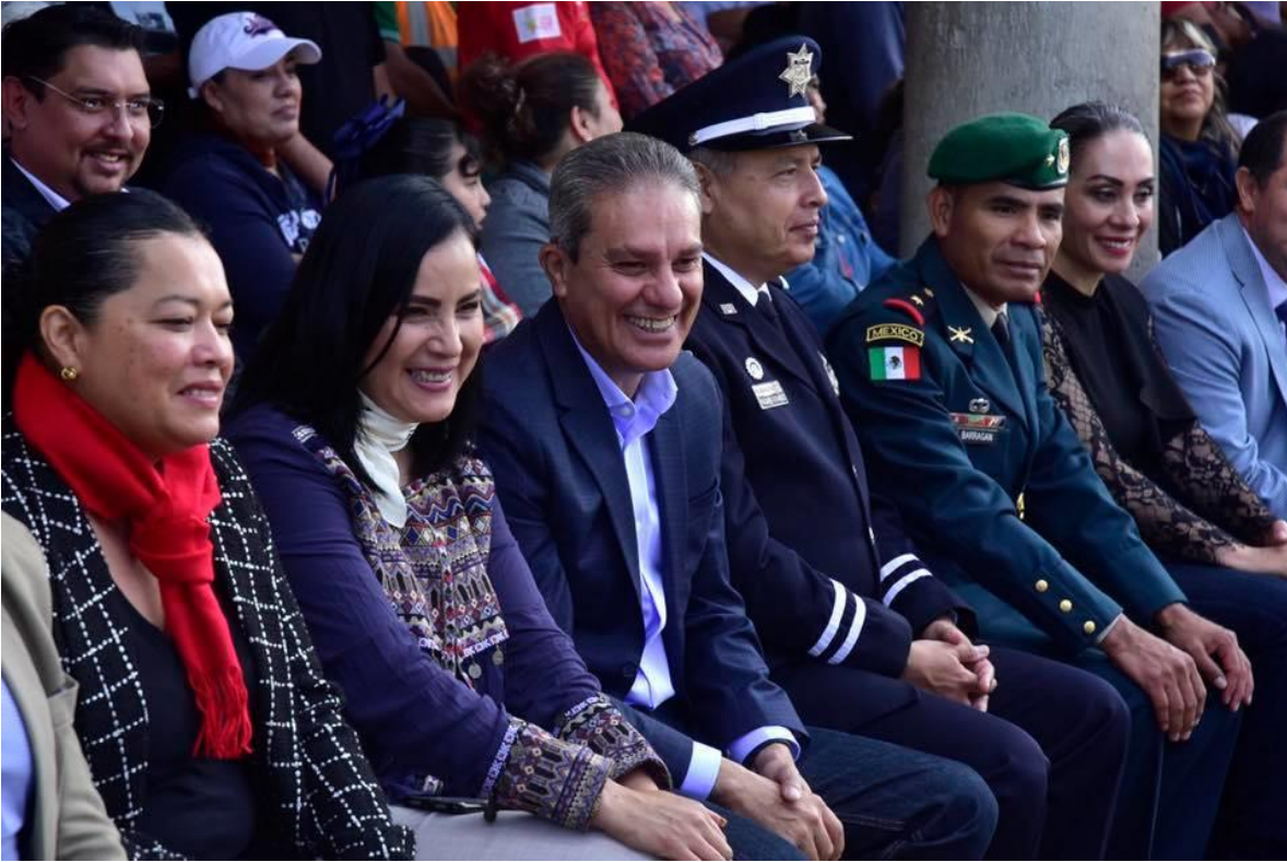
20 DE NOVIEMBRE 2019.