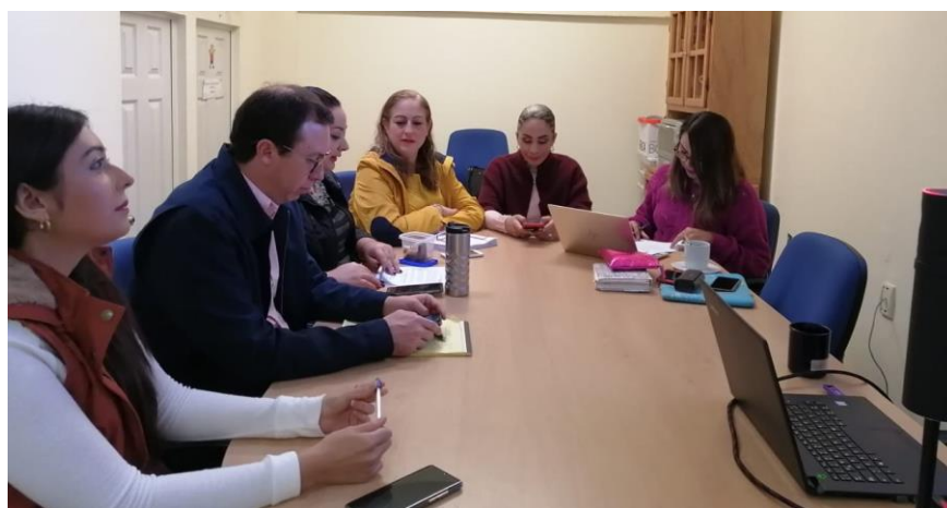
18 DE DICIEMBRE 2019. CONTINUACION DE LA SESION ORDINARIA NO. 15 DE LA COMISION DE ADMINISTRACION PUBLICA.