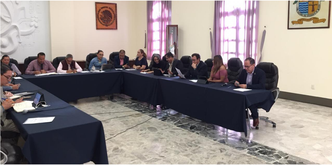
01 DE OCTUBRE 2019. SESIÓN EXTRAORDINARIA NO. 31