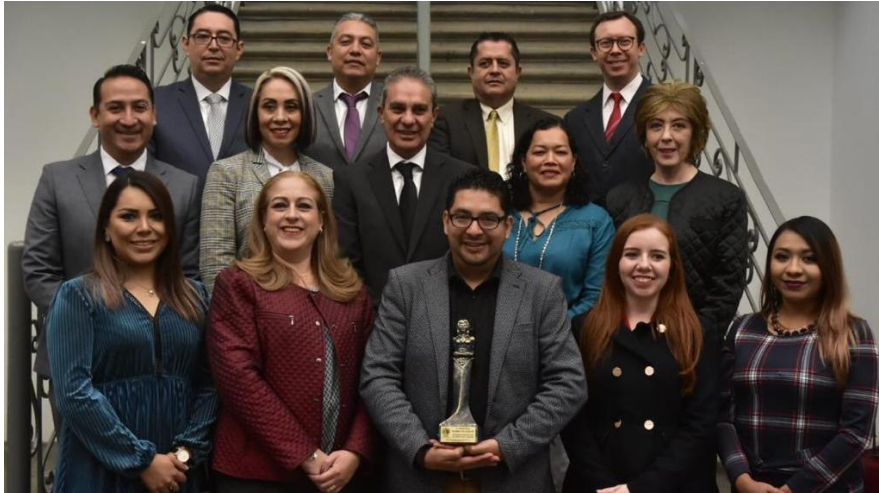
20 DE DICIEMBRE 2019. SESION SOLEMNE NO. 13