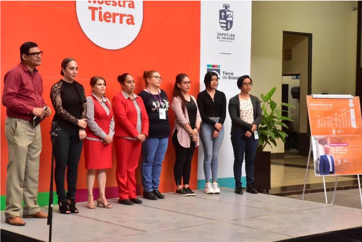
20 DE NOVIEMBRE 2019.