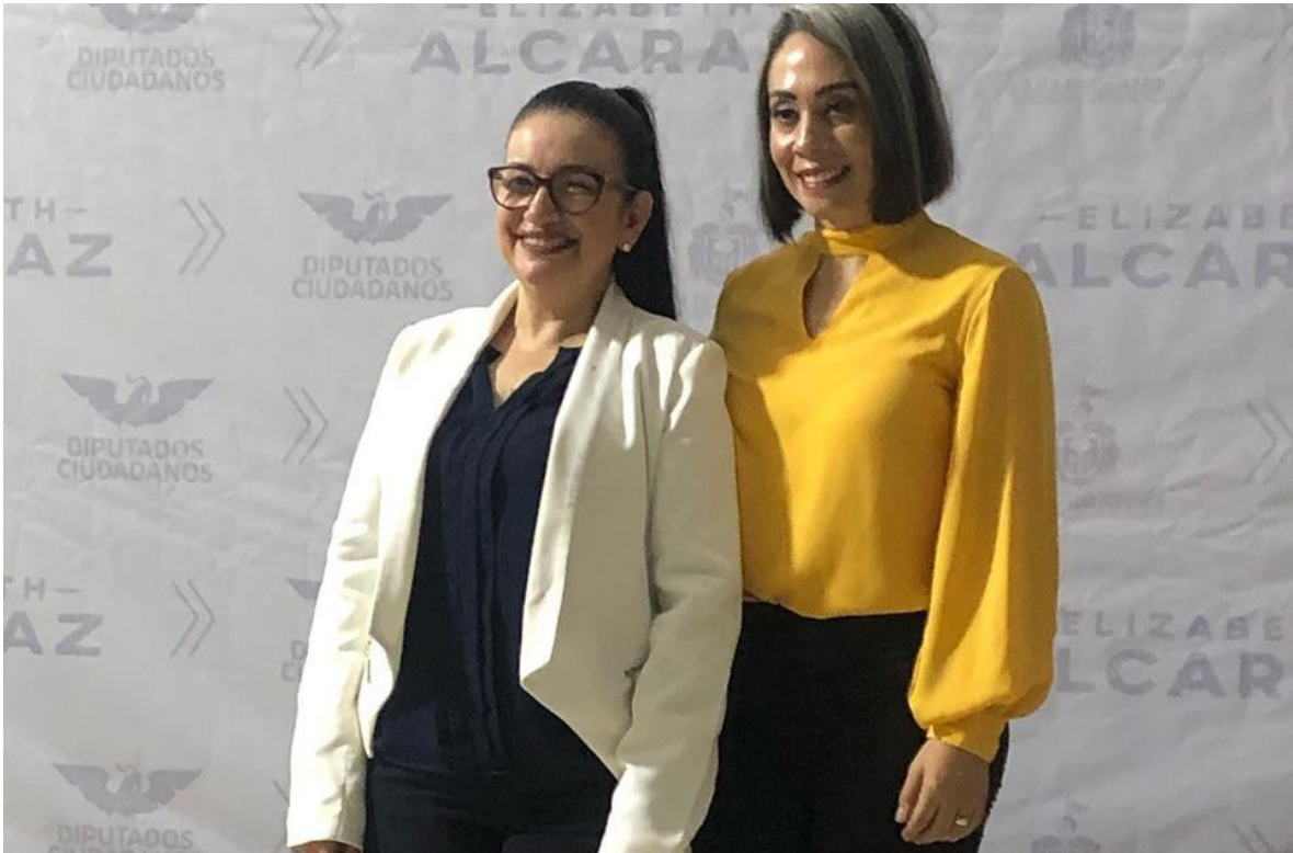
01 DE NOVIEMBRE 2019.