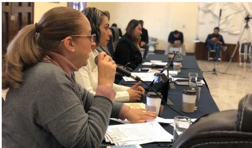
23 DE DICIEMBRE 2019. SESION ORDINARIA. NO 11.