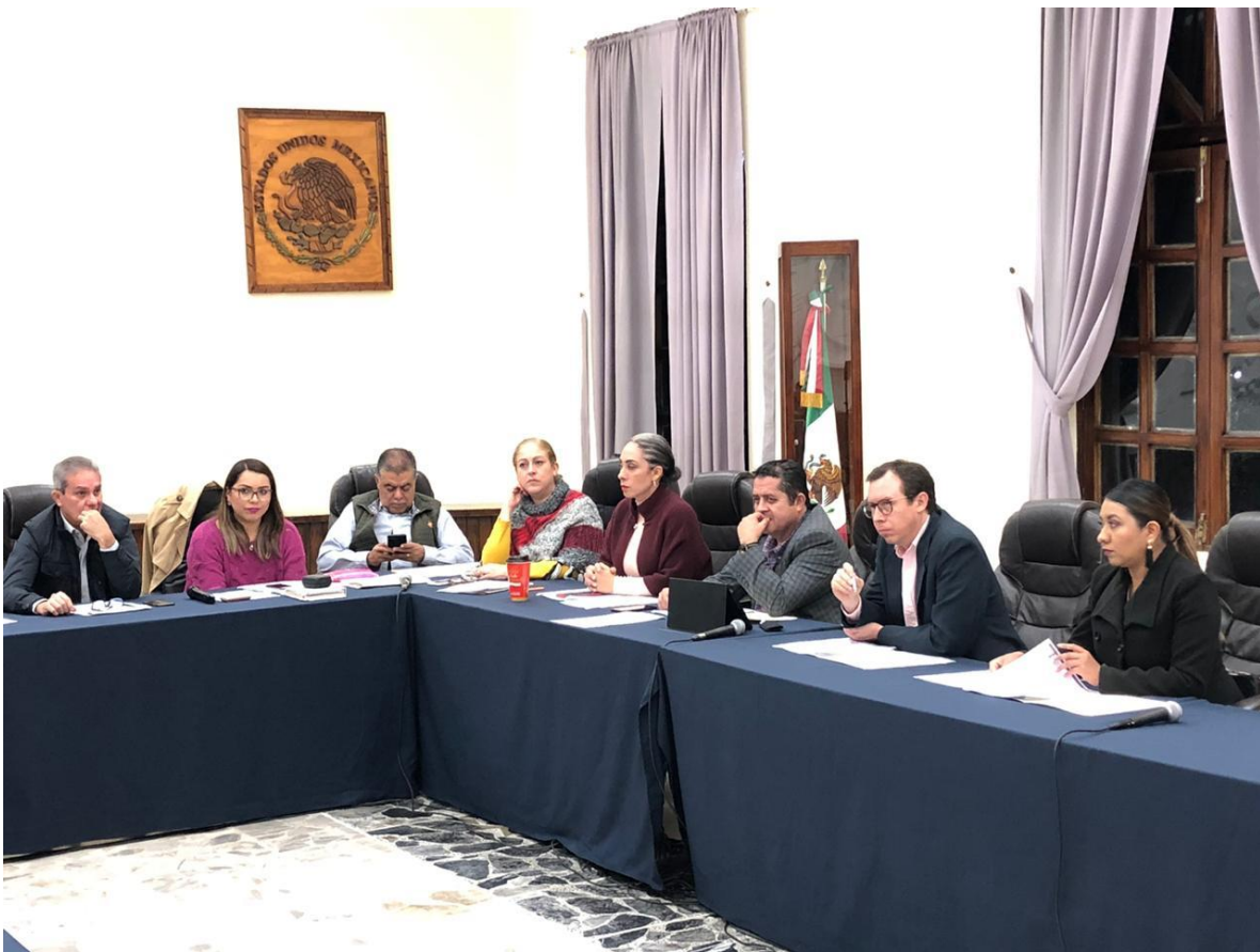
18 DE DICIEMBRE 2019. SESION EXTRAORDINARIA NO 43.