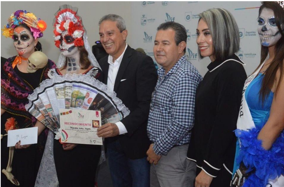
02 DE NOVIEMBRE 2019.