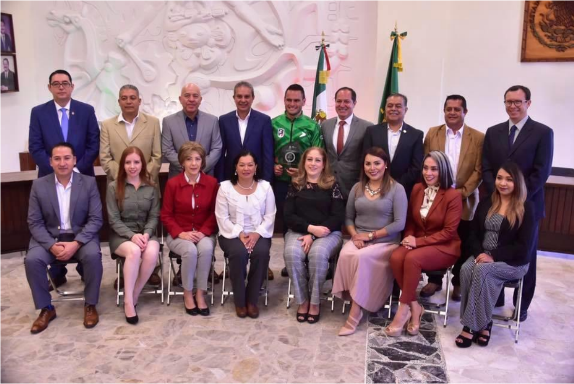
21 DE NOVIEMBRE 2019.