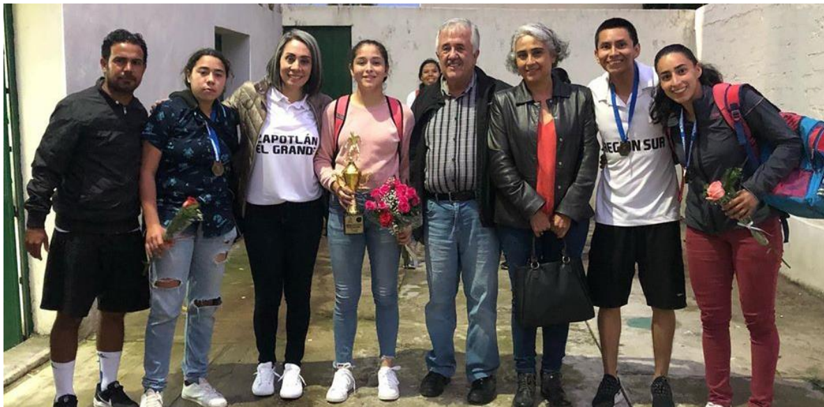
18 DE NOVIEMBRE 2019.