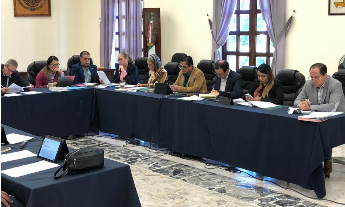
11 DE DICIEMBRE 2019. SESION SOLEMNE NO. 12