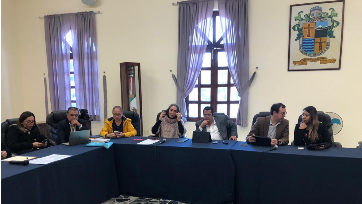
17 DE DICIEMBRE 2019. SESION EXTRAORDINARIA NO. 42