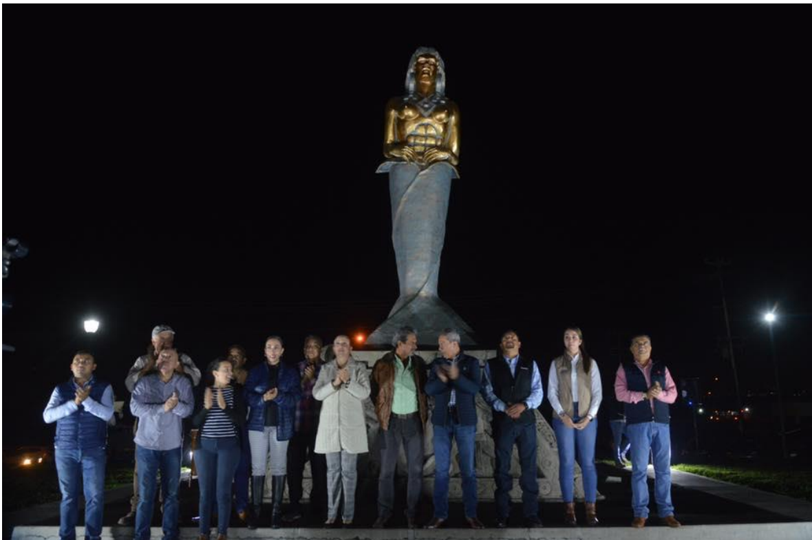
31 DE OCTUBRE 2019.