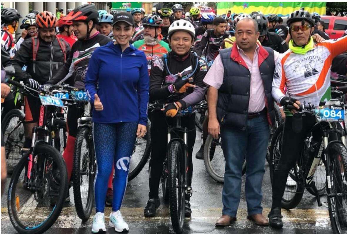
20 DE OCTUBRE 2019.