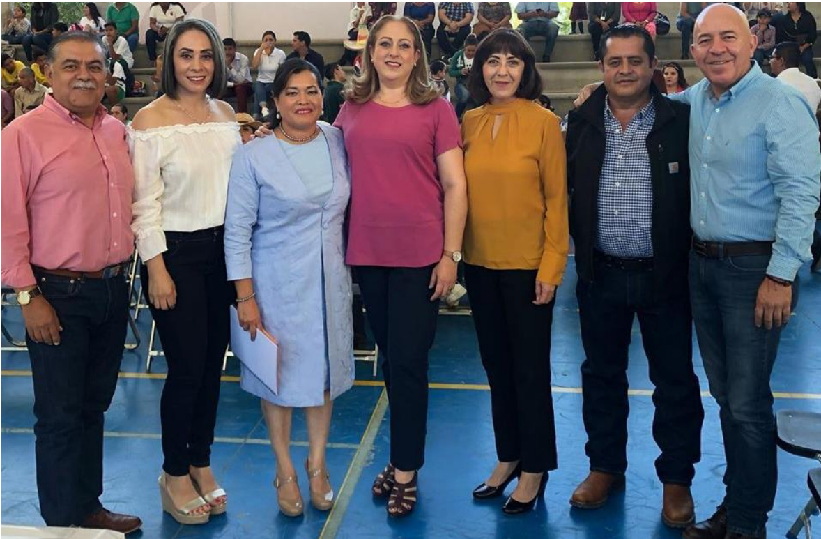
08 DE NOVIEMBRE 2019.