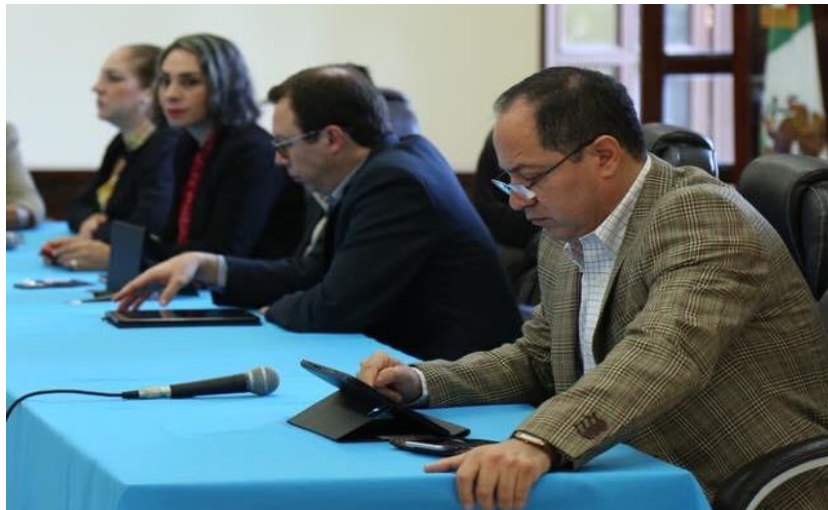
10 DE OCTUBRE 2019. SESIÓN EXTRAORDINARIA NO. 32