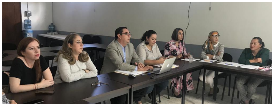
04 DE NOVIEMBRE 2019. CONTINUACION DE LA SESION ORDINARIA NO. 6 DE LA COMISION DE ADMINITRACION PUBLICA.