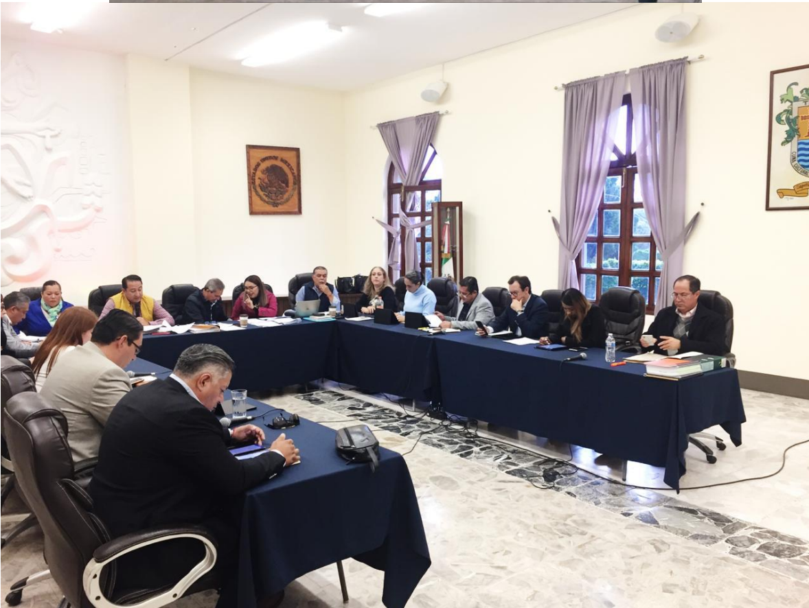
13 DE NOVIEMBRE 2019. SESIÓN ORDINARIA NO. 10