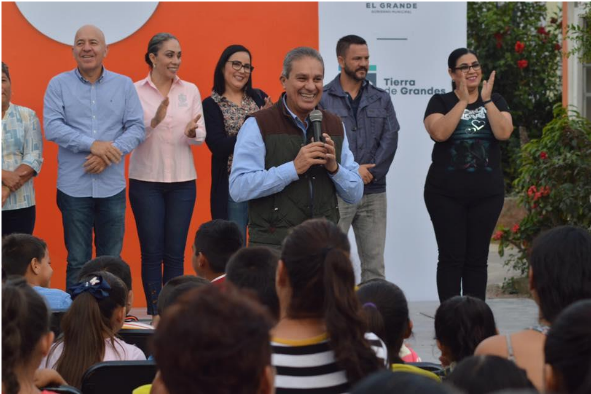
09 DE OCTUBRE 2019.