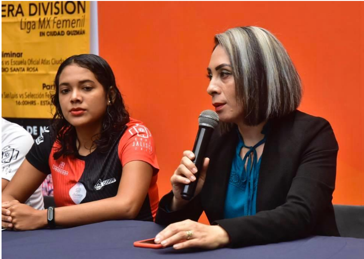
11 DE NOVIEMBRE 2019.