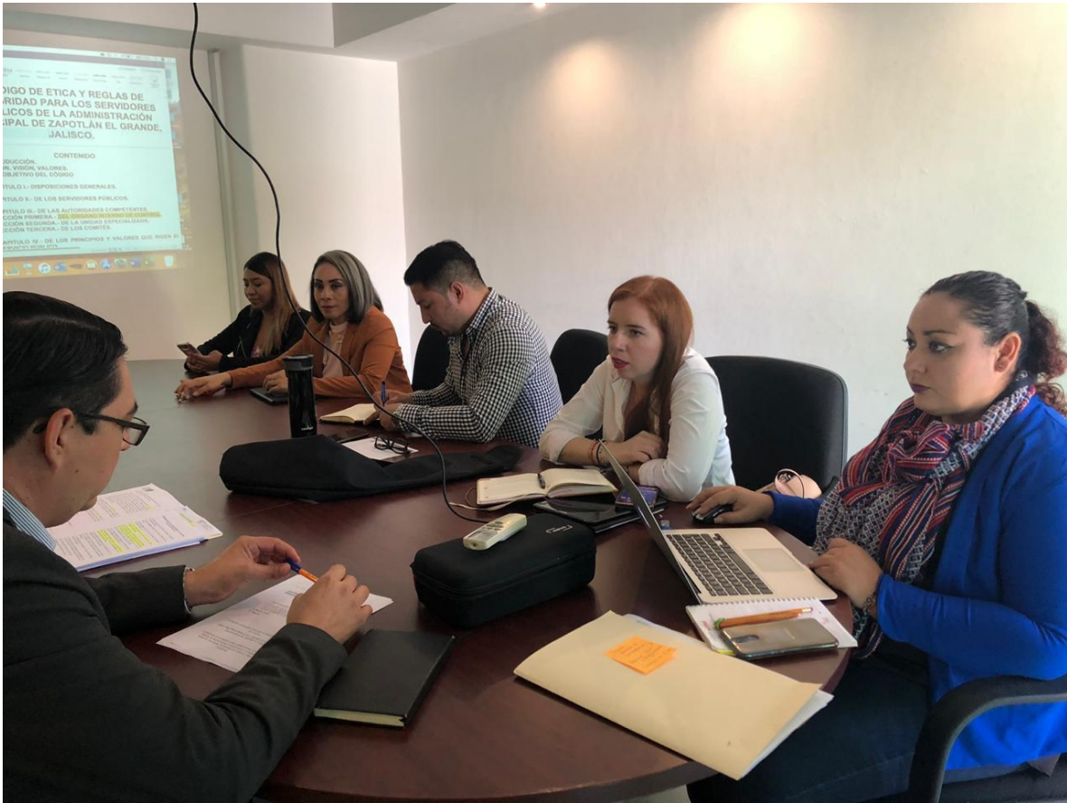
02 DE OCTUBRE 2019. CONTINUACION DE LA SESION ORDINARIA NO. 6 DE LA COMISION EDILICIA DE ADMINISTRACIÓN PÚBLICA.