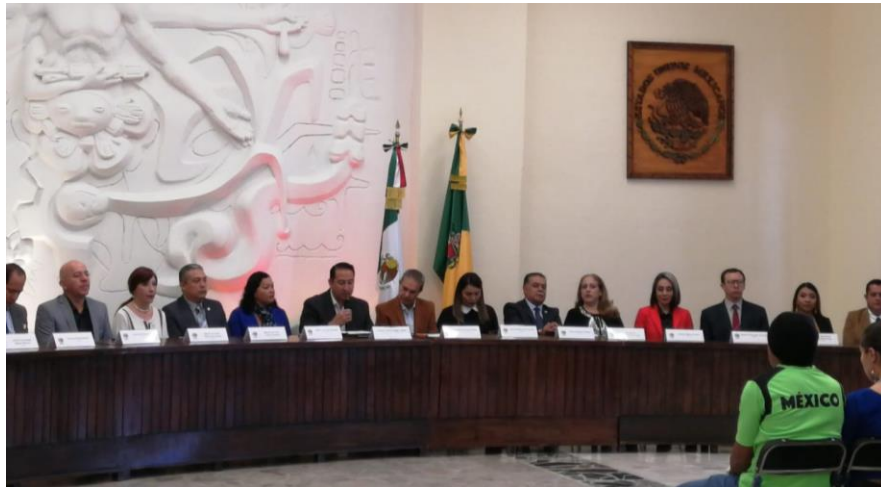
04 DE DICIEMBRE 2019. SESION SOLEMNE NO. 11