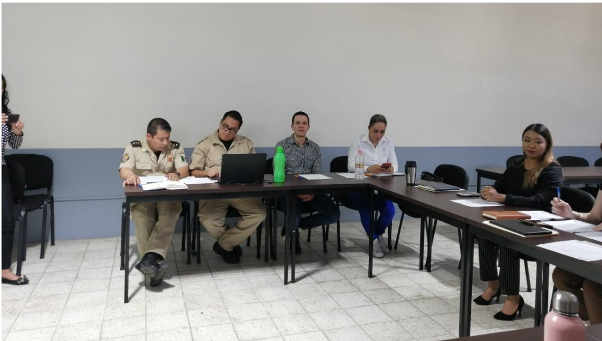
26 DE NOVIEMBRE 2019. SESION ORDINARIA NO. 06 DE LA COMISION EDILICIA DE PROTECCION CIVIL EN COADYUVANCIA CON LA COMISION DE REGLAMENTOS Y GOBERNACION.