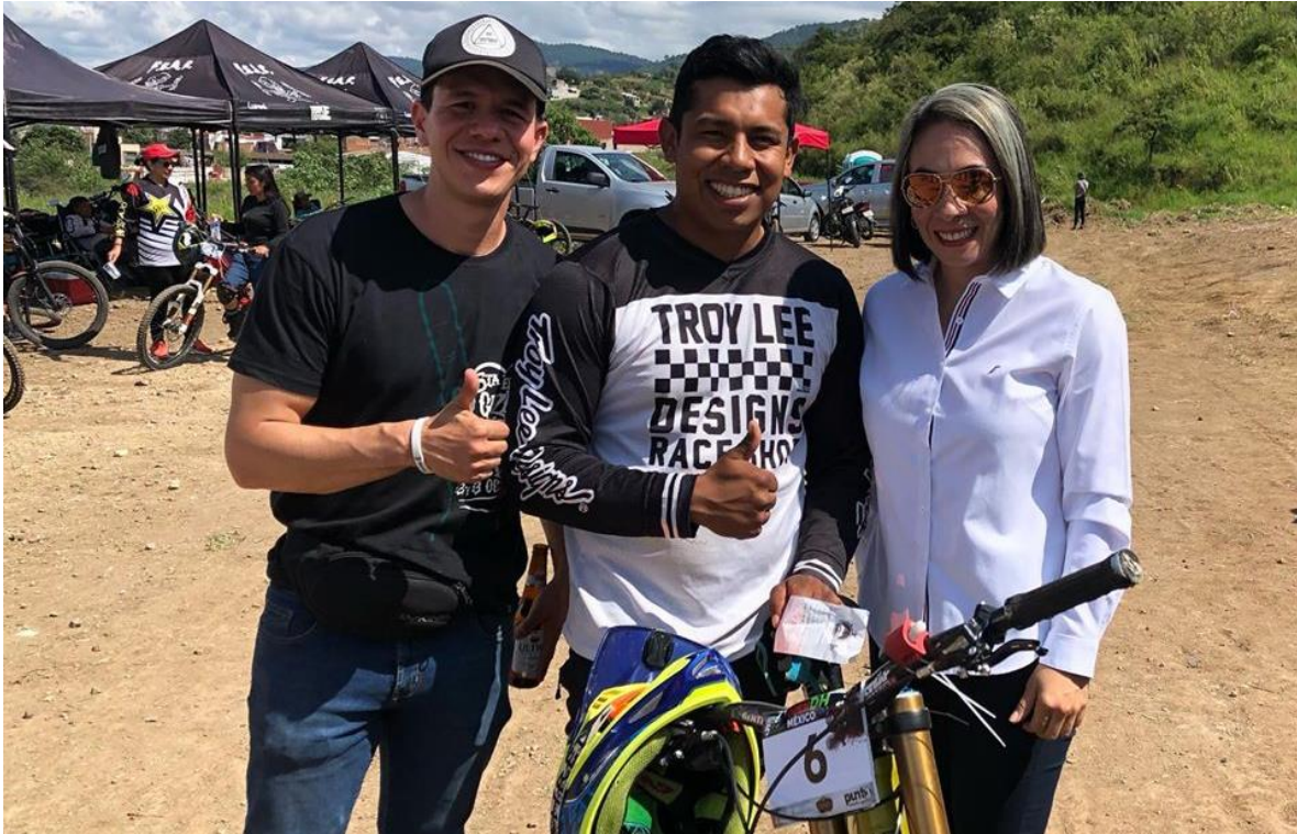
13 DE OCTUBRE 2019.