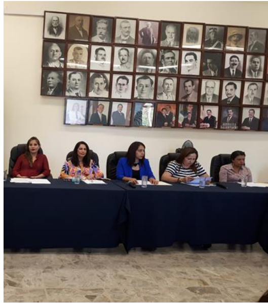
SESIÓN EXTRAORDINARIA 63