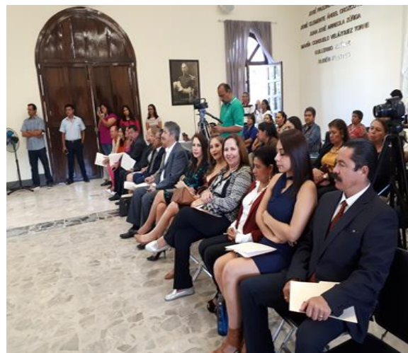
SESIÓN EXTRAORDINARIA 61 CABILDO INFANTIL