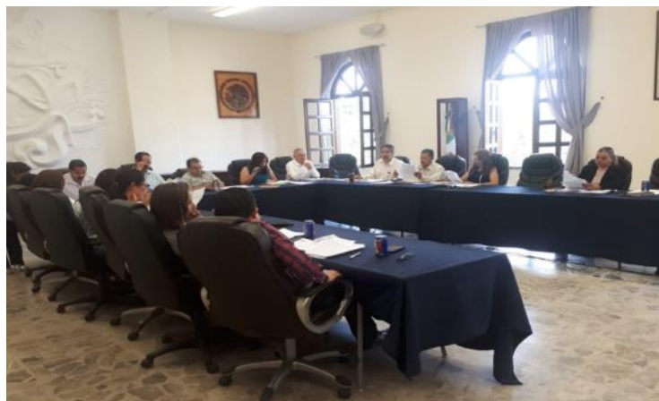
25 DE JUNIO DEL 2018 SESION EXTRAORDINARIA NÚMERO 66.