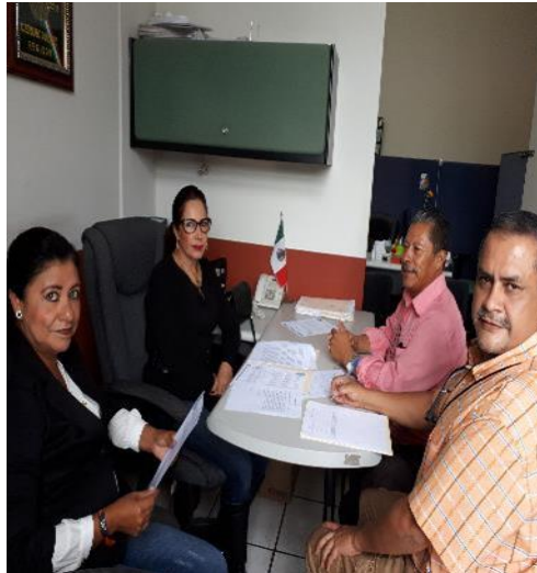
SESIÓN ORDINARIA NO.6 DE LA COMISIÓN EDILICIA PERMANENTE DE CALLES, ALUMBRADO PÚBLICO Y CEMENTERIOS, DE FECHA MARTES 12 DE JUNIO DEL 2018