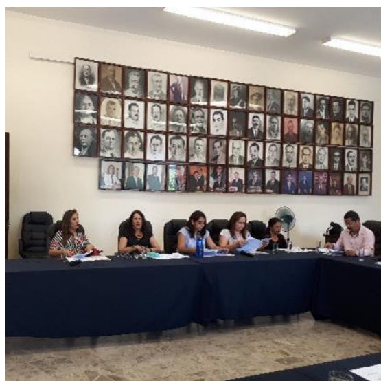
SESIÓN EXTRAORDINARIA NÚMERO 64