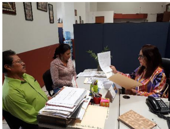
SESIÓN EXTRAORDINARIA NO.1 DE LA COMISIÓN EDILICIA PERMANENTE DE CALLES, ALUMBRADO PÚBLICO Y CEMENTERIOS, DE FECHA VIERNES 11 DE MAYO DEL 2018