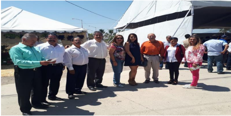
INAUGURACIÓN DE LA 11 ONCEAVA “EXPO AGRICOLA JALISCO”, IMPULSANDO EL DESARROLLO AGROALIMENTARIO DE ZAPOTLÁN EL GRANDE, JALISCO.