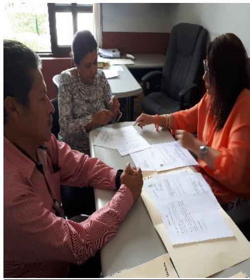
SESIÓN ORDINARIA NO.5 DE LA COMISIÓN EDILICIA PERMANENTE DE CALLES, ALUMBRADO PÚBLICO Y CEMENTERIOS DE FECHA 24 DE ABRIL DEL 2018