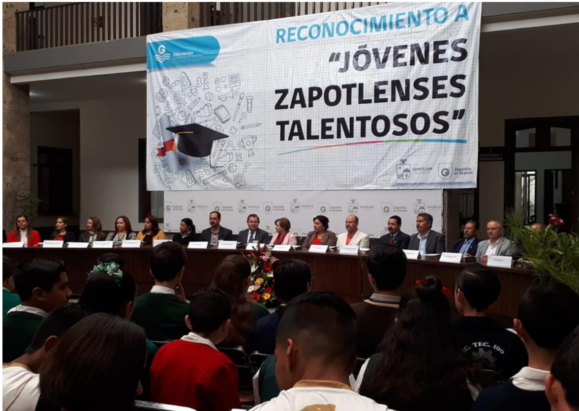
ENTREGA DE RECONOCIMIENTOS A “JÓVENES TALENTOSOS” EN PATIO CENTRAL DE PRESIDENCIA MUNICIPAL DE ZAPOTLÁN EL GRANDE, JALISCO.