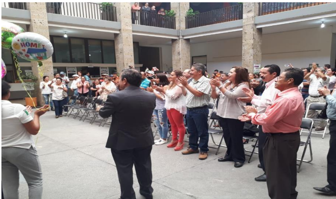
RECIBIMIENTO A LOS INTEGRANTES DEL BALLE TLAYACÁN DE CASA DE LA CULTURA, TRAS SU MARAVILLOSA PRESENTACIÓN EN EL DANCE GRAND PRIX ITALIA 2018, EN DONDE OBTUVIERON LOS PRIMEROS LUGARES EN FOLCLORE Y ESPECTÁCULO, PONIENDO EL NOMBRE DE ZAPOTLÁN, DE JALISCO Y DE MÉXICO EN EL MÁS ALTO NIVEL.