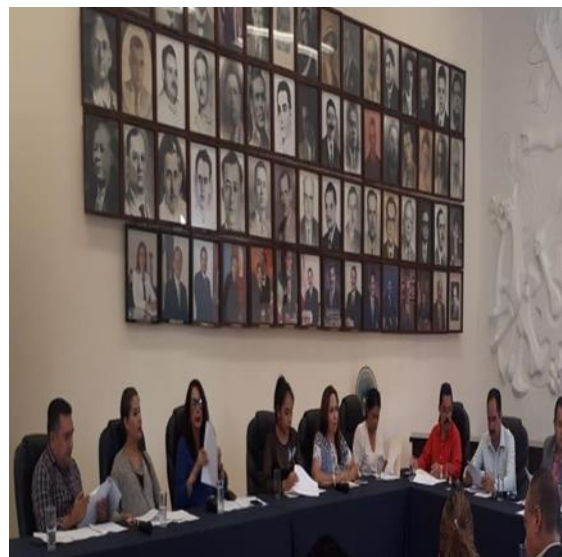
SESIÓN EXTRAORDINARIA NÚMERO 65