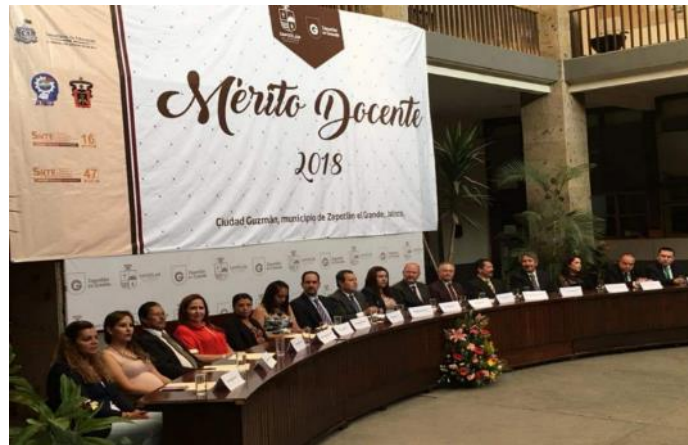
SESIÓN SOLEMNTE DE AYUNTAMIENTO NÚMERO 11