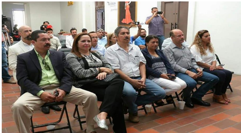
FIRMA DEL CONVENIO DE COLABORACIÓN CON LA ASOCIACIÓN MEXICANA DE TURISMO DE AVENTURA Y ECOTURISMO A.C., PARA FAVORECER LA INVERSIÓN DE EMPRESAS Y NEGOCIOS DEDICADOS AL TURISMO DE AVENTURA.