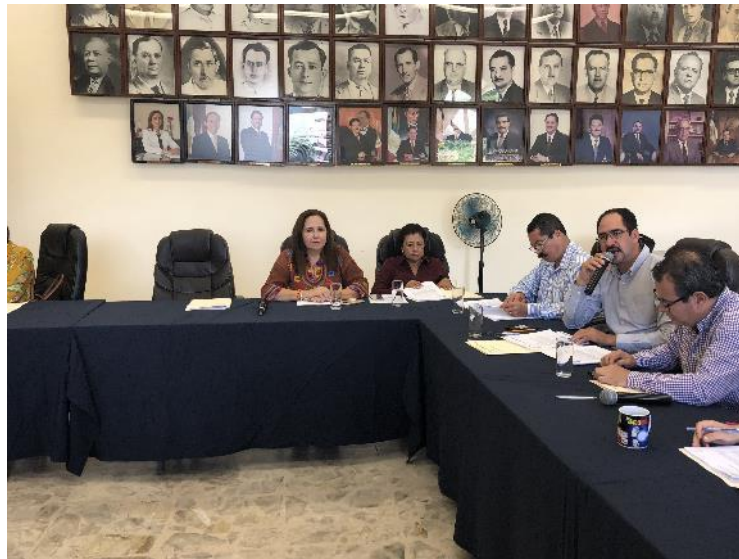
SESIÓN ORDINARIA 24