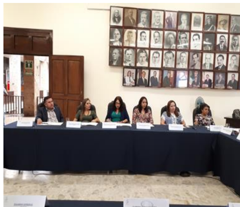
SESIÓN EXTRAORDINARIA 60