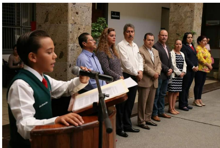
195º ANIVERSARIO DE LA CREACIÓN DEL ESTADO LIBRE Y SOBERANO DE JALISCO (1823), COMPROMETIDOS CON SU DESARROLLO.