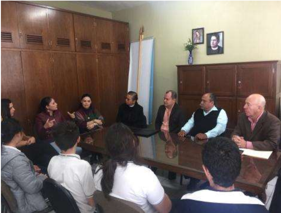
Reunión de trabajo con Directivos del Instituto Silviano Carrillo y padres de familia, para la preparación del “1º kilómetro de la Flor melífera en Zapotlán el Grande”