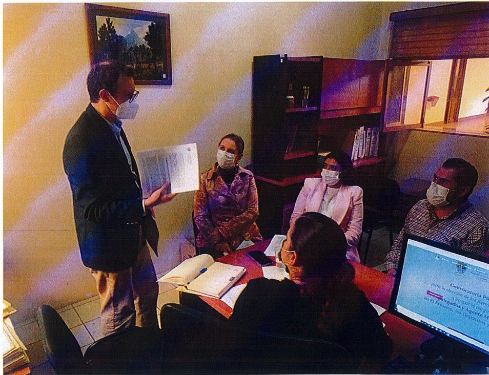
C.c.p. Archivo MCC/KCT/ascch