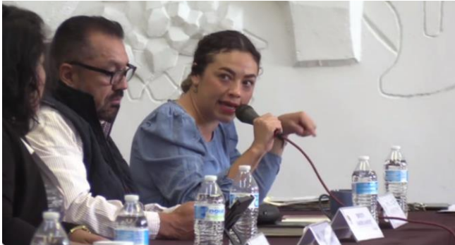
Sesión Extraordinaria de Ayuntamiento no. 67

El fallo de la licitación para la construcción de camellones, rehabilitación de carpeta asfáltica, rehabilitación de machuelos, iluminación de camellón central, jardinería y mobiliario urbano en la avenida Miguel de la Madrid Hurtado, en el ingreso poniente de Ciudad Guzmán, entre la av. Pedro Ramírez Vázquez y la av. José María González de Hermosillo, fue aprobado por el Ayuntamiento de Zapotlán en Sesión Extraordinaria.